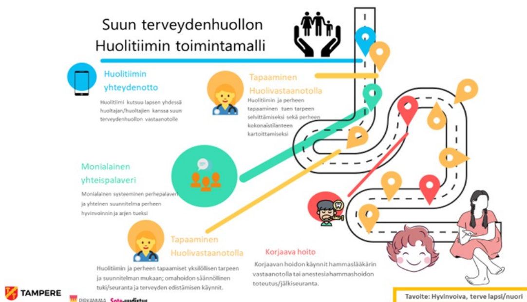
Kuva 5. Huolitiimi -toimintamalli (Innokylä 2023).

Suun terveydenhuollossa sovittiin seuranta käynneistä ennen yleisanestesiahammashoitoa ja käynnit heti yleisanestesiahammashoidon jälkeen. Huolitiimin käynneillä seurattiin omahoidon toteutumista ja tuettiin edelleen yhdessä sovittujen tavoitteiden onnistumista niin kauan, kun huolitiimi arvioi, että lapsen tai nuoren tilanne oli sellainen, että hän pärjäsi ns. tavallisessa yksilöllisesti laaditun suun hoitosuunnitelman piirissä ja perheellä oli mahdollisuus suoriutua suun terveydelle tärkeistä arjen rutiineista. Huolitiimin ja monialaisen systeemisen yhteistyön tavoitteena oli, että yhdessä mahdollistetulla vahvemmalla tuella perhe pystyi ratkaisemaan terveydelle ja hyvinvoinnille tärkeät haasteet omia voimavaroja hyödyntäen omassa arjessaan.