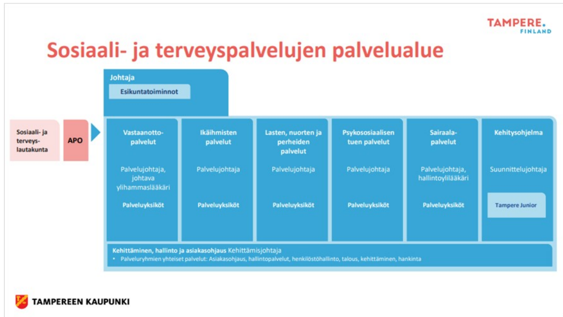
Kuva 1. Tampereen kaupungin sote -palvelujen organisaatiokaavio (Tampere 2022) .

Suun terveydenhuollolla oli Tampereella 13 toimipistettä ja Orivedellä 1 toimipiste. Toimipisteet sijaitsivat kattavasti ympäri kaupunkia ja suun terveydenhuollon vastaanottopalvelut löytyivät kaikista sosiaali- ja hyvinvointikeskuksista. Huolitiimin monialaisen systemisen yhteistyön kehittäminen yleisanestesiahammashoidon tarpeessa olevien lasten, nuorten ja perheiden osalta kohdistettiin tässä kehittämisprojektissa fyysisesti Tesoman ja Hervannan hyvinvointikeskuksissa sijaitseviin hammashoitoloihin. Yleisanestesiahammashoidon tarpeessa olevat asiakkaat ohjautuivat Huolitiimille koko kaupungin alueelta. Huomioitavaa tässä kehittämisprojektissa oli, että sosiaali- ja terveyspalvelujen toimintasuunnitelma oli Tampereen kaupungin osalta laadittu vuoden 2022 loppuun saakka, jonka jälkeen palvelut siirtyivät Pirkanmaan hyvinvointialueen järjestämisvastuulle. (Tampere 2022.)