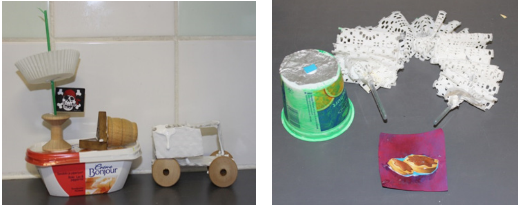
Kuvat 5 ja 6. Kierrätysmateriaaleista syntyneet esikoululaisten käsissä hienoja ystävänpäivälahjoja. Kuvat: Teresa Salmi 2014.