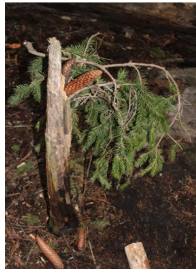
Kuvat 7 ja 8. Eko-oravan metsäretkellä kerättyjä roskia, sekä esikoululaisen tekemä luonnon taideteos.