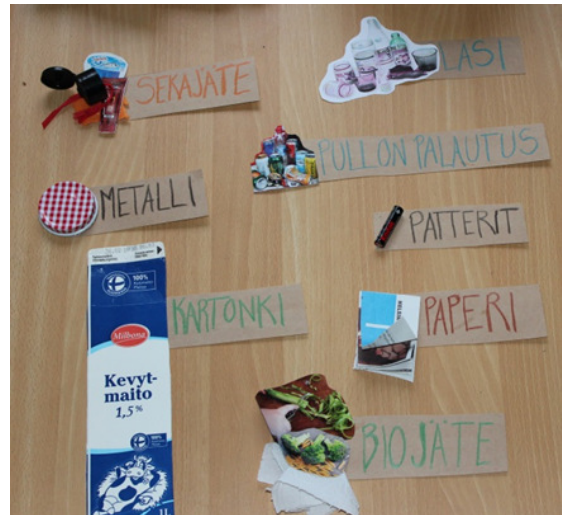
Kuvat 1 ja 2. Kierrätyspelin kortit sekä kierrätysleikin lajittelukyltit.