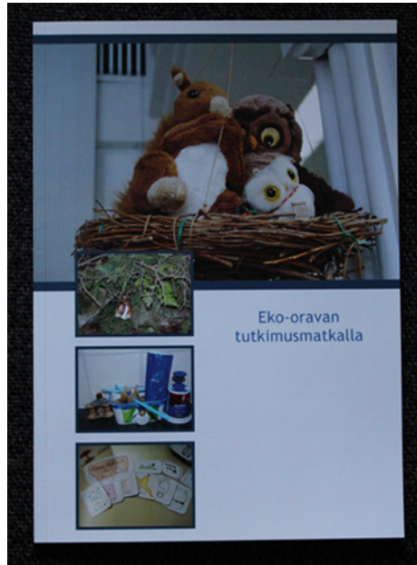
Kuva 9. Muisto/opaskirja esikouluryhmälle.

kulkea. Päiväkodissa oli myös projektimme jälkeen työstetty ihmisen luurankoa kuvaavat työt, joissa lapset olivat muotoilleet luurangoille erilaisia asentoja. Työn tarkoitus oli pohtia, millaiselta ihmisen luusto näyttää esimerkiksi haarahypyn aikana. Lapset olivat kuitenkin halunneet jatkaa luurankojen työstöä koristelemalla niitä kierrätysmateriaaleilla eri teemojen mukaisiksi.