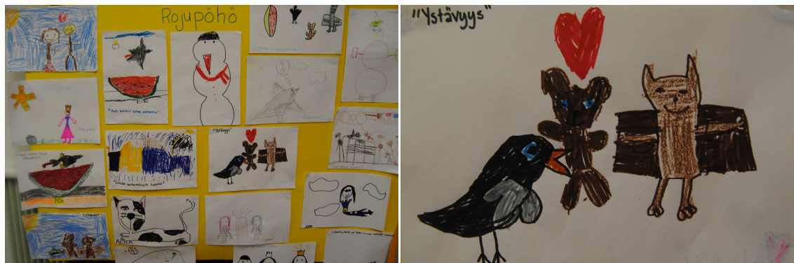
Kuvat 3 ja 4. Esikoululaille heränneitä ajatuksia Rojupöhö-nukketeatterista.

Käsittelimme nukketeatterista esille nousseita teemoja – muun muassa ystävyyttä, kierrättämistä ja tavaroiden hamstraamista – piirtämisen kautta heti nukketeatterin päättämisen jälkeen. Aluksi keskustelimme lasten kanssa nukketeatterista ja pohdimme, onko tärkeämpää omistaa paljon tavaroita vai hyviä ystäviä. Keskustelun jälkeen pyysimme, että lapset piirtäisivät teatterista tärkeimpänä pitämiään asioita paperille ja muutamalla sanalla kuvailisivat meille piirtämänsä kuvaa. Kirjasimme jokaiseen kuvaan lasten sanomia aiheita, kuten ”rakkaus” ja ”ystävyyt”, ja lopuksi teoksista koottiin suuri ”Rojupöhö”- taulu päiväkodin seinälle.