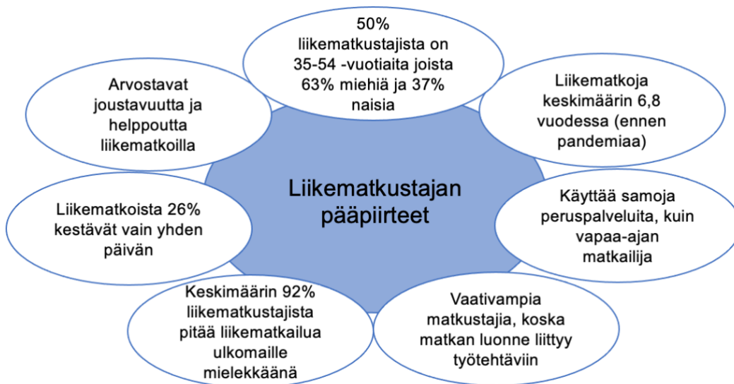
Kuva 4. Liikematkustajan pääpiirteet (mukaan AHLA 2015, Flynn 2023 & Lavanchy 2018)

Kaikista liikematoista keskimäärin 81 % ajetaan omalla kulkuneuvolla, kuten autolla. 16 % liikematoista lennetään. (Flynn 2023.) Liikematkailijoista 63 % on miehiä ja 50 % liikematkailijoista on 35–54-vuotiaita (American Hotel & Lodging Association AHLA 2015). Keskimääräinen liikematkailija matkusti ennen pandemiaa 6,8 liikematoa vuodessa (Kuva 4). (Flynn 2023).