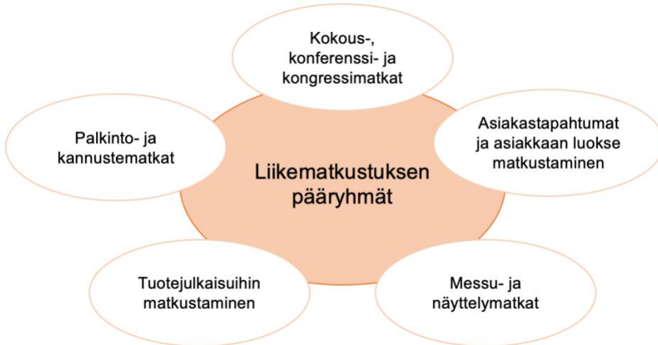
Kuva 2. Liikematkustuksen pääryhmät (Mukaillen Verhelä 2000, Ammattiliitto Pro s.a & UNWTO s.a)

Liikematkustukseen ei kuulu päivittäisiä työmatkoja kodin ja työpaikan välillä, eikä vapaa-ajanmatkoja tai lomamatkoja (TMC Finder s.a). Liikematkailijana toimii yleensä yrittäjä tai yrityksen johtoon, toimihenkilöihin tai työntekijöihin kuuluva henkilö. Liikematkustusta voi olla sekä omassa kotimaassa että globaalisti ulkomaille tapahtuvaa liikematkailua. Matkailun perusajattelumalleissa liikematkustuksen vastakohtaksi ajatellaan usein vapaa-ajan matkustaminen. (Verhelä 2000,10.)