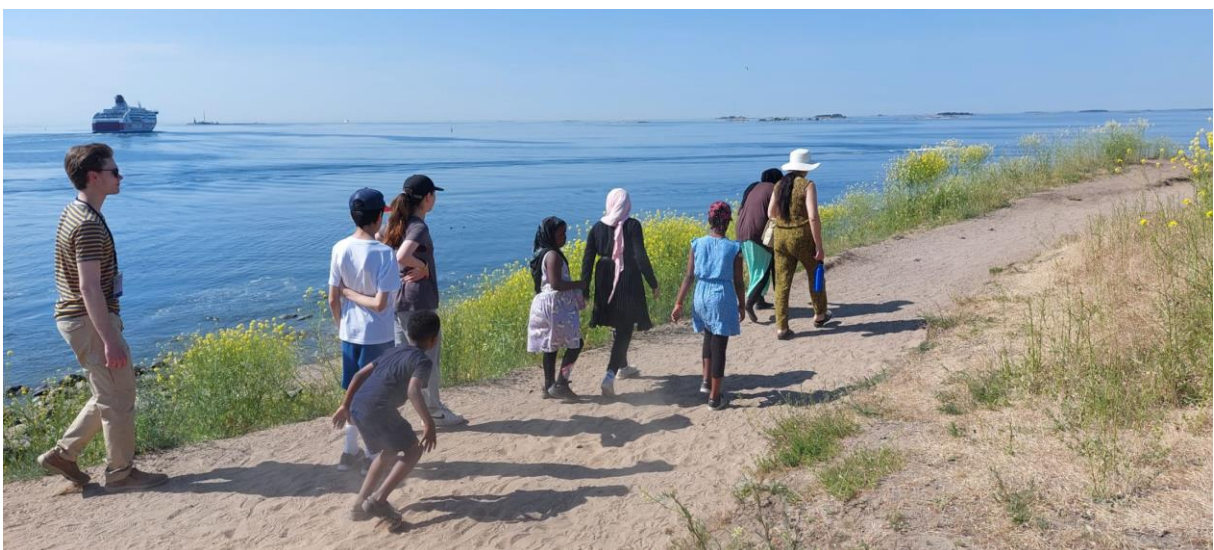
Kuva1 Kuvassa ihmisiä eri kulttuuritaustoista kävelemässä meren äärellä

Toimintamallia pilotoitiin Suomen leirikoulu yhdistyksen omassa leirikeskuksessa keväällä ja kesällä 2023. Hankkeen pilottivaiheen aikana järjestimme kaksi yhteistyöleiriä Plan Suomen Voimaisia -hankkeen kanssa. Osallistujaryhmä koostui maahanmuuttajataustaisista perheistä. Leireille osallistui yhteensä 71 henkilöä. Näistä 7 henkilöä oli yhteistyötahon omia ohjaajia. Asiakkaista aikuisia oli 23 %, nuoria (8–18 v) 40 % ja lapsia (alle 8 v) 37 %. Leireille osallistuneet perheet tulivat erilaisista kulttuuritaustoista. Perheistä yksi puhui hindiä, kolme perhettä amharaa, kolme perhettä daria ja farsia, kuusi perhettä somalin kieltä ja neljä arabiaa. Lisäksi leireillä käytettiin yhteisenä kielenä suomea sekä englantia.