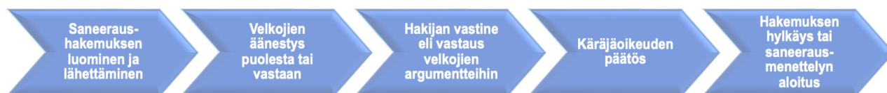
Kuva 4. Saneeraushakemusprosessin eteneminen

Prosessi alkaa hakemuksen luomisesta ja lähettämisestä käräjäoikeudelle, josta se lähetetään eteenpäin velkojille äänestettäväksi. Velkojat voivat puoltaa tai vastustaa hakemusta, mutta vain sillä perusteella, että yritys ei vastaisi aiemmin mainittuja kelpoisuusvaatimuksia. Hakija saa tilaisuuden antaa vastauksen velkojien äänestykseen, jonka jälkeen asia siirtyy lopullisesti käräjäoikeuden harkintaan ja tuomari tekee lopullisen päätöksen hakemuksen hylkäyksestä tai menettelyn aloittamisesta. Velkojien kanta voi vaikuttaa tuomarin päätökseen, mutta päätös voi olla velkojien vastustuksesta huolimatta myönteinen hakijan vastineen ja tuomarin harkinnan mukaan.