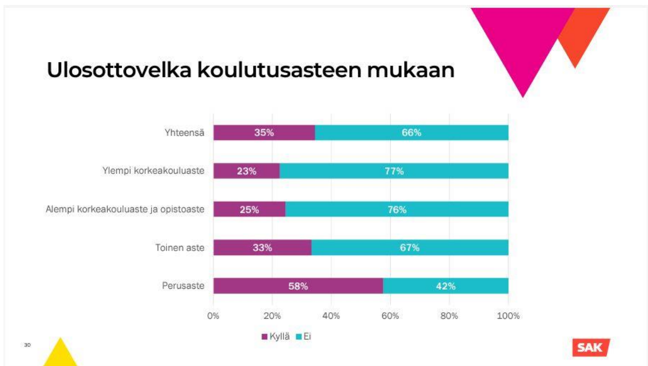
Kuva 3. Ulosottovelka koulutusasteen mukaan (SAK 2023)

SAK on julkaissut haastattelututkimuksen nimellä ”Työttömyyden syyt työttömien näkökulmasta” vuonna helmikuussa 2023. Tutkimus on tehty haastattelututkimuksena ja aineisto on kerätty 20.10.-10.11.2022. Tutkimuksen aineiston analyysissä käytettiin monimuuttuja-analyysia ja tutkimukseen vastasi 763 työtöntä vastaajaa. Tutkimuksessa on paneuduttu myös työttömien toimeentuloon ja tulosten mukaan toimeentulo vaikeutuu, kun työttömyys pitkittyy. Tutkimuksen tulosten mukaan toimeentulon haasteet korostuvat myös enemmän matalasti koulutetuilla. Tutkimuksessa on otettu huomioon myös toimeentulo ja ulosottovelka koulutusasteen mukaan, ja tämän vuoksi koen SAK:n tutkimuksen (SAK 14.2.2023) tärkeäksi opinnäytetyöhöni liittyen.