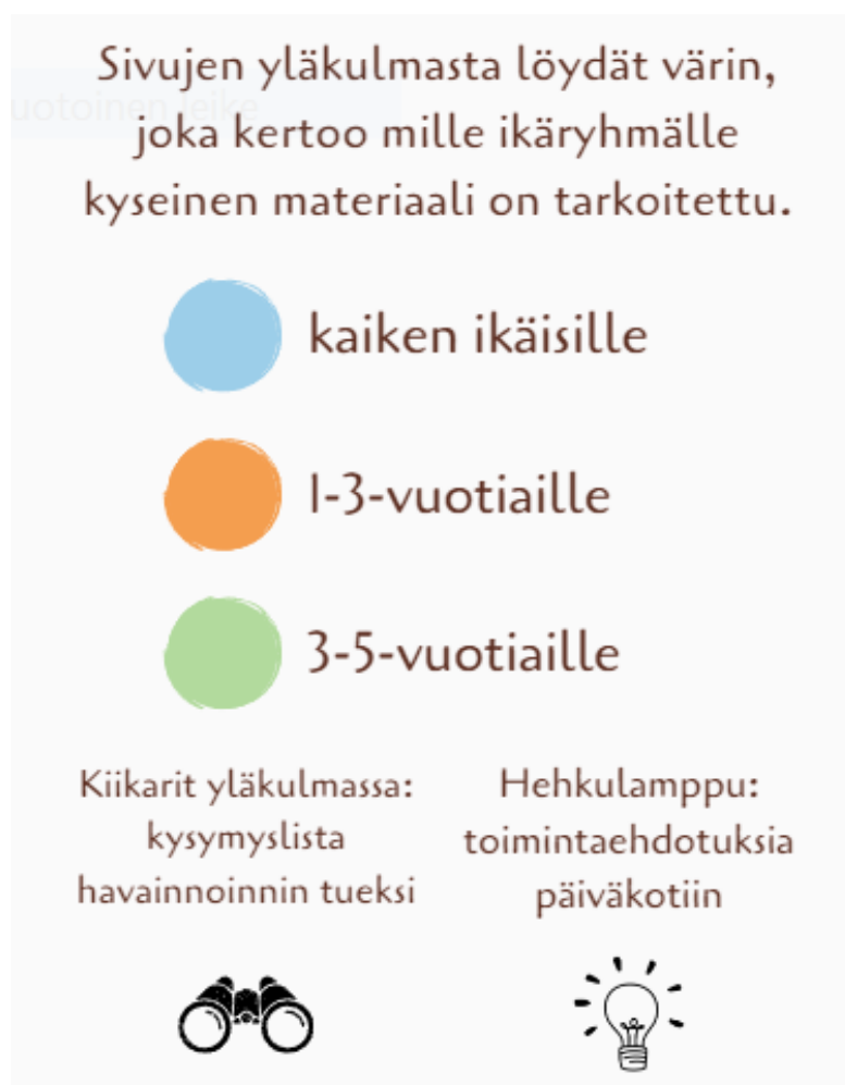
Kuva 1. Ohjeistus materiaalin käyttöön

myös esimerkiksi toimintaehdotuksia, joista varhaiskasvattajat saavat ideoita pedagogiseen dokumentointiin osaksi varhaiskasvatuksen arkea.