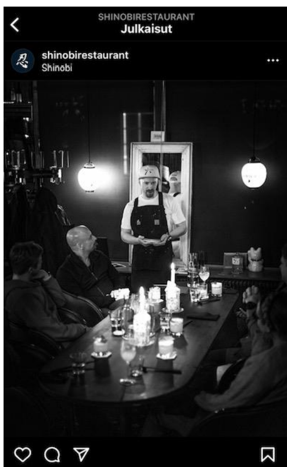
Kuva 2. Tapahtumaillan Instagram julkaisu.

Tapahtumaillat olivat suunniteltu tarkasti ruokien ja juomien osalta, joten illan vienti oli helppo toteuttaa. Kaikki illalliset olivat samanlaisia, mutta tärkein osa oli tutustuttaa asiakkaat kertomuksilla kulttuurista ja meidän konseptista ravintolan tuotteisiin.