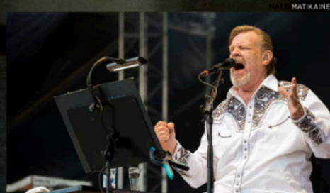
Vesa-Matti Loiri oli ilmaisuvoimainen esiintyjä.

ulos. Vesku oli, ja on edelleen, äärimmäisyksien ihminen.