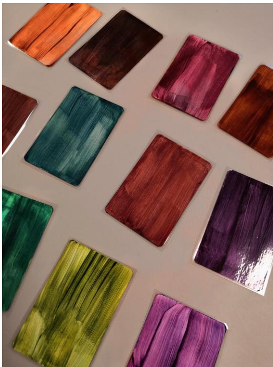
Kuva 1: Osa testikäytössä olleista käsinmaalatuista ja laminoituista värikorteista (Kosunen 2022)

Värikortit suunniteltiin aluksi Adobe Illustrator-ohjelmalla tehtäväksi, mutta lopulta ne maalattiin akryylimaalilla paperisille korteille. Käsien maalattuina sävyt ja väripinnat olivat elävämmät ja realistisemmat kuin digitaalisesti tehtyinä. Värikortteja maalattiin kaksi sarjaa ja ne laminoitiin läpinäkyvällä kalvolla (kuva 1). Kortit skannattiin digitaaliseen muotoon, jotta korttisarjoja voi myöhemmin printata lisää (kuva 2). Adobe Illustrator-ohjelmalla suunniteltiin korttien käyttöopas. Selkeyden vuoksi oppaasta tehtiin yksisivuinen, jotta tieto olisi helposti hahmotettavissa ja luettavissa. Kieli, fontti sekä tekstin ja kuvien asettelu toteutettiin selkokielen ohjeiden mukaisesti. Lisäksi tehtiin selkokiellinen yksisivuinen palautelomake, jonka avulla palaute voitiin antaa kirjallisesti sekä kuvien avustuksella.