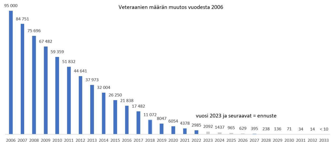
Kuva 1. Tilasto ja ennuste veteraanien määrästä (Anttila & Juote 2019)

Alla oleva vuoden 2019 kuva 1 havainnollistaa arvion veteraanien määrän muutoksesta vuodesta 2006 vuoteen 2033.