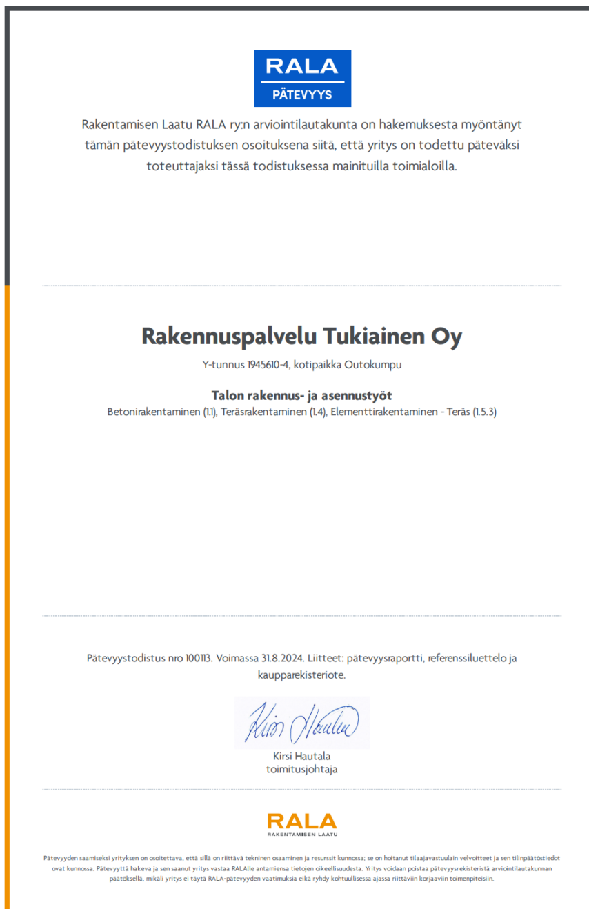
KUVA 6. Pätevyystodistus. (Tukiainen 2023)

Hakemusprosessi itsessään oli suhteellisen jouheva, kuitenkin, vaikka hakemusta täytettäessä annetaan RALAlle oikeutus yrityksen perustietojen automaattiseen täydentämiseen hakemusta varten ja oikeus velvoitteiden hoitamisen jatkuvalle valvonnalle, ei jostain syystä kaikki tarvittavat tiedot täyttyneet hakemukselle automaattisesti riittävän nopealla aikataululla. Tästä syystä joitakin tietoja täytyi hankkia itse ja lähettää ne RALAlle hakemukseen täydennettäväksi.