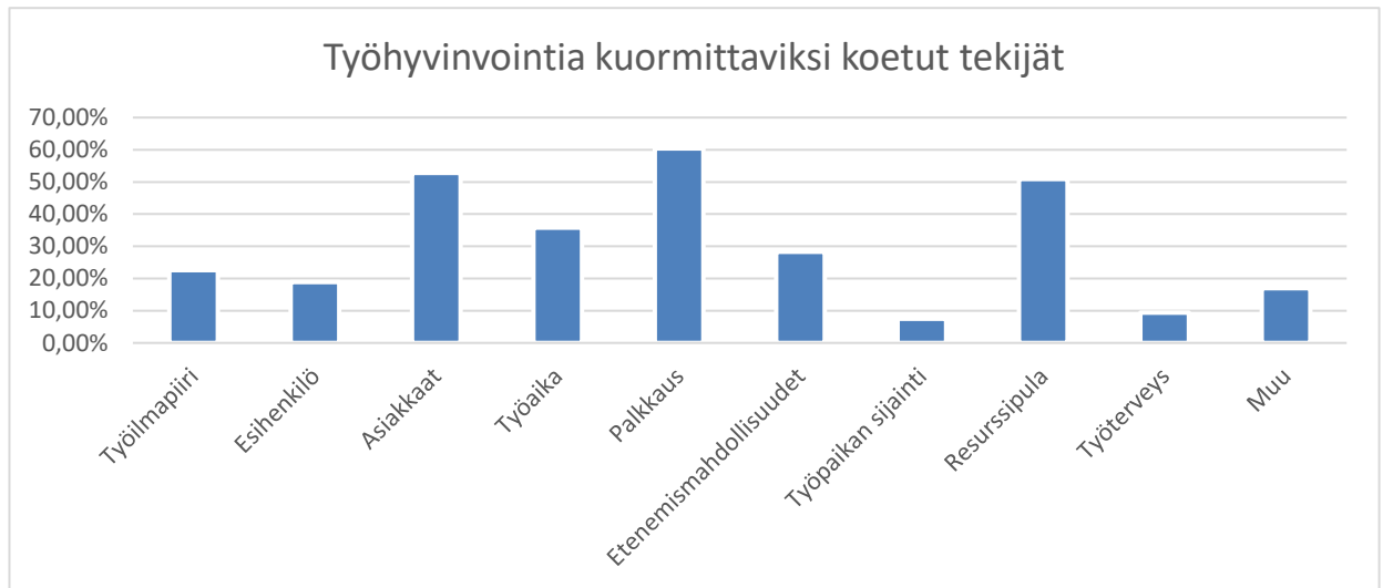
Kuvio 1. Työhyvinvointia kuormittaviksi koetut tekijät kyselylomakkeessa.6

Laitoimme seuraavaksi kyselylomakkeen kysymykseksi edellisen kysymyksen vastakohdan, eli mitkä asiat taas vaikuttavat positiivisesti työhyvinvointiin. (Kuvio 2.) Tässäkin kysymyksessä laadimme valmiita vastausvaihtoehtoja, joita sai halutessaan valita useamman sekä avoimen vastausvaihtoehdon, johon vastaaja sai vapaasti kirjoittaa. Kaikista eniten ääniä, prosentuaalinen osuus 79 %, sai työilmapiiri. Noin suuri prosentuaalinen osuus kertoo siitä, että työpaikkojen työilmapiirin tärkeyttä on ehdottomasti priorisoitava työpaikoilla. Jos parempaan tulokseen voidaan päästä työilmapiiriä parantamalla, se kannattaa ehdottomasti huomioida. Jokainen työntekijä pystyy vaikuttamaan tähän asiaan sekä esihenkilöt pystyvät viedä asiaa eteenpäin. Huonossa työilmapiirissä työskentely heijastaa työntekijän työhön negatiivisesti, joka taas vaikuttaa asiakaskohtaamisiin.