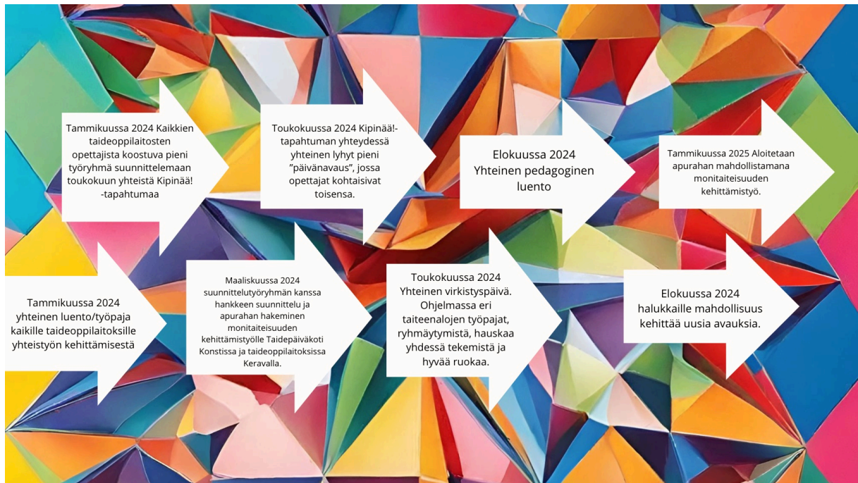
Kuva 4. Hypoteettinen suunnitelma yhteistyön kehittämisen jalkauttamiseksi taideoppilaitoksissa Keravalla vuonna 2024. Juuli Kammonen 2023

Kaikki kehittämissuunnitelmat pohjautuvat ulkopuoliselle rahoitukselle. Uskon, että tahtotilaa ja mahdollisuuksia jonkinlaiseen kehittämiseen olisi myös ilman ulkopuolista rahoitusta.