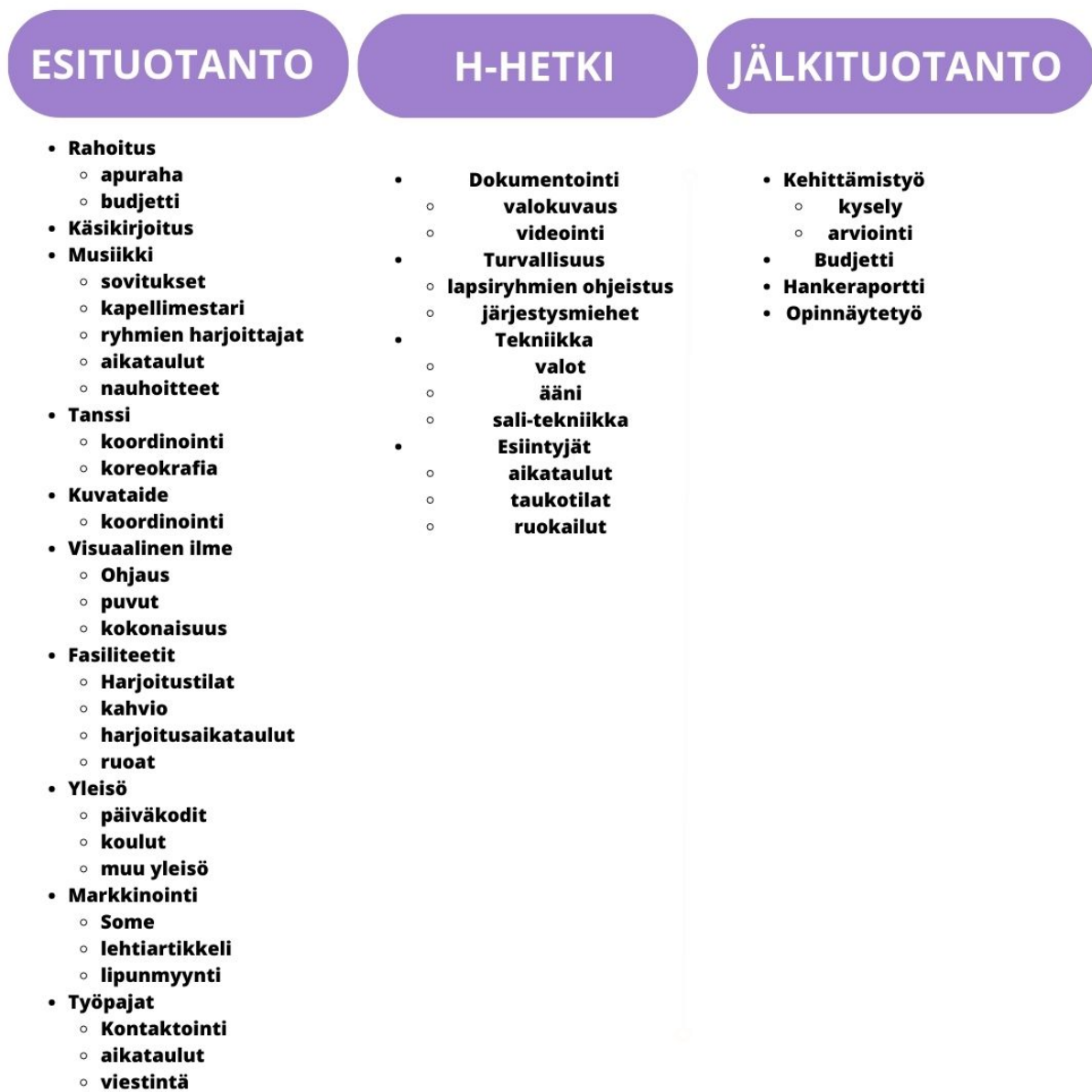
Kuva 2. Tuotantoprosessin vaiheet Pegasos hankkeessa.

esimerkiksi rahoitus ja markkinointi ovat usein ennakkopainotteisia ja saattavat ratkaista, lähdetäänkö varsinaiseen tuotantoon lainkaan (ns. go/no go –päätös). H-hetkellä kokijoiden, yleisöjen ja asiakkaiden tilanteeseen keskittyminen, ja eritoten turvallisuus, ovat keskeisiä. Jälki-tuotantovaiheessa mm. jälkimarkkinoidaan, analysoidaan tuotantoa ja mallinnetaan tulevaa (Hoffrén, 2021).