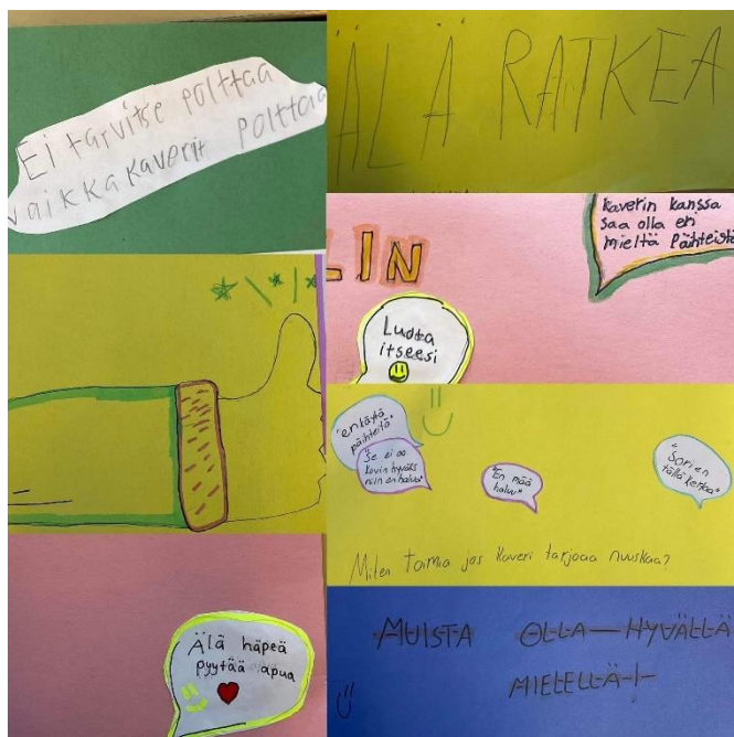
Kuva 2 Kooste oppilaiden tekemistä julisteista