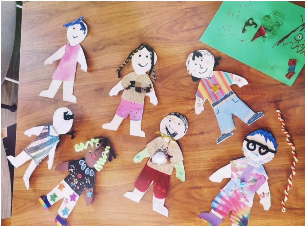
Kuva 1: Paperinukkeaskartelu

Sovimme yhdessä tehtävänjaosta eli siitä, kumpi ohjaajista ottaisi päävastuun keskustelun luotsaamisesta ja kumpi askartelun ohjeistuksesta. Sovimme myös siitä, missä järjestyksessä ryhmän eri toiminnot toteutettaisiin, ja päätimme kokeilla rakennetta, jossa yhteisen aloituksen jälkeen jatkaisimme suoraan keskustelemaan, minkä jälkeen siirtyisimme askartelun pariin. Tähän ratkaisuun päädyttiin, koska aiemmilla kerroilla suoraan aloituksen jälkeen toteutettu toiminnallinen osuus johti herkästi siihen, etteivät lasten keskittymiskyky ja jaksaminen enää meinanneet riittää ryhmän loppuvaiheilla yhteiseen keskusteluun.