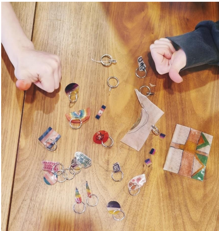
Kuva 2: Kutistemuoviaskartelu

Lapset olivat melko hiljaisia, mutta tästä huolimatta aktiivisia osanottajia keskustelutilanteessa. Heistä pystyi aistimaan, että he olivat tilanteeseen sitoutuneita ja keskittyneitä. Keskustelimme jonkin aikaa, minkä jälkeen siirryimme lattialta pöydän ääreen askartelemaan.