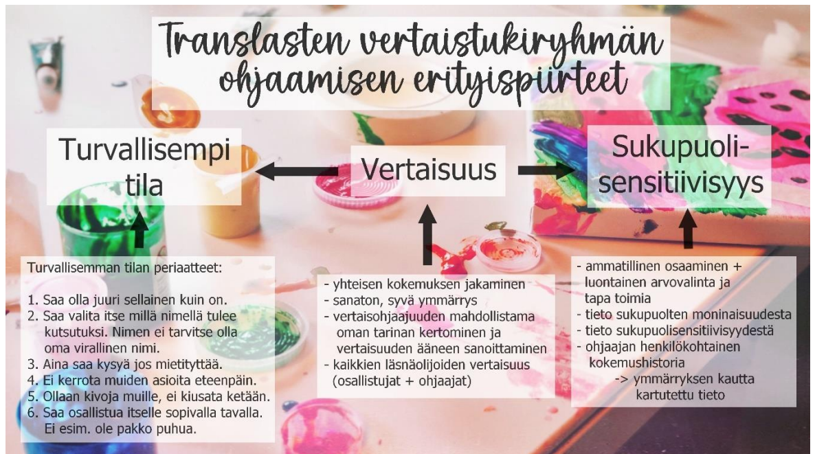
Kuva 4: Keskeisimmät nostot translasten vertaistukiryhmän ohjaamisen erityispiirteistä