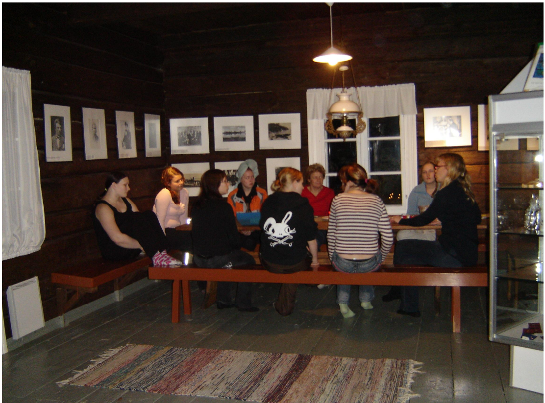
Kuva 1. Opiskelijoiden ja opettajien ja ohjaajien yhteinen iltapalaveri

Tähän edellisessä kappaleessa opetussuunnitelman kohtaan viitaten perheleirin taustateorianä käytetään sosiaalipedagogiikkaa ja sen metodologista suuntausta sosiokulttuurista innostamista. Sosiaalipedagogisen työn perusajatuksena on tarjota ihmisille mahdollisuus osallistua, kohdata toisia ihmisiä, tehdä mielekkäitä asioita ja kokea yhteisöllisyyttä toisten kanssa (Hämäläinen 1999, 72-73). Kehittämishanke on osittain toiminnallinen hanke. Toiminnallinen osuus oli 1.-5.10.2007 pidetty perheleiri, johon osallistui kahdeksan sosionomiopiskelijaa. Perheleirin esite ja ohjelma ovat liitteinä (LIITTEET 2 ja 3). Opiskelijat oli valmennettu kehittämishanketta varten siten, että heiltä pyydettiin ennen leiriä henkilökohtaiset tavoitteet kirjallisena, jotka he olivat itselleen asettaneet ja leirin jälkeen projektiarvioinnit (LIITE 4) kehittämishankkeen hankkeen analysoitaviksi.