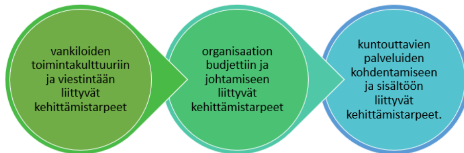
Kuva 4: Vankeusaikaisiin kuntouttaviin palveluihin liittyvät kehittämistarpeet (Nieminen & Poutiainen 2023)

palveluihin kehittämistarpeisiin liittyen. Pääluokiksi erottuivat vankiloiden toimintakulttuuriin ja viestintään liittyvät kehittämistarpeet, organisaation budjettiin ja johtamiseen liittyvät kehittämistarpeet sekä kuntouttavien palveluiden kohdentamiseen ja sisältöön liittyvät kehittämistarpeet.