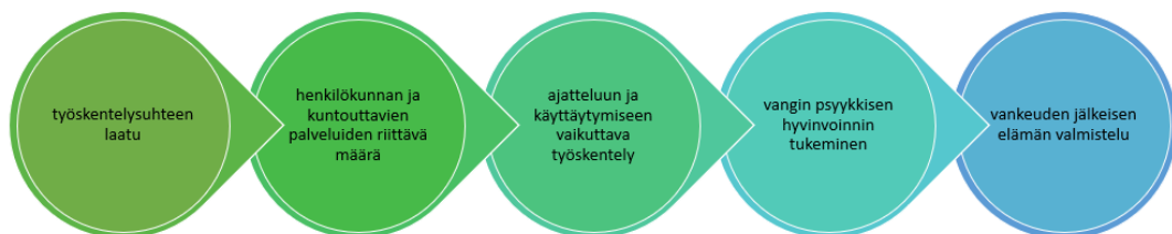
Kuva 3: Kuntouttaviin toimintoihin liittyvät merkitykselliset tekijät (Nieminen & Poutiainen 2023)

Tutkimuksemme toisena kehittämiskysymyksenä oli, millaiset tekijät kuntouttaviin toimintoihin liittyen ovat haastateltavien kokemusten mukaan olleet merkityksellisiä kuntoutuksen tai rikoksista irtautumisen näkökulmasta. Haastateltavien nimeämät keskeiset kuntouttaviin toimintoihin liittyvät merkitykselliset tekijät jakaantuivat aineiston analyysissa viiteen pääluokkaan. Pääluokiksi muodostuivat työskentelysuhteen laatu, henkilökunnan ja kuntouttavien palveluiden riittävä määrä, ajatteluun ja käyttäytymiseen vaikuttava työskentely, vangin psyykkisen hyvinvoinnin tukeminen ja vankeuden jälkeisen elämän valmistelu.