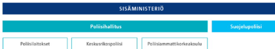
Kuvio 1: Poliisin organisaatiokaavio (Poliisiammattikorkeakoulu 2023)

Poliisiammattikorkeakoulu (Polamk) on Suomen ainoa poliisioppilaitos. Se kouluttaa Suomessa kaikki uudet poliisit. Lisäksi Polamk tarjoaa jatko- ja täydennyskoulutusta sekä suorittaa tutkimus- ja kehittämistyötä. Kuvio 1 kuvaa Polamkin sijoittumista poliisin organisaatiokaaviossa. Polamk on ammattikorkeakoulu, mutta samalla myös yksi poliisin yksikkö. Poiketen muista ammattikorkeakouluista Polamk toimii sisäministeriön alaisuudessa. Polamk ja sen kampusalue sijaitsevat Tampereen Hervannassa. (Poliisiammattikorkeakoulu 2023.)