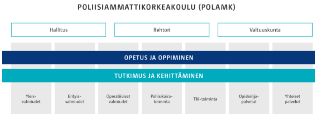
Kuvio 2: Poliisiammattikorkeakoulun organisaatiokaavio (Poliisiammattikorkeakoulu 2023)

Kuviossa 2 on esitetty Polamkin organisaatiokaavio. Polamkia johtaa rehtori yhdessä Polamkin hallituksen kanssa. Heitä avustaa työssään valtuuskunta. Polamkin ydintoimintoina ovat opetus ja oppiminen sekä tutkimus ja kehittäminen. Henkilöstö on jaettu seitsemälle osaamisalueelle, joista neljä, yleisvalmiudet, erityisvalmiudet, operatiiviset valmiudet ja poliisikoira-toiminta vastaavat opetuksesta. Voimankäytön opetus sijoittuu erityisvalmiuksien osaamisalueella. (Poliisiammattikorkeakoulu 2023.)