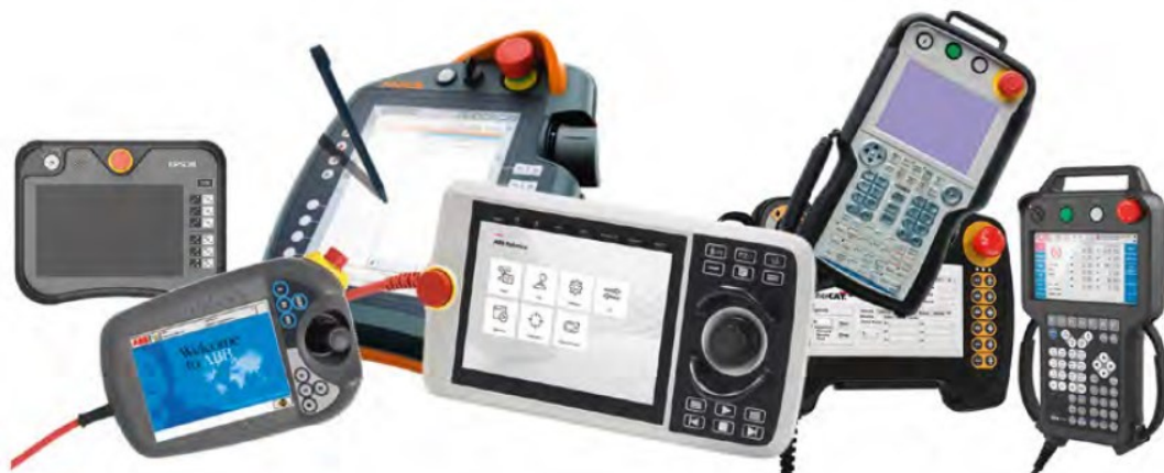
Kuva 1. Erilaisia käsiohjaimia (Kuva: Välimäki & Niemelä 2023.)

Robotteja ohjelmoidaan tyypillisesti käyttäen käsiohjaimia (kuva 1), joiden muotoilu ja toimintatavat vaihtelevat eri robottivalmistajien kesken. Erot ilmenevät esimerkiksi robotin liikuttelutavassa, jossa jotkut käyttävät sauvaohjainta ja toiset painonappeja. Nykyään suurimmalla osalla käsiohjaimista on myös kosketusnäyttö. Käsiohjaimen päätehtävät ovat muun muassa robotin ohjelmointi haluttuihin paikkoihin ja sen siirtäminen turvalliseen asentoon virhetilanteissa. Vaikka käsiohjaimet ja ohjausjärjestelmät eroavat toisistaan, robotin ohjelmointiprosessi on pääpiirteittäin samanlainen kaikilla merkeillä: robotin liikuttaminen haluttuun paikkaan ja asentoon, paikoituspisteen tallennus ja liikekäsken valinta. Tämän jälkeen toteutetaan siirtyminen seuraavaan paikoituspisteeseen. Lisäksi yhteistyörobotteja voidaan liikuttaa myös manuaalisesti käsin robotin työkalusta siirtämällä. (Välimäki & Niemelä 2023, 121.)