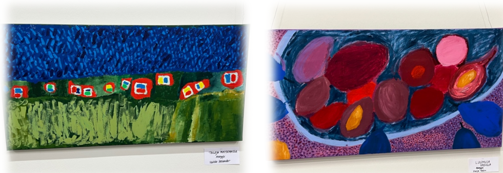
Kuva 1. Esimerkkejä ryhmän tuottamista akryylivärimaalauksista

Kaikki ryhmässä olevat tekivät erikokoisia akryyliväritöitä (kuva 1.) sekä kankaalle että pohjustetulle paperille. Maalaus pohjina käytettiin osittain uusia itse tehtyjä pohjia sekä kierrätyspohjia. Kierrätyspohjina olivat vanhat maalaukset, jotka pohjustettiin uudelleen. Pohjustettuja paperipohjia tehtiin käyttämällä ta-pettikirjoista irrotettuja isohkoja paperitapetteja. Näihin tehtiin myös isompien akryylitöiden luonnoksia.