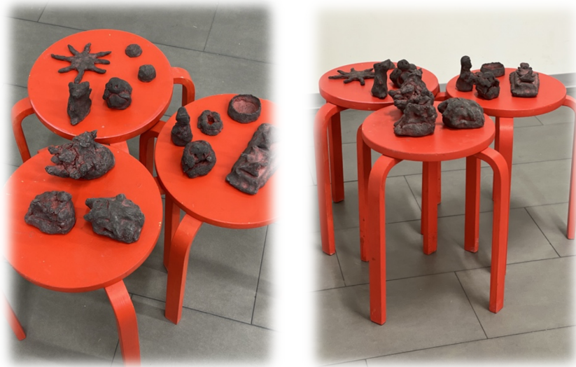
Kuva 4. Pienet punasavesta tehdyt savieläimet.