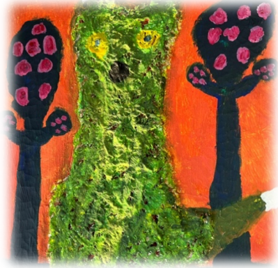
Kuva 3. Vihreä kettu, sekatekniikkatyö.

Tässä vihreä kettu teoksessa (kuva 3.) väreinä on käytetty akryylejä. Ketun profiilikuvan taiteilija muotoili pohjalle ensi akryylimaalilla kankaalle ja sen jälkeen hän asetteli pieniä villalangan pätkiä liimaa apuna käyttäen. Lankakeroksia tuli teokseen useita. Sen jälkeen kettu maalattiin akryylivärillä. Tavoitteena oli kolmiulotteinen ja struktuurinen työ. Tämän teoksen tekijän vahvuudet liittyvät tuntoaistiin ja tässäkin pyrittiin ketulle tyypilliseen pehmeään turkin kuvaamiseen. Myös taustalla olevien puiden värejä mietittiin taiteilijan ja ohjaajan kanssa yhdessä. Tässä ohjaajan rooli oli kannustaa valitsemaan joku luonnosta poikkeava väri. Apuna värien valintaan käytettiin värikarttaa.