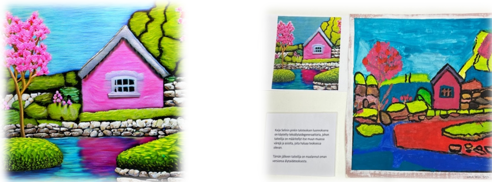
Kuva 2. Älygeneraattorin tuottama luonnos ja taiteilijan oma näkemys teoksesta.

Ohjauksessa oli huomioitava, että henkilö ei tiennyt taidesuuntauksien nimiä. Tätä valintaa helpottamaan käytettiin taidekirjoja, joista hän sai valita mieleisensä. Ohjattavalle oli helpointa kertoa mitä hän halusi kuvassa olevan ja mitä värejä kuvassa pitäisi olla. Tämän jälkeen ohjaaja kirjoitti älytaidegeneraattoriin vaadittavat sanat englanniksi ja ohjelma tuotti neljä erilaista kuvaa. Näistä kuvista henkilö valitsi yhden, josta halusi maalata oman versionsa. Mielenkiintoista oli huomata, että taiteilija oli pyrkimys tehdä lähes identtinen kuva (kuva 2.). Lopputuloksesta huomaa, että tiettyjen kuvan osien hahmottaminen, kuten perspektiivin, on ollut vaikeaa ja värien toistaminen autenttisesti ei ole onnistunut.