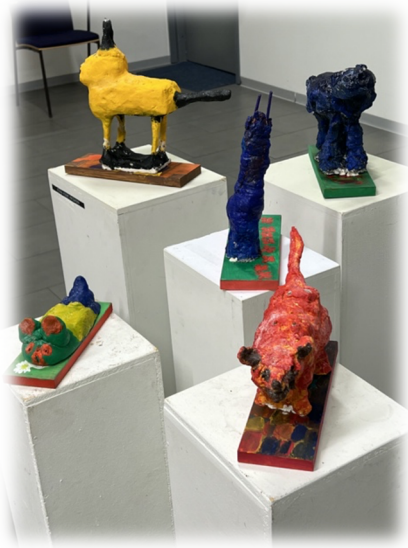
Kuva 5. Värikkäät betonista tehdyt eläinpatsaat.

Näyttelyssä betoniset eläinpatsaat (kuva 5.) asetettiin veistosjalustoille ja sommiteltiin ryhmäksi keskelle näyttelytilaa.