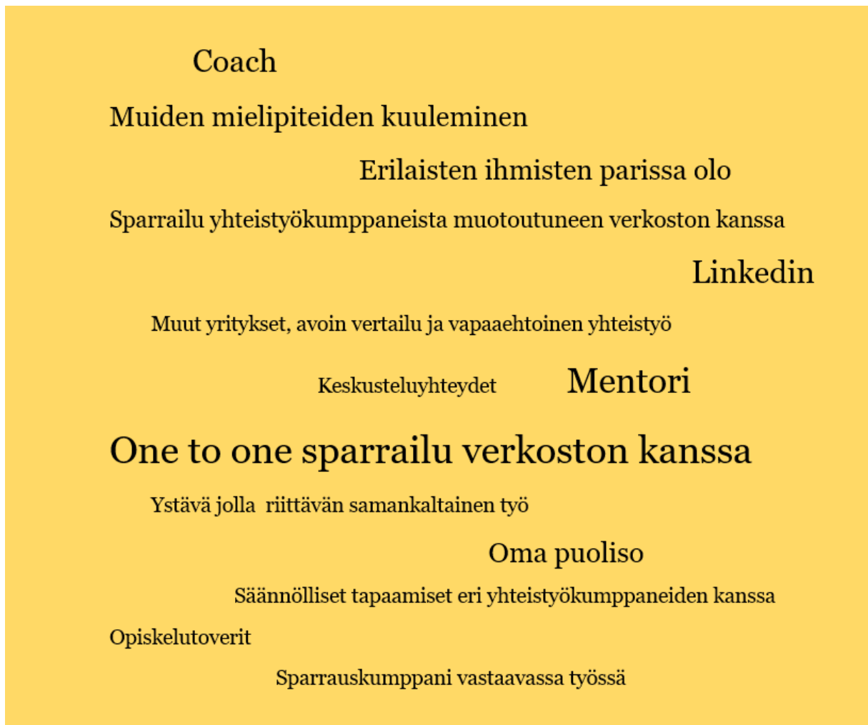
Kuva 3: Tutkimukseen osallistuneiden haastateltavien käyttämät yhdessä oppimisen keinot