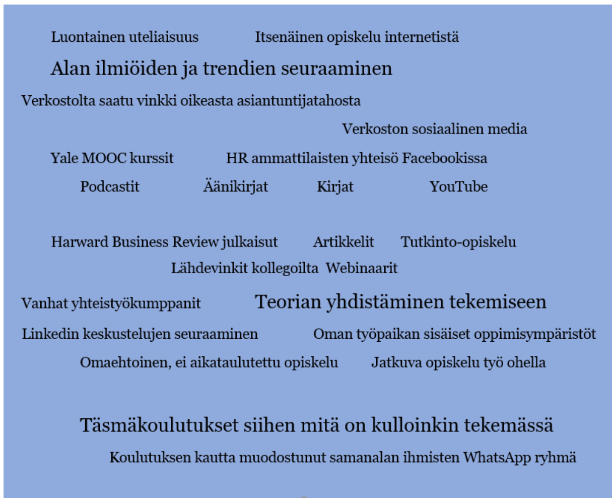
Kuva 2: Tutkimukseen osallistuneiden haastateltavien käyttämät tiedonhaun monipuoliset menetelmät