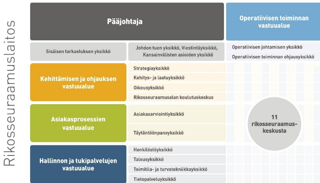
Kuvio 1: Rikosseuraamuslaitoksen rakenne (Rikosseuraamuslaitos 2023c)

Alalla työskentelee paljon ihmisiä valvontatehtävissä mutta myös kuntoutus- ja sosiaalityön tehtävissä. Rikosseuraamuslaitoksen virkamiesten lisäksi vankiloissa toimii muun muassa psykologeja ja pappeja. (Rikosseuraamuslaitos 2023b.) Näiden lisäksi Rikosseuraamuslaitos toimii jatkuvassa yhteistyössä muiden viranomaisten kanssa, joista esimerkkeinä poliisi, sosiaalialan viranomaiset ja Kansaneläkelaitos. Viranomaisten ohella Rikosseuraamuslaitos tekee vahvaa yhteistyötä kolmannen sektorin, hyvinvointialueiden sekä muiden toimijoiden kanssa (kuviot 2).