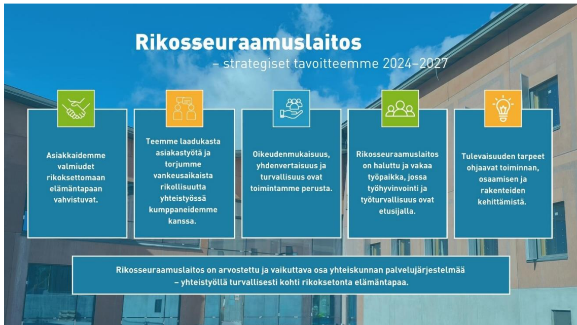
Kuvio 3: Rikosseuraamuslaitoksen strategiset tavoitteet 2024-2027 (Rikosseuraamuslaitos 2023d)