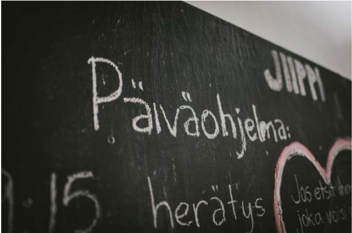
Kuva 2. Sijaishuoltoapaikan päiväohjelmataulu