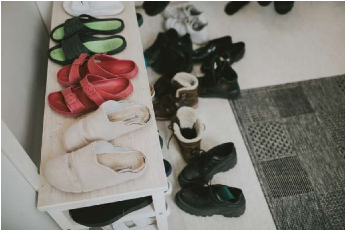
Kuva 1. Sijaishuoltopaikan eteinen (Tavaton media)

Reilu 11 000 lasta ja nuorta asuu Suomessa tällä hetkellä kodin ulkopuolella – julkisen vallan huostaanottamana. Heistä puolet (55 %) asuu perheissä ja 34 % laitoksissa. Lapin hyvinvointialueella oli huostassa vuoden 2022 viimeisenä päivänä kaikkiaan 325 lasta. (Lastensuojelu 2022.) Huostaanottoon johtaneet syyt ovat meillä moninaisia ja sitä kautta myös lasten ja nuorten tilanteet ja tarpeet sijaishuollossa ovat hyvin erilaisia. Työtä tehdään muun muassa hoidotta jäänyttä vauvaa kuntouttaen ja hoivaten, nuoruusiän myllerryksessä kamppailevaa nuorta auttaen yhtä lailla kuin päihteitä käyttävän, rikoksia tekevän ja karkailevan nuoren tilannetta tukien (kts. esim. Pösö 2016).