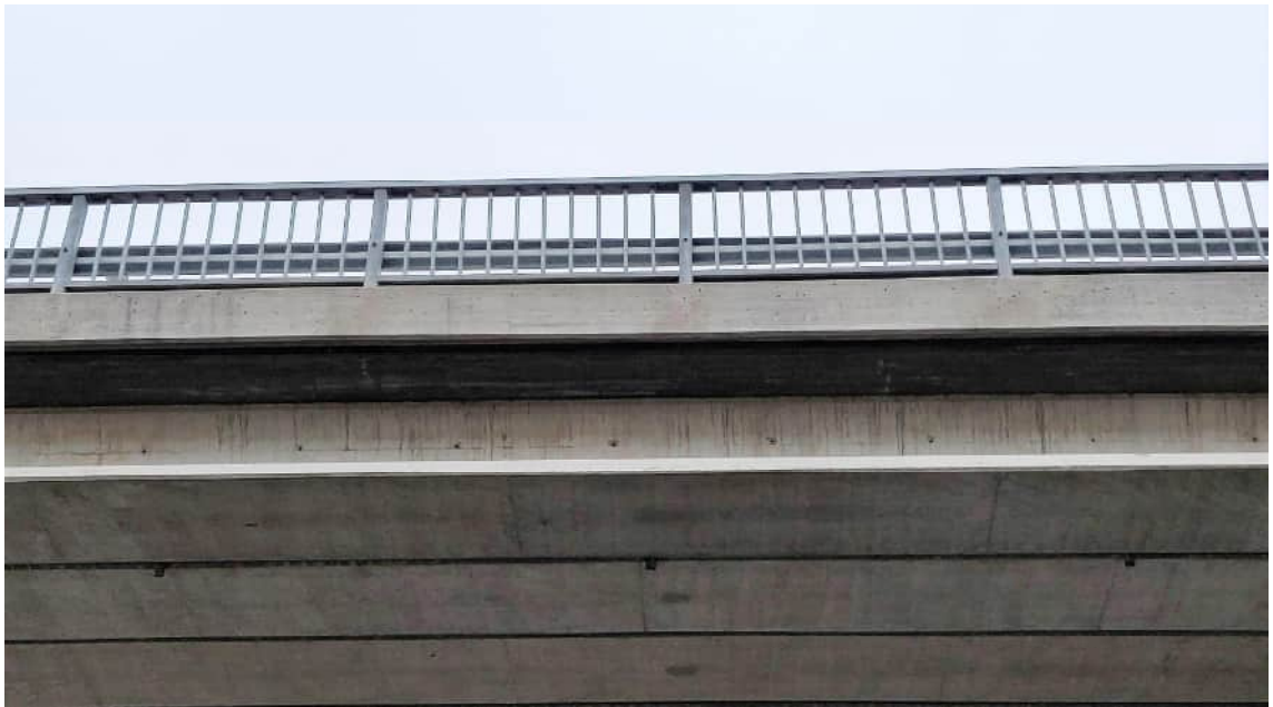
KUVA 3 Elementtirakenteisissa silloissa on haasteena saumakohtien vuotoherkkyys