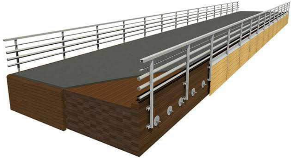
KUVA 4 Versowoodin tyyppihyväksytty ajoneuvoliikenteen poikittaiskiristetty laattasilta (Versowood Oy n.d.)