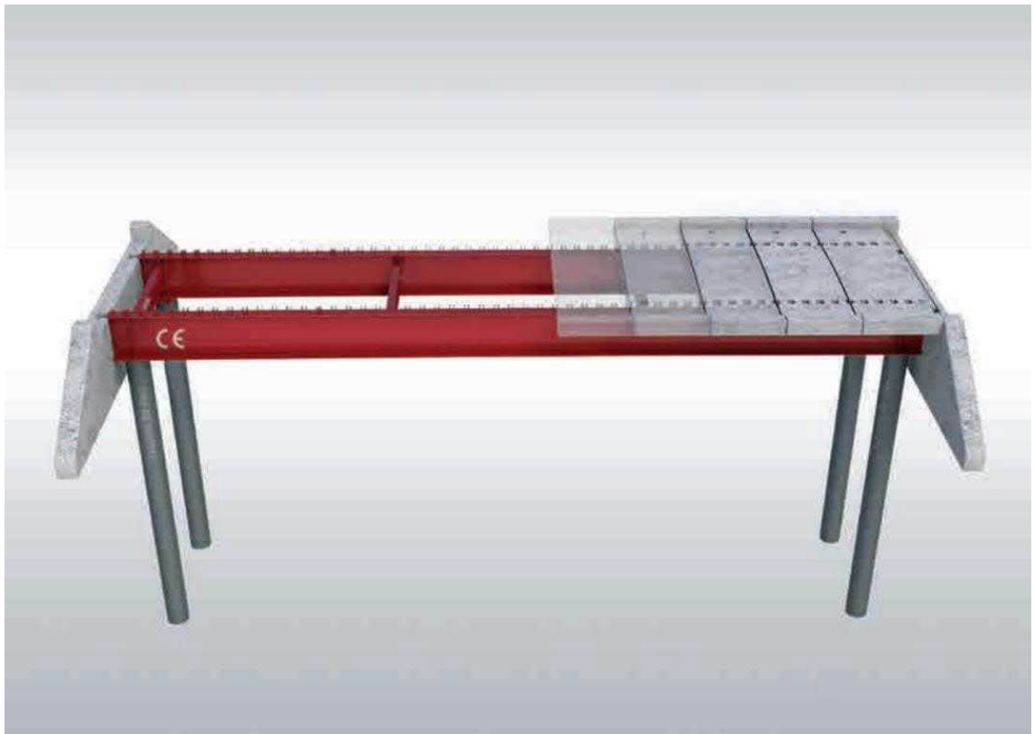
KUVA 14 Ruukki Easy Bridge® runkorakenne elementtirakenteisella kannella. (Rautaruukki Oyj n.d.)

Ennen Ruukin toimitusta työmaalla tulee olla tukirakenteet, kuten paalut, joille teräspalkit asennetaan, valmiina paikallaan, ja nostopeti rakennettuna osien asennusta varten. Rakentelementit toimitetaan työmaalle 3–4 kuljetuksella riippuen sillan koosta. Rakenteet asennetaan paikalleen yhdessä päivässä, kun resursseina on yksi nosturi ja kaksi asentajaa. Tämän jälkeen tehdään kansielementtien saumojen tiivistys ja kannen jälkivalut. (Rautakoski 2018)