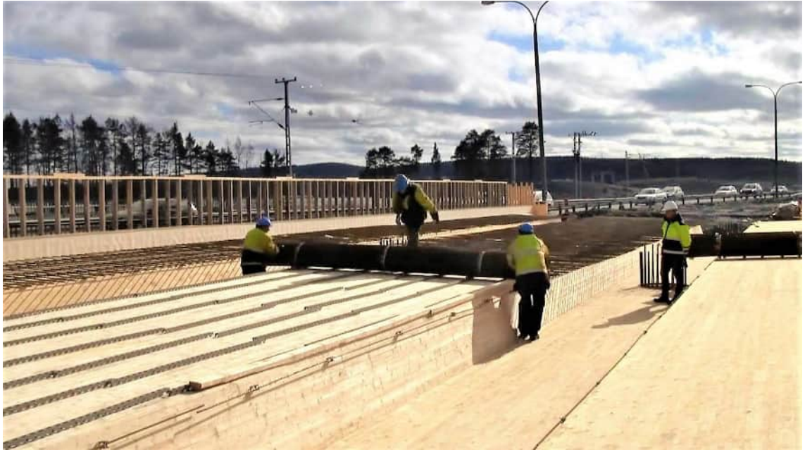
KUVA 13 BAMTEC®-mattoraidoitetta levitetään sillan poikittaissuuntaisiksi raidoitusiksi. (Celsa Steel Service 2012)

Mattoraidoitteen käytössä Suomessa on ollut haasteita liikenneviraston kanssa. Betoninormien (B4) mukaan hitsaaminen vähentää terästen väsymislujuutta 60 %. Tästä syystä hitsaamista ei olla käytetty sillanrakentamisessa. Celsa Steel Service Oy:n käyttämä pistehitsausmenetelmä kuitenkin vähentää teräksen väsymislujuutta enintään 20 %. (Mattoraidoitteella aikataulut ja... 2009) Liikenneviraston mukaan sillan pääteräksissä ei kuitenkaan tule käyttää hitsattua terästä. (Lehtonen 2018)