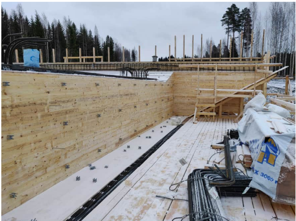
KUVA 9 Siltojen valumuotit rakennetaan miltei poikkeuksetta lautatavarasta.

Siltojen valupinnat luokitellaan Betoninormien By 40 mukaan luokkaan AA. By 40 luokkaa AA voidaan nimittää arkkitehtoniseksi luokaksi ja sillä on korkeimmat esteettiset laatuvaatimukset kaikista luokista. (Korpela & Palolahti 2014, 2). Tämä luokitus ohjaa suuresti muotin materiaalin valintaa. Suurmuotteja, jotka ovat yleistyneet talonrakentamisessa, käytetään sillanrakentamisessa hyvin harvoin.