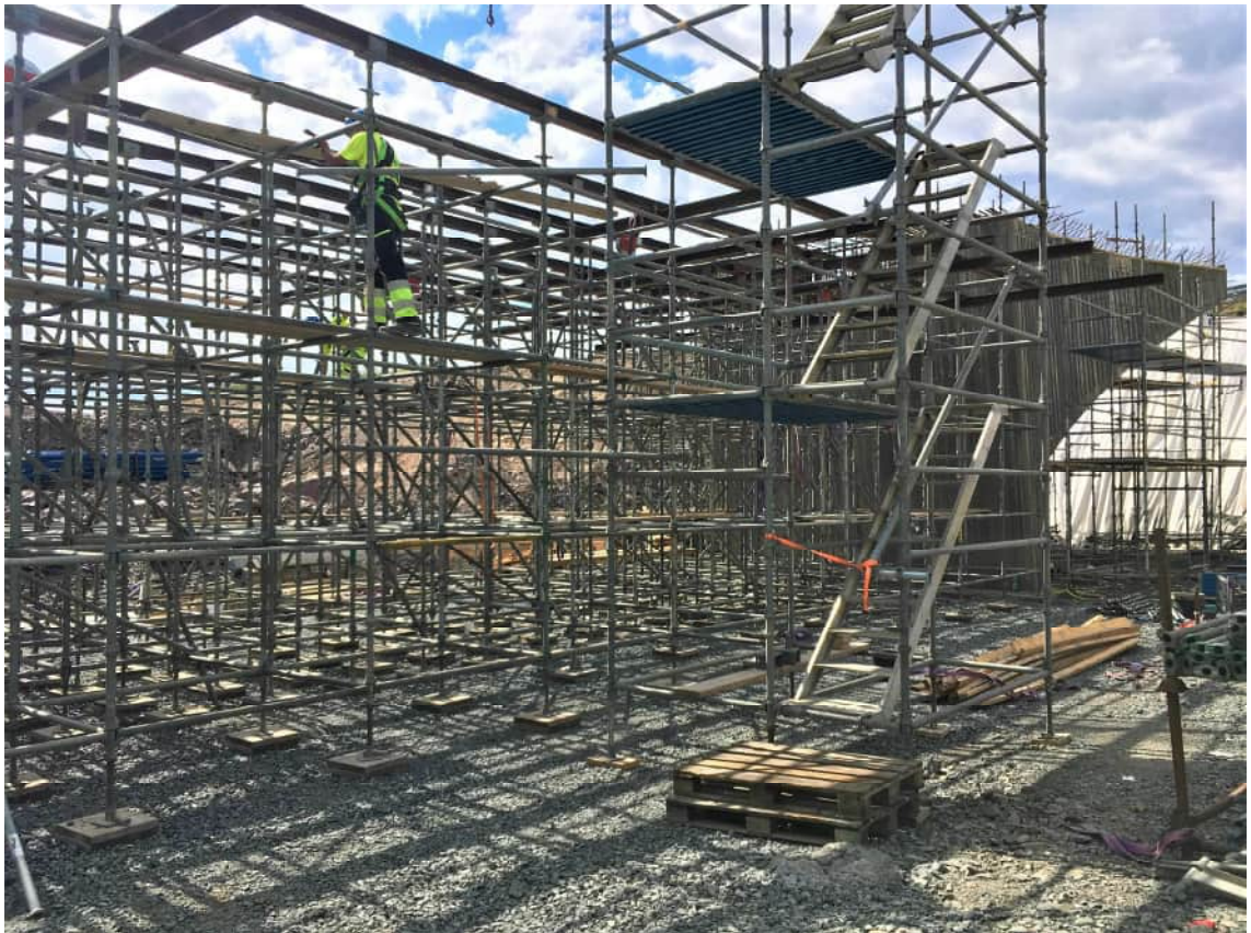
KUVA 16 sillan valumuottiteline teräskalustosta rakennettuna Ruotsissa