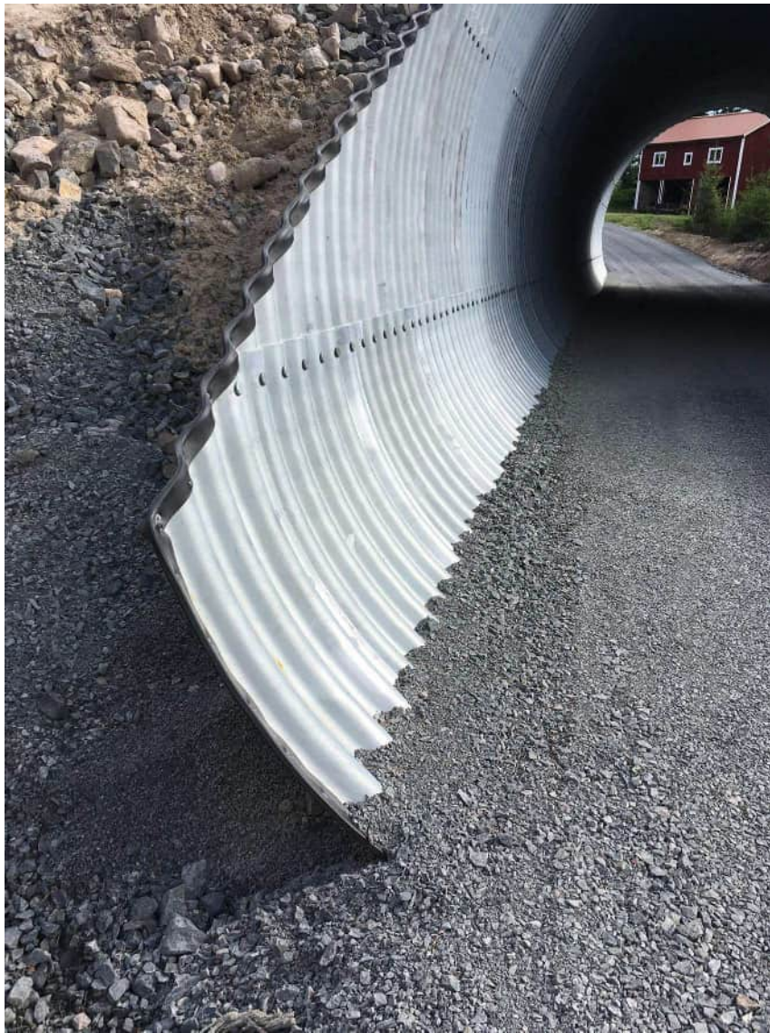
KUVA 15 Murskepohjalle elementtisista rakennettu teräspalkisilta

Liittopalkkisillat yhdistävät paikallavalu- ja elementtirakentamista, ja ovat yleisiä suurilla silloilla esimerkiksi vesistöjen ylityksissä. Siltojen kantavat teräspalkit valmistetaan tehtaalla valmiiksi osiksi, jotka liitetään toisiinsa työmaalla. Työmaan luonteesta riippuen sillan kansi joko valetaan paikalleen muottiin teräspalkkien päälle tai valmistetaan työmaalla etukäteen paikalleen asennettaviksi elementeiksi. Työmaalla elementtien valmistaminen on kuitenkin harvinaisempaa. Elementtien paikalleen asentaminen tuottaa lisää kustannuksia. (Axen 2018)