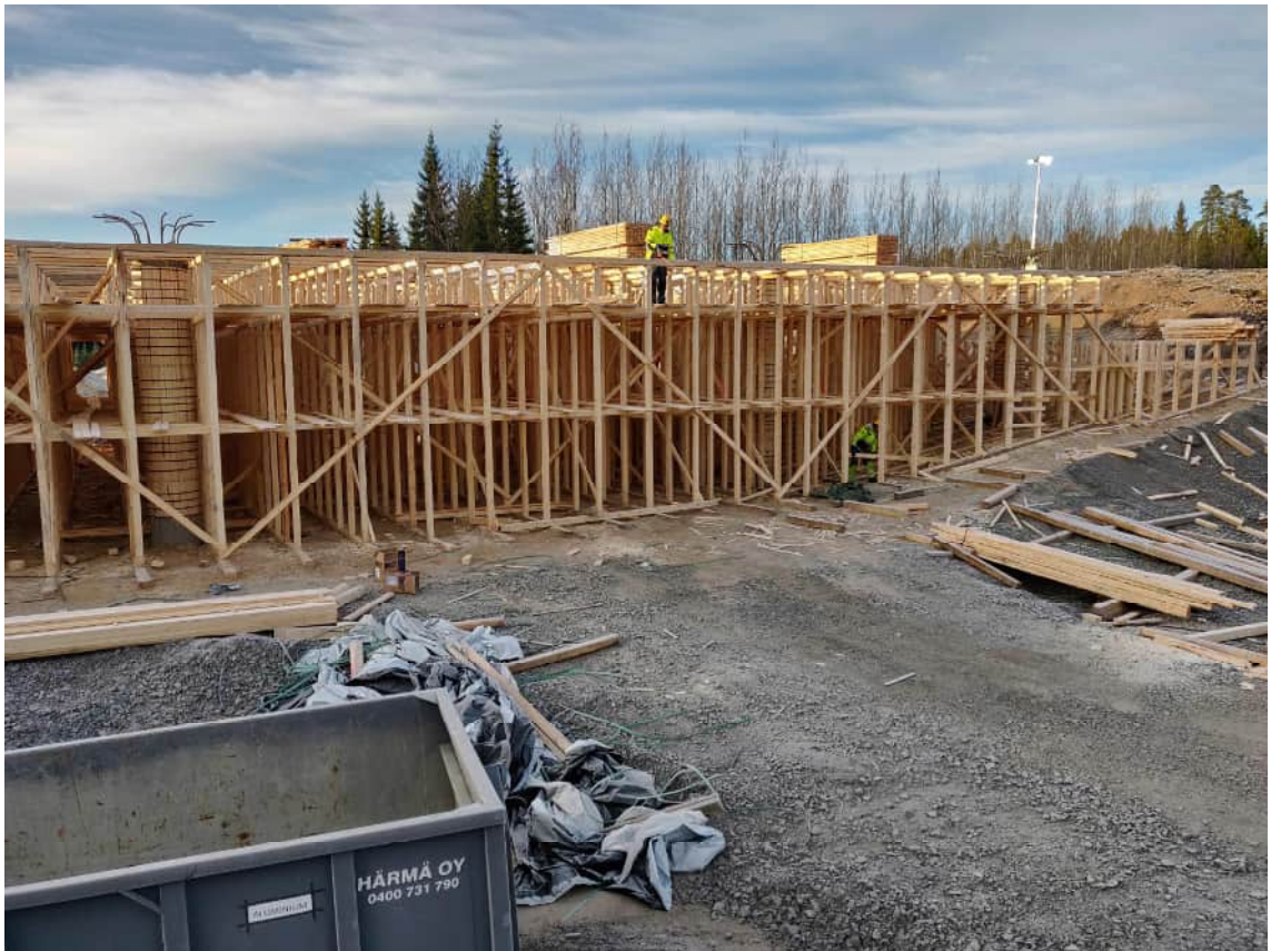
KUVA 8 Kyröskosken risteys sillan valumuottiteline rakennusvaiheessa.

Puutelineitä harvinaisempi ratkaisu on teräksinen kalustotavarasta rakennettu teline. Terästeline saattaa osoittautua hyväksi ratkaisuksi, jos rakennettavassa kohteessa on paljon samoja tai toistettavia muotoja. Esimerkiksi Hämeenlinnan alikulkutunnelin rakentamisessa käytettiin siirrettävää terästelinettä (Vellamo 2018.)