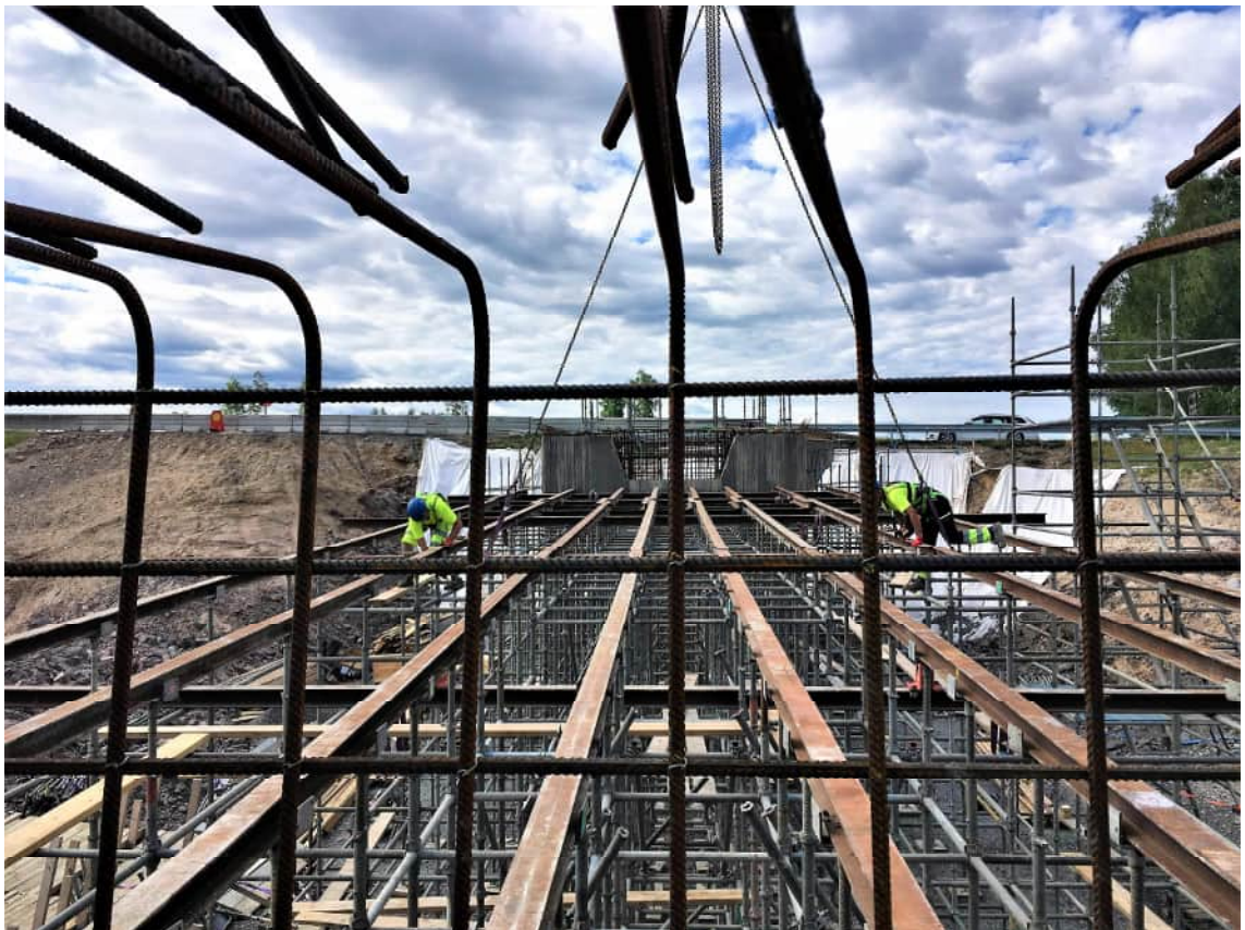
KUVA 17 Teräksiset niskat asennetaan telineille nosturin avulla.