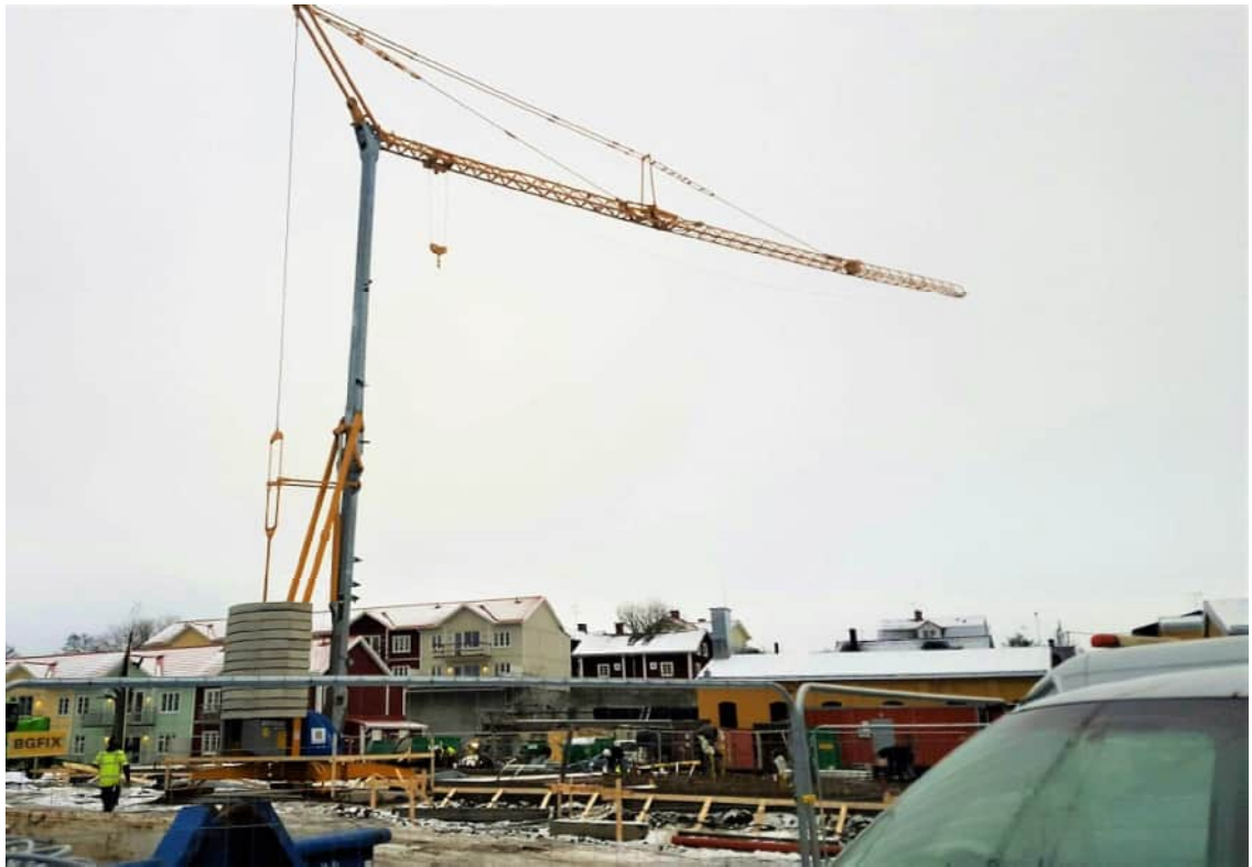
KUVA 19 Kauko-ohjattava tavaranoستuri Potain IGO 50 (ETS TTC Ltd., 2017)