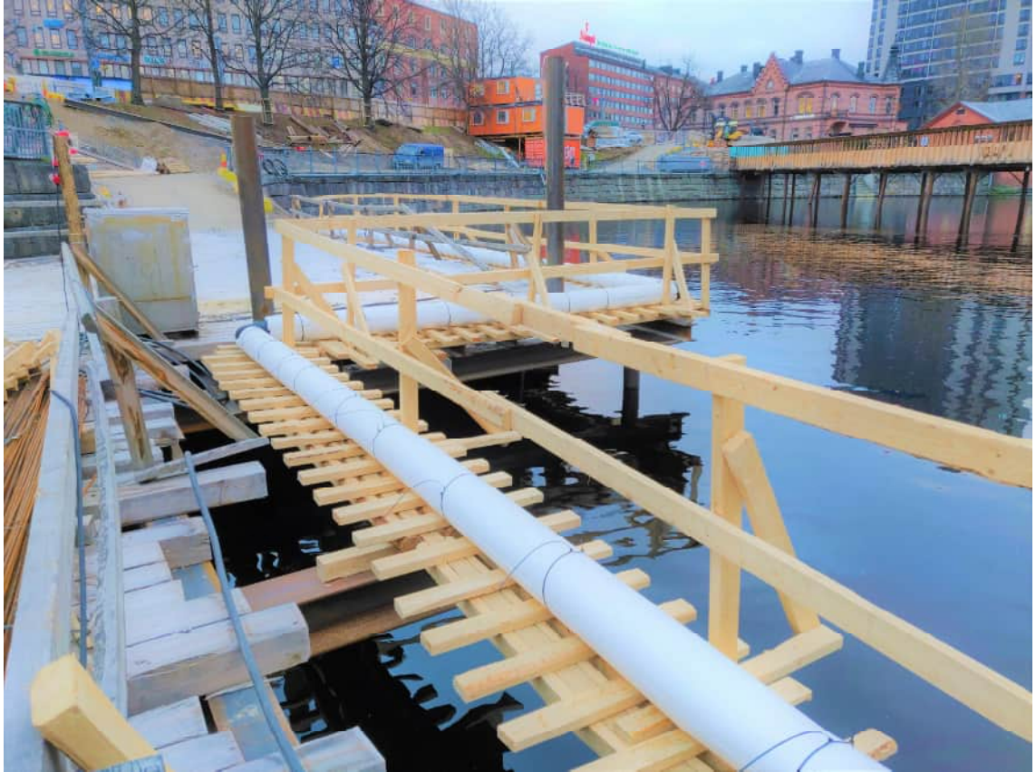
KUVA 7 Työtaso on perustettu kosken pohjaan lyödyille paaluille.