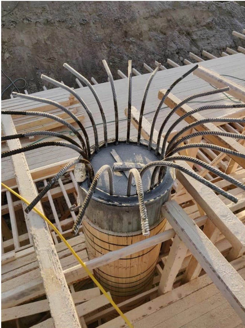
KUVA 12 Sillan välitukipilarin raudoitukset.

pilareissa ja teräsputkipaaluissa. Teräkset sidotaan tehdasolosuhteissa suunnitelmien mukaisiksi kokonaisuuksiksi, ja toimitetaan työmaalle. Reunapalkkien ja laattapalkkisiltojen palkkien haoituksessa voidaan käyttää valmiiksi hitsattuja hakakoreja. (Lehtonen 2018)