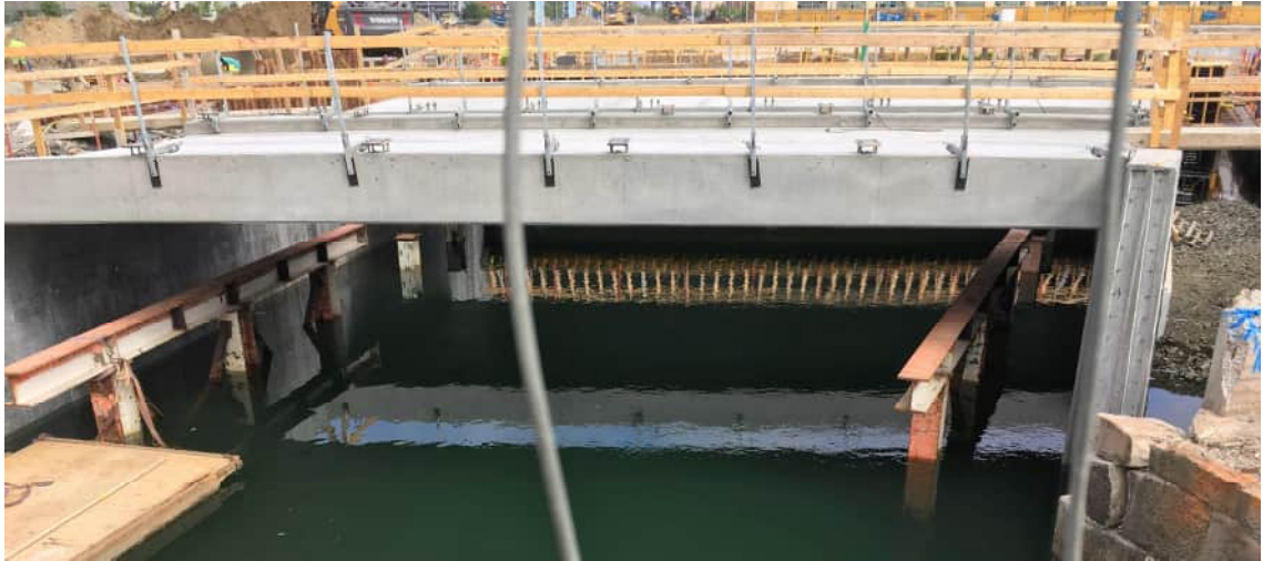
KUVA 18 Huolellisesti tehtyä betonipintaa vanerimuoteista. Kuva on Malmön Neptuni-gatan kadunrakennustyömaalta kesällä 2018.

Uusin innovaatio muottitekniikassa on vanerin pintaan asennettavat muoviset grafiikkamuotit (Axen 2018.) Grafiikkamuottien avulla voidaan saada esimerkiksi lautamuottia muistuttava pinta käyttäen vanerimuottia. Tästä tekniikasta ei vielä ole ollut suuresti kokemusta, mutta haastateltujen asiantuntijoiden mielipide on, että idea vaikuttaa pääpiirteittäin lupaavalta ja kehityskelpoiselta.