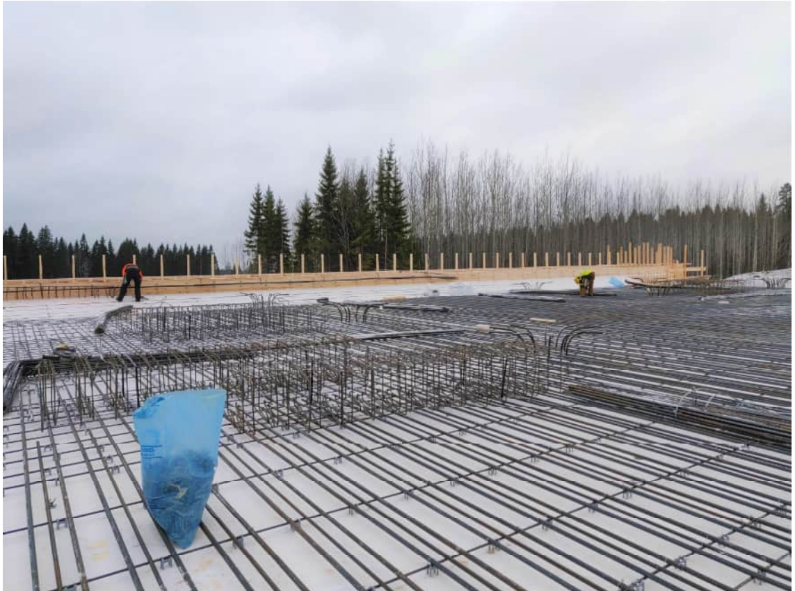
KUVA 11 Sillan poikittaisten pääterästen ja reunapalkkien raudoitteiden asennus

Betonisilloissa esiintyy teräsrakenteita pääasiassa teräsbetonin raudoituksina ja liittorakenteisien siltojen teräsosina. Teräsbetonin raudoituksen osalta selkeästi yleisin tuotantomenetelmä on leikata ja taivuttaa harjateräkset suunnitelmien mukaiseen mittaan ja muotoon tehdasolosuhteissa. Työmaalla teräkset sidotaan yhtenäiseksi raudoitteeksi suoraan valumuottiin.