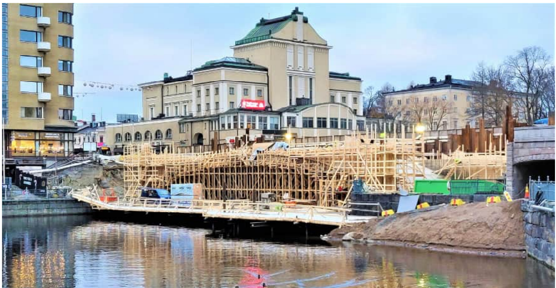
KUVA 6 Hämeensillan korjaus marraskuussa 2018.

Vesistösiltoja rakentaessa työnaikaisten rakenteiden perustaminen on erityisen tärkeää. Perustamistapoja on useita. Kohteen luonteesta riippuen valitaan sopivin vaihtoehto. Usein paras ratkaisu on puu- tai teräspaalujen lyöminen vesistön pohjaan. Paalujen päälle rakennetaan työtaso Teräspalkeista ja puusta.