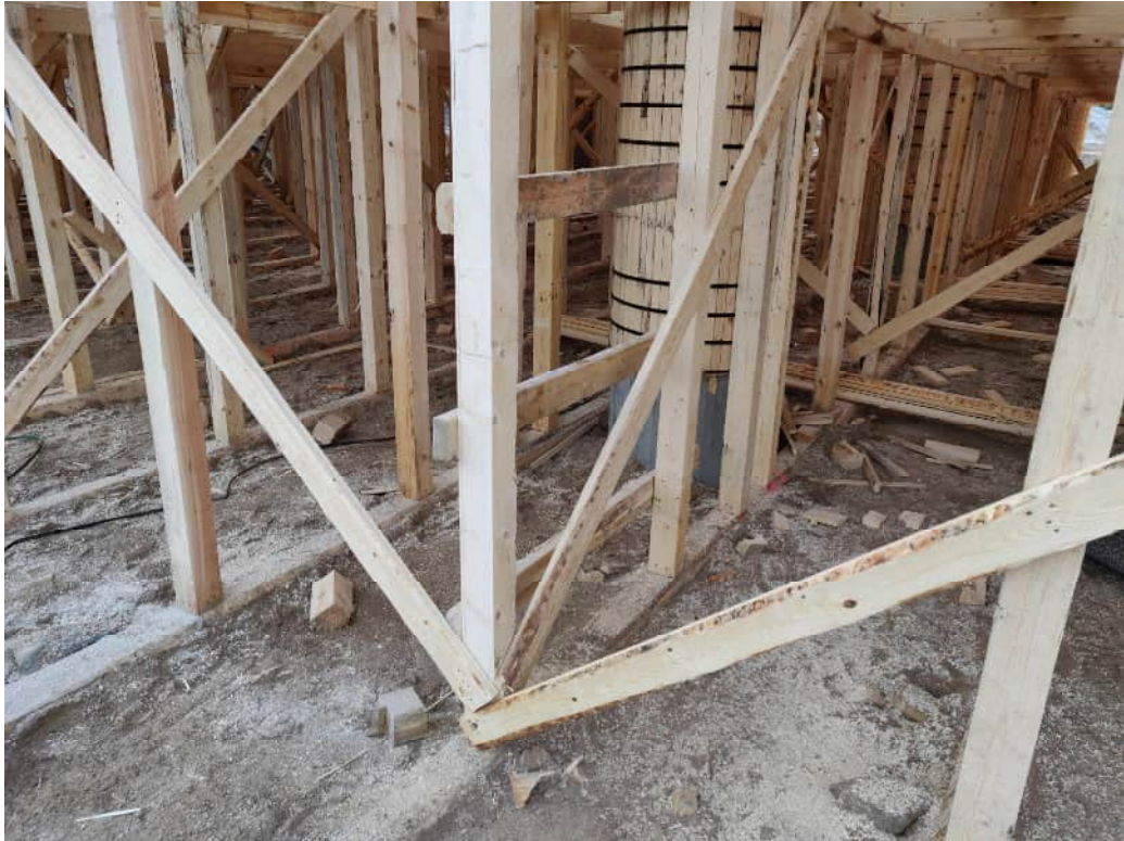
KUVA 5 Paikalla valettavan sillan valumuottitelineen perustukset. Murskepatjan päälle asennetut pelkat joiden päälle rakennettu teline.

Vesistösiltoja rakentaessa työnaikaisten rakenteiden perustaminen on erityisen tärkeää. Perustamistapoja on useita. Kohteen luonteesta riippuen valitaan sopivin vaihtoehto. Usein paras ratkaisu on puu- tai teräspaalujen lyöminen vesistön pohjaan. Paalujen päälle rakennetaan työtaso Teräspalkeista ja puusta.