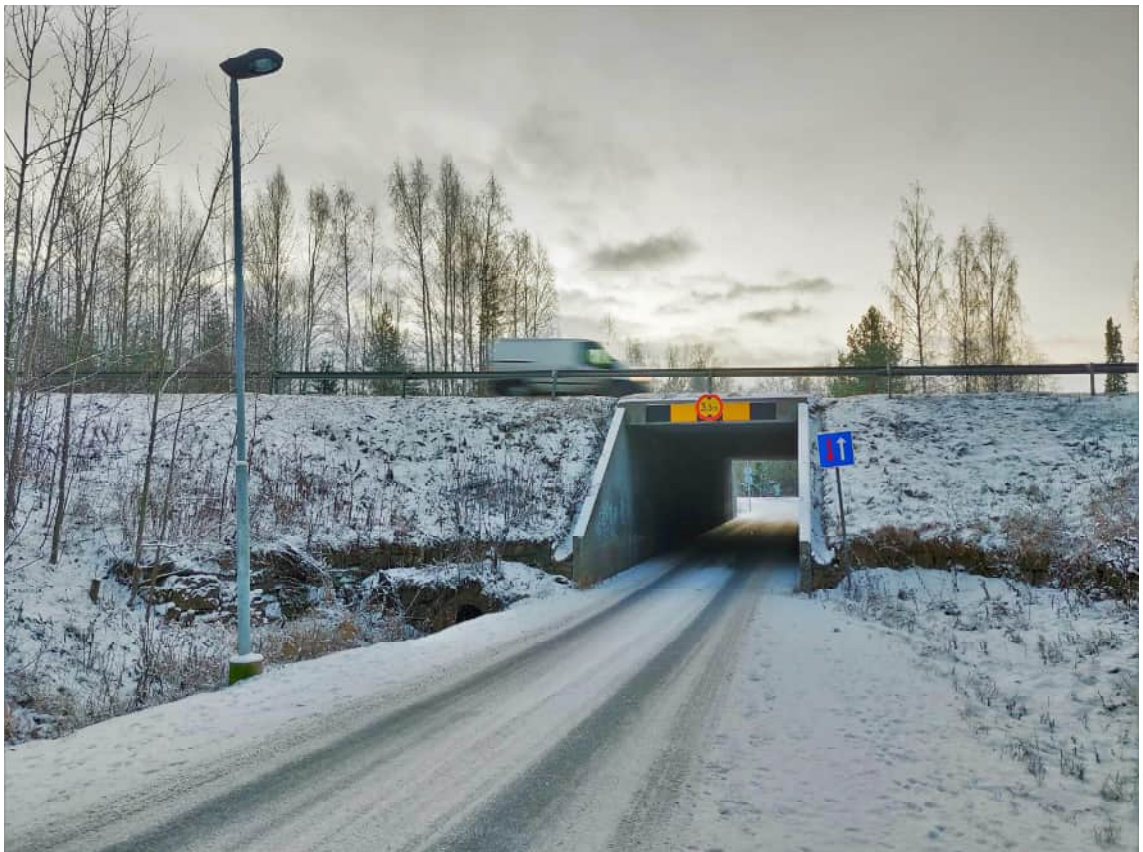
KUVA 10 12-tien alittava TOBI-silta Tampereella

Yleistyi 1960-luvulla, kun taajama-alueilla parannettiin liikenneturvallisuutta rakentamalla useita alikulkukäytäviä. Täysin elementtirakenteinen TOBI-alikulkukäytävä kehitettiin ja yleistyi 1960-luvulla, mutta poistui vähitellen käytöstä rakenteen monimutkaisuuden ja vaatimattoman estetiikan takia. (Lampikoski 2014)