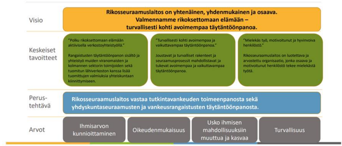
Kuvio 1: Rikosseuraamuslaitoksen toiminnan kulmakivet (Rikosseuraamuslaitos 2022c).