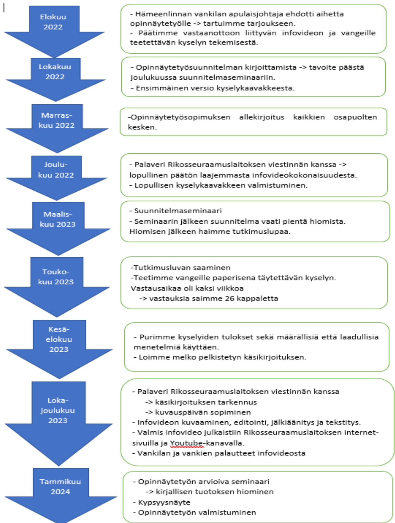
Kuvio 3: Opinnäytetyöprosessi