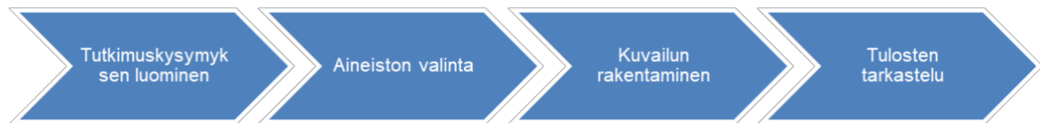
Kuvio 1. Kuvailevan kirjallisuuskatsauksen vaiheet

Kuvailevan kirjallisuuskatsauksen vaiheita ovat tutkimuskysymyksen luominen, aineiston valinta, kuvailun rakentaminen sekä tulosten tarkastelu. Menetelmän erityispiirteitä ovat aineistolähtöisyys, aiheen ja aineiston kuvailu sekä ymmärtäminen. (Kangasniemi ym. 2013: 294–296.)