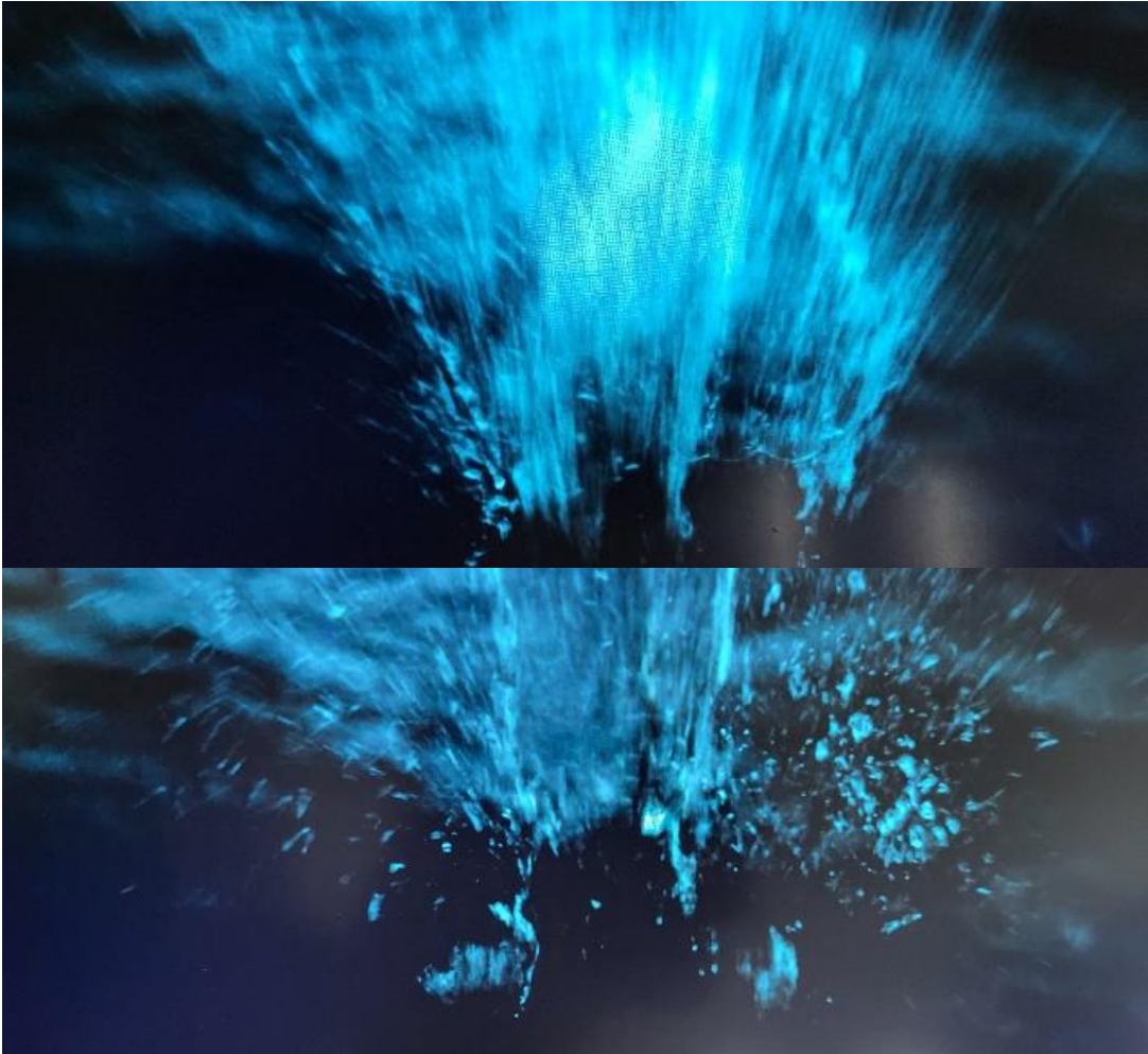
Kuvio 4. Hidastettua kuvaa ryöppyvästä vedestä In Dark Waters -teoksessa (2023)

Teoksen käännekohta on, kun hahmo menee pinnan alle: se on kohta, missä ahdistus on saavuttanut huippunsa. Äänimaailma paisuu veden alla ja lopulta purkautuu (kuvio 4).