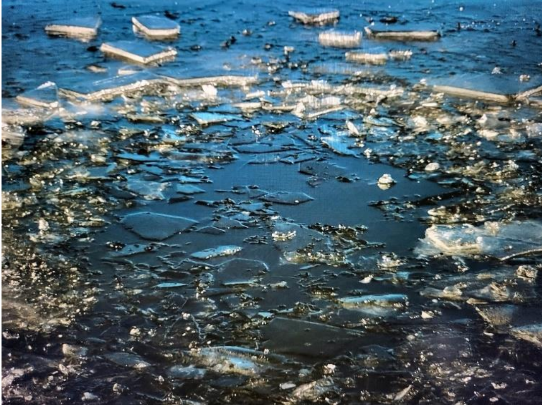
Kuvio 7. Jään pinta on särkynyt teoksessa In Dark Waters (2023)

Kuvaan videoteoksessani koko ajan tavallaan päänsisäistä maailmaa, vaikka hahmo nähdäänkin vain ulkoapäin. Videoteos päättyy kuvaan särkyneestä jään pinnasta, johon aurinko paistaa (kuvio 7). Pianomusiikki jatkuu lopputekstien ajan. Halusin jättää viimeiseksi ajatuksen toivosta ja valosta pimeyden keskellä, joka oli alusta saakka kantava ajatukseni teosta tehdessäni.