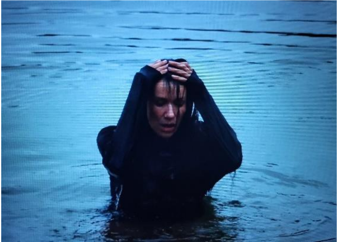
Kuvio 5. Nainen nousee vedestä henkeään haukkoen In Dark Waters -teoksessa (2023)

Eli lopulta ”valo” kuitenkin voittaa ja ahdistuksen huippu on selätetty. Veden ryöpyämisen jälkeen hahmo nousee pintaan henkeään haukkoen (kuvio 5). Äänimaailma on muuten hiljentynyt ja kuuluu vain haukkovan hengityksen ääni.