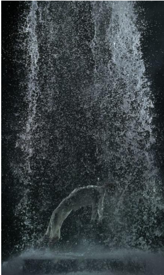
Kuvio 8. Pysäytyskuva Bill Violan teoksesta Tristan's Ascension (The Sound Of A Mountain Under A Waterfall) , 2005 (Viola 2005b)

roolissa ja visuaalisesti erittäin näyttävästi esillä (kuvio 8). Oman taiteellisen tekemiseni kannalta merkitystä olikin nimenomaan sillä, miten näyttävässä roolissa vesi elementtinä Violan teoksessa on. Myös äänimaailma Violan teoksessa on tärkeä ja se tuo veden "iholle" ja ympärille.