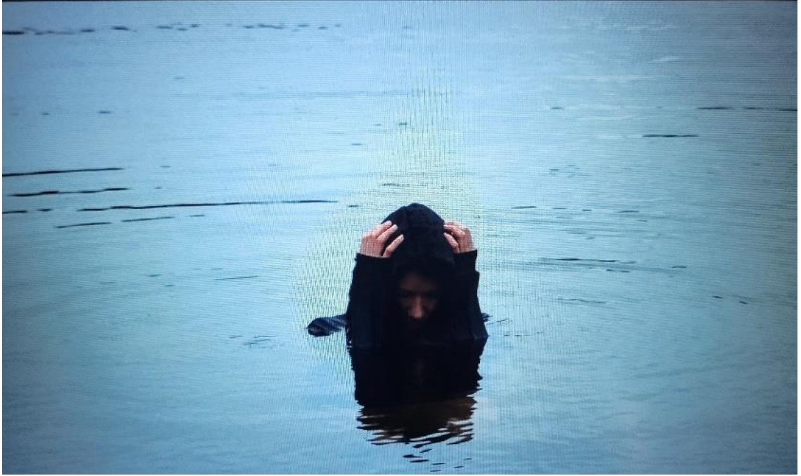
Kuvio 2. Nainen vedessä ahdistuksen vallassa In Dark Waters -teoksessa (2023)

Veden kylmyydestä johtuen kohtaus täytyi saada kuvattua mahdollisimman nopeasti. Olin lopulta vedessä yhteensä viisi minuuttia ja saimme kohtauksen kuvattua kokonaan tänä aikana. Tein vedessä muutamia eri variaatioita, joista leikkasin ja editoin teokseen haluamani lopputuloksen. Vesi oli kuvaushetkellä niin viiltävän kylmää, että se lopulta teki kipeää. Uskon, että tästä johtuen, videolle välittyi aidosti tunne ahdistuksesta.