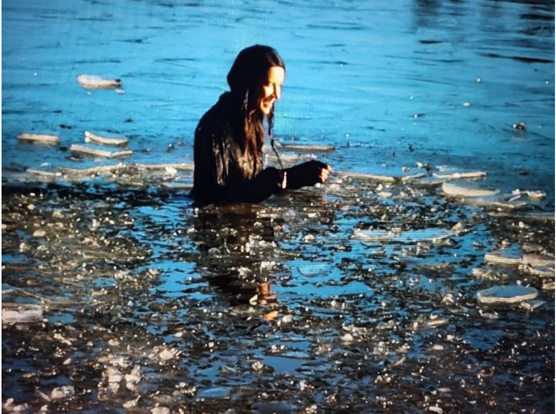
Kuvio 6. Nainen nousee helpottuneena vedestä, ahdistus on helpottanut In Dark Waters -teoksessa (2023)

Olisin halunnut viedä kameran veden alle ja ponnistaa sieltä kohti pintaa, mutta minulla ei ole siihen tarvittavaa vedenpitävää kalustoa, joten piti keksiä muita ratkaisuja. Kuvasin ahdistuksen helpottamista siten, että henkilö nousee pintaan, ympärillä jää on rikkoutunut ja auringonsäteet osuvat hahmoon sekä jäähän ja vedenpintaan. Myös värit ovat kunnolla palanneet maailmaan.