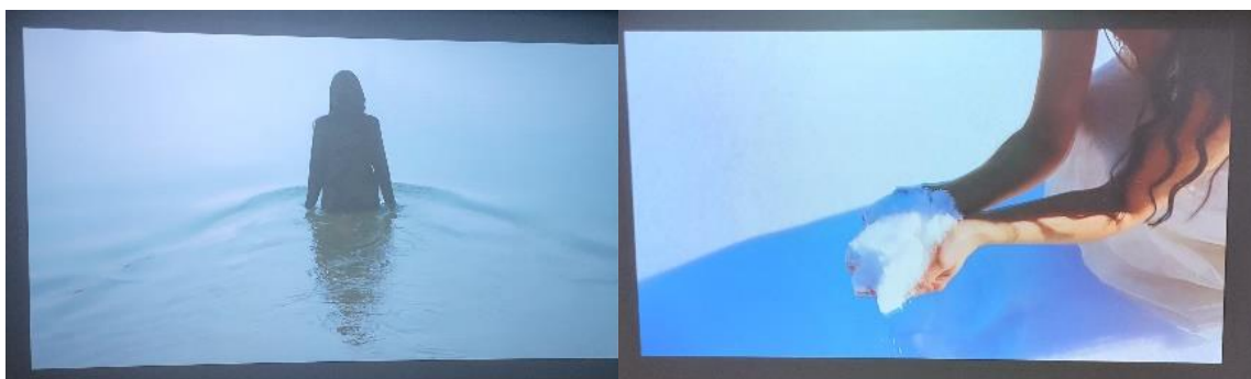
Kuvio 12. In Dark Waters (2023) ja A Poem (2023) teokset rinnakkain

Valmis teos esitettiin 4.11.2023 osana Marrastulet-festivaalia Tyrnävällä, Pohjois-Pohjanmaalla. In Dark Waters -videoteoksen parina oli A Poem-videoteos (kuvio 12). Teoksia esitettiin non-stop esityksenä yleisölle avoimessa tilassa Marrastulet-festivaalin päätapahtuman aikana parin tunnin ajan. Kumpikin teos oli kestoaltaan noin kaksi minuuttia pitkä.