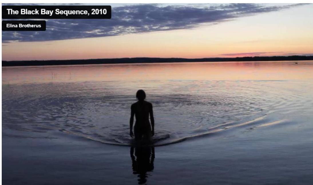
Kuvio 10. Pysäytyskuva Elina Brotheruksen videoteoksesta The Black Bay Sequence , 2010 (Brotherus 2010)

Yleisesti Brotheruksen töissä korostuu tilan ja ihmisen välinen suhde ja teokset sisältävät paljon viittauksia taidehistoriaan. Brotherus puhuu YouTube-videolla teoksestaan ja vedestä: ”se on aina samaa, muttei koskaan samaa” (Louisiana Channel 2017). Pystyn hyvin samaistumaan tähän ajatukseen: vaikka kuvaisin vettä kerta toisensa jälkeen samassa paikassa, se ei koskaan näytä samalta. Lisäksi veden kokemiseen vaikuttaa oma olotila; niin henkinen kuin fyysinenkin.