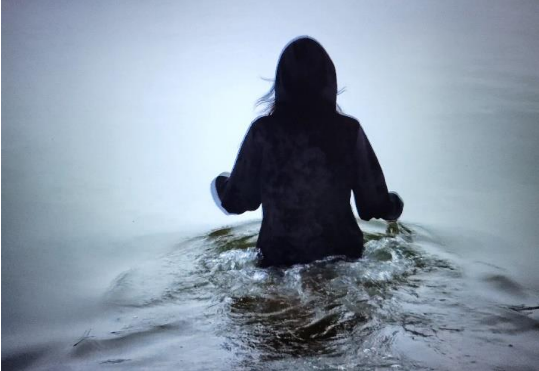
Kuvio 1. Nainen kävelee veteen In Dark Waters -teoksessa (2023)

Lopulta hahmo seisoo syvällä vedessä päätään pidellen ja selvästi ahdistuneena (kuvio 2). Vaikuttaa siltä kuin hän yrittäisi pitää itsensä kasassa tai sulkea ahdistusta ulkopuolelle siinä kuitenkaan onnistumatta. Äänimaailma jatkuu ahdistavana ja kuva välähtää välillä tummemmaksi, vähän kuin hehkulamppu, joka välähtelee epätasaisesti juuri ennen kuin on sammumassa. Kohtauksen lopuksi hahmo painautuu pinnan alle.