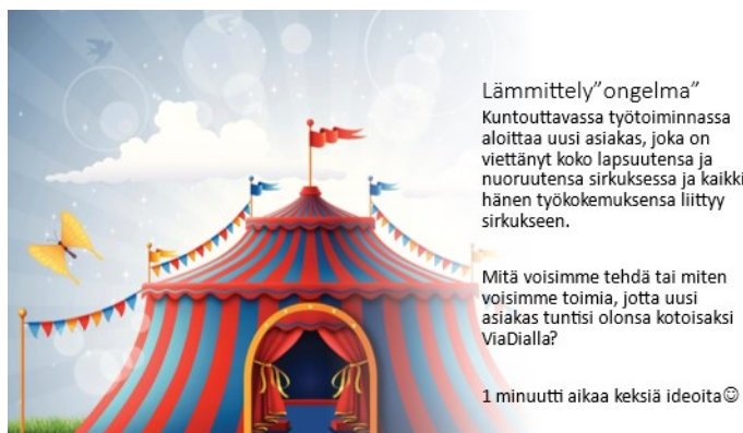
Kuva 1. Aivoriihen lämmittelyvaiheen tehtävä

Lämmittelyideoinnissa käytettiin liipasin-tekniikkaa. Liipasintekniikassa (trigger technique) osallistujat saavat ongelman, johon heidän tulee keksiä ratkaisuiideoita mahdollisimman nopeasti, korkeintaan muutaman minuutin aikana. Ideat voivat olla lyhyitä ja iskeviä. Käytetyn ajan jälkeen listatut ideat kerrotaan muille yksitellen ja muiden on tarkoituksena kehittää ideoita edelleen. (Harisalo 2011, 99.) Lämmittelyongelmana oli kuvitteellinen tilanne, jossa haettiin ideoita uuden asiakkaan aloittaessa kuntouttava työtoiminta (Kuva 1).