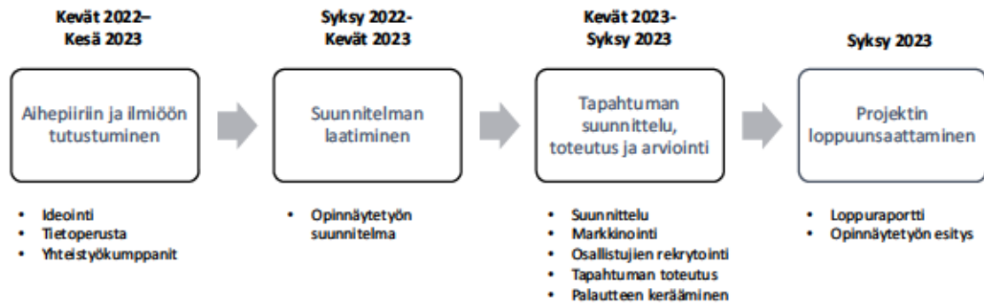
Kuvio 3. Prosessikaavio

Oheisessa prosessikaaviossa on kuvattu projektin aikataulu ja vaiheet (Kuvio 3).