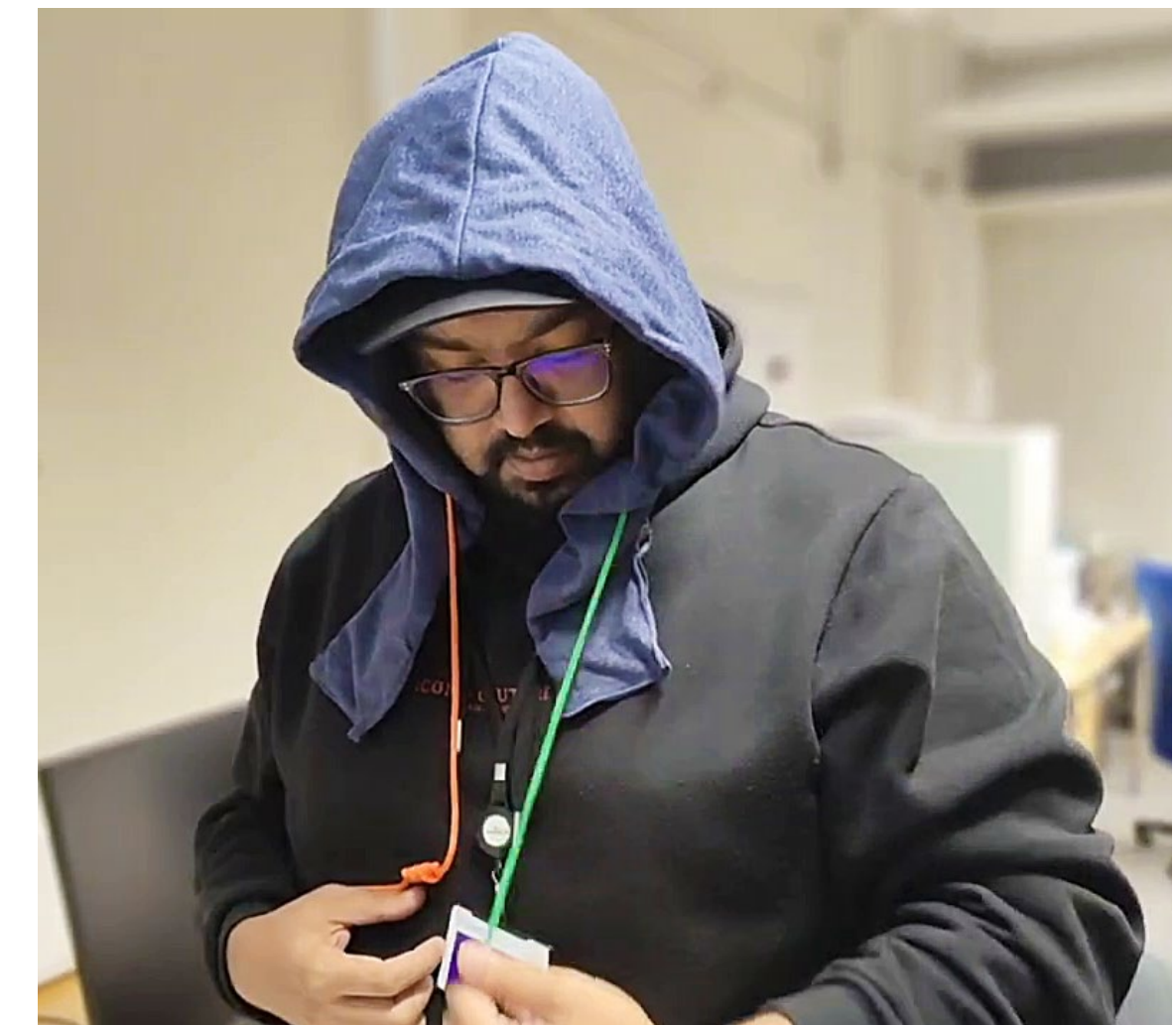
Älyhuppu: Kuva Mustasin Sakif