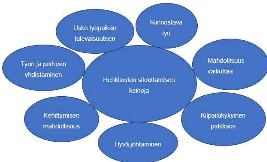
Kuva 1. Henkilöstön sitouttamisen keinoja (Viitala 2021.)

Työnantajan on osoitettava työntekijälle sitoutumista työntekijää kohtaan, jotta sitoutumiselle voidaan luoda edellytyksiä. Työpaikalla tämä näkyy luottamuksena työntekijöitä kohtaan, heille annetaan vaikutusmahdollisuuksia, sekä mahdollisuus käyttää kykyjään ja heille tarjotaan kehittymismahdollisuuksia. (Viitala 2021, luku.) Kun työyhteisöön luodaan hyväksyvä ilmapiiri, työntekijöitä arvostetaan, on omien intohimojen toteuttaminen mahdollista. Työntekijöiden innostus syntyy siitä, kun he saavat osallistua ja olla mukava vaikuttamassa. (Ristikangas & Ristikangas 2013, 269.)