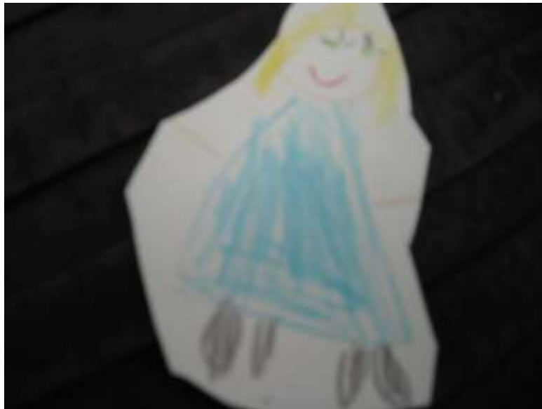
Kuva 3. Hahmo keinussa läheltä otettuna

Keinu ei näy, otan kuvan kauempaa. -- Nyt ei näy kasvoja, otan kuvan lähempää. Nämä kuvat voi niinkun yhdistää.