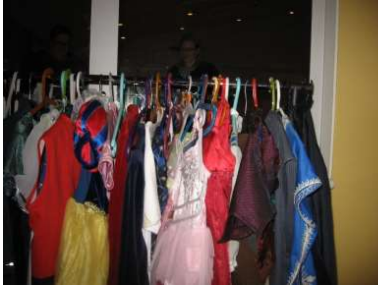
Kuva 1. Lapsen ottama kuva päiväkodin roolivaatteista

Kahdeksannella toimintakerralla kuvasimme neljän lapsen satuihin kuvat. Molemmat parit halusivat valokuvata päiväkodin salissa. Rekvisiittoja katseltiin taas yhdessä lasten kanssa, mutta vain kaksi lapsista koki tarvetta asusteille. Ensimmäinen lapsi valitsi itselleen viitan, sillä sadun hahmolla oli kylmä. Hän halusi ensin ottaa kuvan roolivaatteista (Kuva 1). Toinen lapsi valitsi itselleen narrin viitan, sillä se sopi hänen hahmolleen. Kuvia otattaessa salin ja salin yhteydessä olevan varaston tavaroita käytettiin luovasti. Salibandymaalista tuli häkki porsaalle ja salibandymaila toimi hyvin jääkiekkomailana. Yksi lapsista halusi näytellä koko tarinansa kuvien ottamisen yhteydessä. Muut lapsetkin esittivät roolejaan kuvissa.