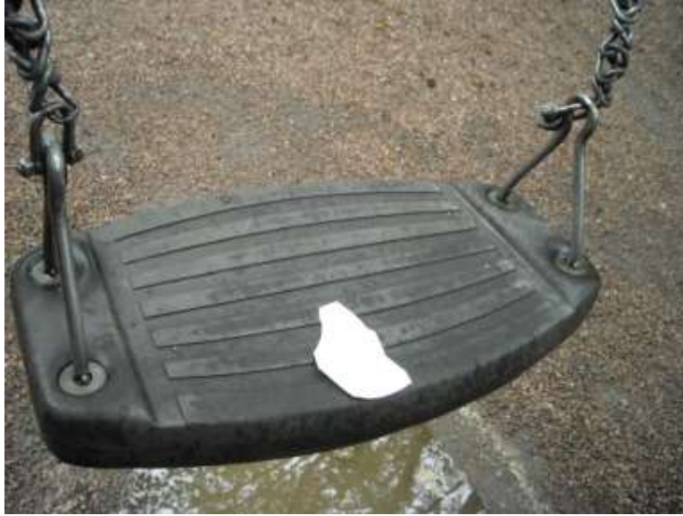
Kuva 4. Hahmo keinussa kaukaa otettuna

Piirtämiään hahmoja kuvatessaan osa lapsista asetteli ja sommitteli hahmot kuvaan tarkasti. Osa taas tiesi, missä halusi kuvata, mutta ei välittänyt lopputuloksen ulkonäöstä. Kaikilla lapsilla oli kuitenkin ideoita siitä, mitä hahmo voisi päiväkodin pihamaalla tehdä. Hahmot muun muassa istuivat penkillä, leikkivät kiipeilytelineellä tai laskivat liukumäessä. Ongelmia syntyi muun muassa siinä, miten hahmon saisi pysymään liukumäessä kuvan ottamisen ajan tai miten hahmo näyttäisi istuvan penkillä. Hahmoa saatettiin taitella tai leikata pienemmäksi kuvaustilanteessa. Eräs lapsista pyysi toista lasta pitämään hahmoaan liukumäessä, jotta voisi ottaa kuvan. Kokeilun avulla lapsi löysi kuitenkin kohdan liukumäestä, jossa hahmo pysyi tarpeeksi kauan paikallaan (Kuva 5).