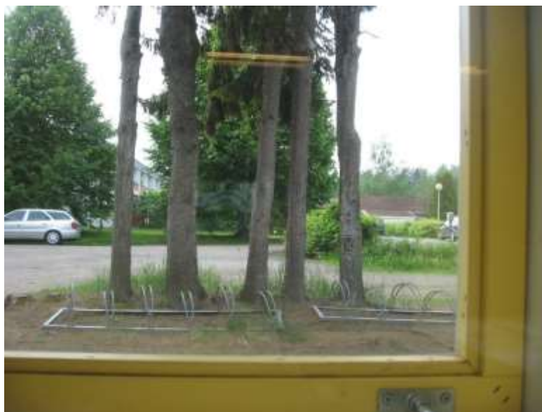
Kuva 6. Lapsen ottama kuva aiheesta Kotiinlähtö

Tutkimuksenteon aikana nähtiin viitteitä myös siitä, että ryhmämme viisivuotiaat lapset osasivat käyttää abstraktia ajattelua. Lapsen täytyy nähdä jokin asia ensin mielessään eli käyttää mielikuvitustaan. Yksi lapsista halusi valokuvata lempiasioita kuvata kotiinlähdön. Lapsi pohti asiaa ja päätyi ottamaan kuvan päiväkodin ikkunasta. Ikkunasta avautuva näkymä on se tie, mistä kotiinpäin aina lähdettiin (Kuva 6).