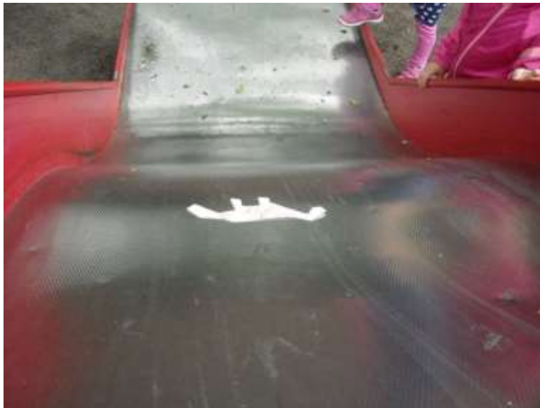
Kuva 5. Hahmo laskee liukumäestä

Piirtämiään hahmoja kuvatessaan osa lapsista asetteli ja sommitteli hahmot kuvaan tarkasti. Osa taas tiesi, missä halusi kuvata, mutta ei välittänyt lopputuloksen ulkonäöstä. Kaikilla lapsilla oli kuitenkin ideoita siitä, mitä hahmo voisi päiväkodin pihamaalla tehdä. Hahmot muun muassa istuivat penkillä, leikkivät kiipeilytelineellä tai laskivat liukumäessä. Ongelmia syntyi muun muassa siinä, miten hahmon saisi pysymään liukumäessä kuvan ottamisen ajan tai miten hahmo näyttäisi istuvan penkillä. Hahmoa saatettiin taitella tai leikata pienemmäksi kuvaustilanteessa. Eräs lapsista pyysi toista lasta pitämään hahmoaan liukumäessä, jotta voisi ottaa kuvan. Kokeilun avulla lapsi löysi kuitenkin kohdan liukumäestä, jossa hahmo pysyi tarpeeksi kauan paikallaan (Kuva 5).