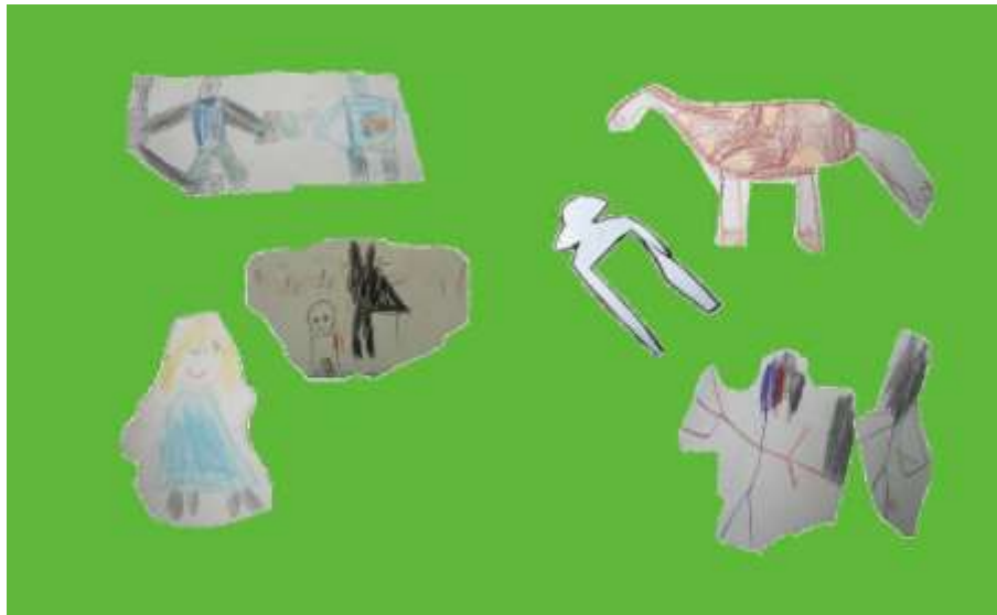
Kuva 2. Kuva-satukirjan kansikuva

löytyi Ifolorilta, jonka ohjelmalla kuva-satukirja tehtiin. Kuva-satukirjan kansi koostui lasten piirtämistä satuhahmoista (Kuva 2). Kirja tilattiin päiväkodille kiitoksena tutkimukseen osallistumisesta. Samalla päiväkodilla oleva kirja toimi mallina tutkimukseemme osallistuneiden lasten vanhemmille. Vanhemmille annettiin siis mahdollisuus tilata kirja myös itselleen.