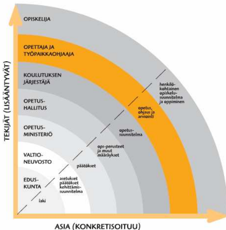
Kuvio 1. Opetussuunnitelmajärjestelmä (Mykrä T. 2002, 9)

Opetussuunnitelma kulkee monen eri tahon kautta ennen kuin se lopulta löytää opettajan ja viimein opiskelijan. Juuri opettajalla on kuitenkin ratkaiseva rooli opetussuunnitelman tulkitsemisessa ja toteuttamisessa, koska kaikista tahoista vain opettaja on yhteydessä opiskelijaan. Opettajana toimimisen perusedellytyksiä on olla perillä vähintään koulukohtaisesta suunnitelmasta. Vaikeaa on opettajan työtä tehdä, jos ei itsekään tiedä mitä opiskelijoiden tulisi oppia. Opettajalla on velvollisuus toteuttaa säädettyä opetussuunnitelmaa.