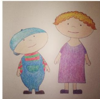
Lastensuojelun ryhmämuotoinen tukihenkilötoiminta