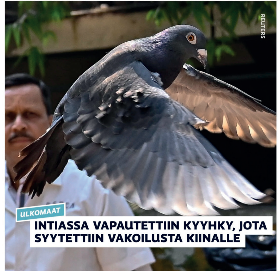
Kuva 10.