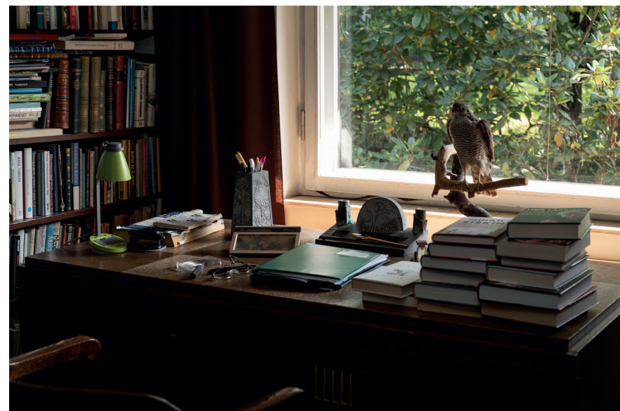
Kuva 14. Varpushaukka

Eläimellistämisen toimii esimerkiksi kognitiivisen dissonanssin keinona - oli kyse sitten ruoasta jota syömmme tai ratsastusharrastuksen eettisistä kysymyksistä. Samasta syystä eläimellistämäni valkoposkihanhen näköinen lahtelainen kaupunginvaltuuston jäsen voi vaalilupauksissaan luvata hankkiutua eroon Lahtea piinaavista valkoposkihanhista dronien ja koirien avulla jatkaen muiden lintulajien ja luonnon monimuotoisuuden ihailua. Eläimellistäminen lienee myös syy siihen, miksi lintuharrastajien kamerat eivät suuntaudu valkoposkihanhien suuntaan. Esteettisestä ulkonäöstä huolimatta ne pitävät näkyvällä paikalla isossa porukassa kovaa ääntä, syövät ja ulostavat. Ne edustavat kaikkea sitä, mitä eläimen tulisikin eläimellistettäessä edustaa: Barbaariset ei-ihmiset primitiivisine vaistoineen!