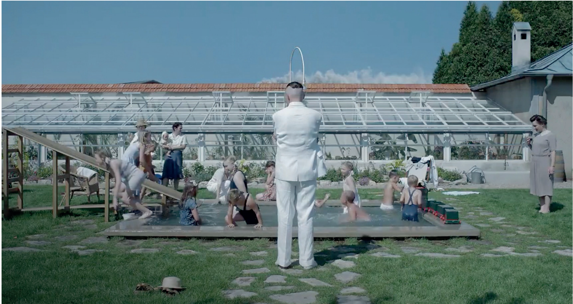
Kuva 13. The Zone of Interest (Glazer / A24 2023)