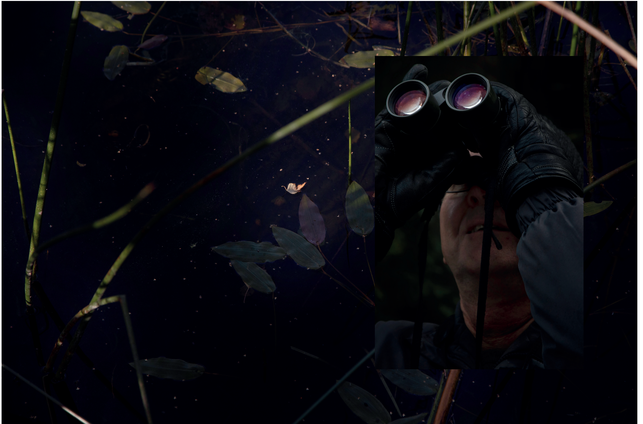
Kuva 5 & 6.