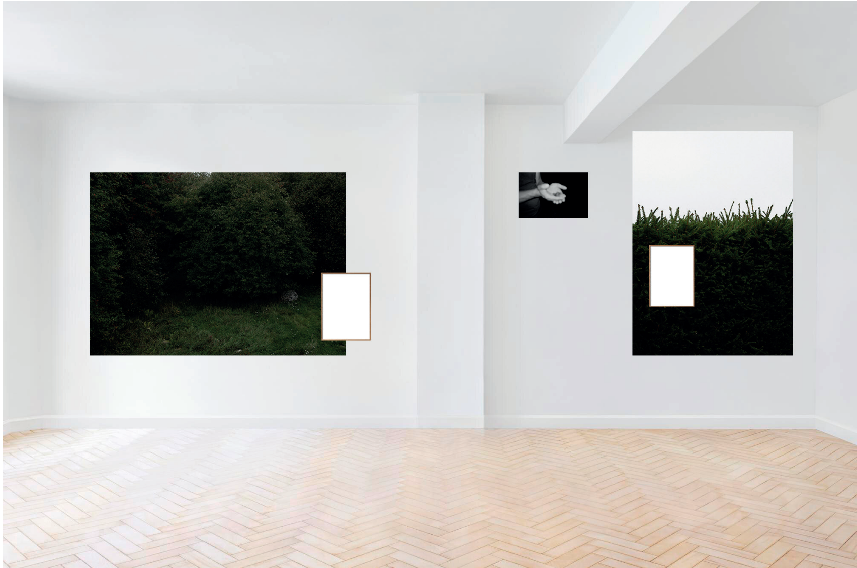
Kuva 16. Esimerkki ripustuksesta