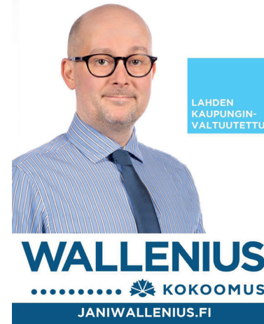
Kuva 2. Walleniuksen vaalimainos

Vaalimainoksia systemaattisesti rikkonut lahtelaisnainen tuomittiin sakkoihin - riistakamera tallensi puuhat vaalipäivän aamuna, etsintäoperaatio paljasti tekijän henkilöllisyyden