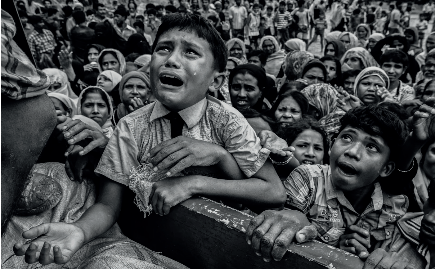
Kuva 12. Why the U.S. Finally Called a Genocide in Myanmar a 'Genocide'