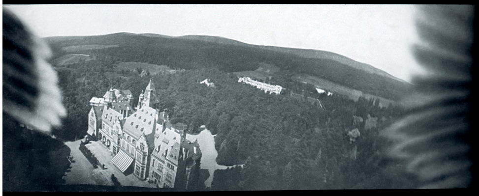
Kuva 9. The Pigeon Photographer (Rorhof 2018)