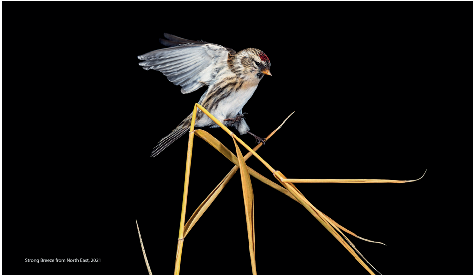
Kuva 7. Strong Breeze from North East (Kannisto 2021)

Valokuvataiteija Sanna Kannisto työskentelee luontokuvan äärellä. Hänen lintukuvansa muistuttavat lintuatlaskuvia (kuva 7). Kuvat ovat sommittelultaan maalauksellisia ja lajiominaiset piirteet erottuvat kuvissa hyvin. Kannisto on itse kuvaillut työskentelytavassaan yhdistyvän tiedemiehen ja taiteilijan roolin. Kanniston kuvissa korostuu asetelmallisuus. Luonto esitetään valoa läpikuultavaa valkoista akryyli-levyä vasten ja kuvaaminen vaatii tarkkaa suunnittelua, sillä kuvaustilanteen hän pyrkii hoitamaan nopeasti, jotta linnut saadaan vapautettua mahdollisimman pian. (Anttonen & Pennonen 2017, 179-180.) Kanniston kuvia voidaan tarkastella tietynlaisena luonnon haltuunottona. Vaikka villien lintujen kuvaaminen sisältääkin aina jonkin verran sattumaa, ovat kuvaustilanteet äärimmäisen harkittuja ja strukturoituja. Kanniston lintukuvat poikkeavatkin suuresti oman opinnäytetyöni kuvallisesta osiosta. Kannisto pyrkii kuvaamaan linnut mahdollisimman yksityiskohtaisesti ja näyttämään kuvan kohteen, kun taas itse pyrin kuvallisessa osiossani nimenomaan piilottamaan kuvatun kohteen.