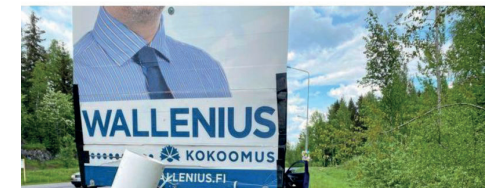
Kuva 3. Uutinen Walleniuksen vaalimainoksesta

Vaalimainoksia systemaattisesti rikkonut lahtelaisnainen tuomittiin sakkoihin - riistakamera tallensi puuhat vaalipäivän aamuna, etsintäoperaatio paljasti tekijän henkilöllisyyden