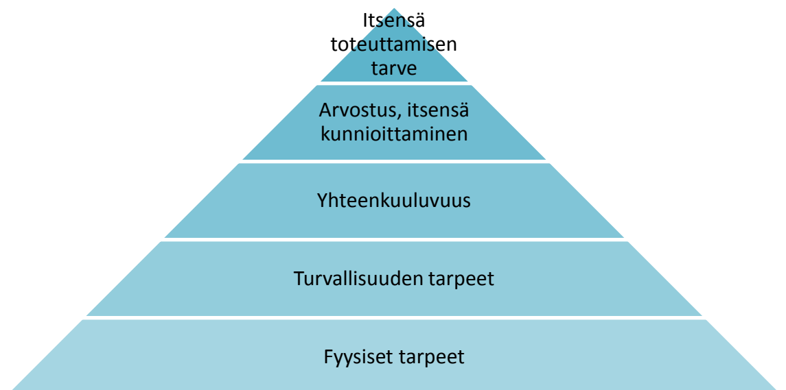
Kuva 2, Maslowin pyramidi, yksinkertaistettuna