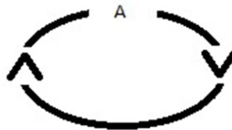
Kuva 4. Hermeneuttinen kehä

Ensimmäinen ehdotus mikä työtä tehdessäni tuli mieleen, oli että kannattaisi teettää tällainen tutkimus vuosittain jollain opiskelijalla tai antaa aihe opiskelijoille purtavaksi ja kerätä ideoita miten tällaisen kyselyn voisi paremmin toteuttaa. Paljon ammattitaitoa ja ideoita annetaan virrata sormien läpi niitä hyödyntämättä, kun eri alojen ammattilaiset käyvät koulussa tutkintonsa suorittamassa, eikä heiltä saada kunnollista palautetta. Tässäkin toimii hermeneuttinen kehä eli saaduista tuloksista oppimalla voidaan syventää tietämystä ja parantaa lopputulosta, aina.