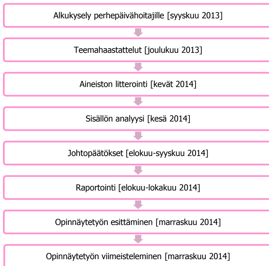
KUVIO 1. Opinnäytetyönprosessin kuvaus

Tutkimusta varten anoimme tutkimuslupaa Iisalmen kaupungin päivähoidon johtajalta. Päivähoidon johtaja myönsi tutkimusluvan ennen työsuunnitelman valmistumista, sillä toteutimme opinnäytetyömme kuuluvan alkukyselyn jo syyskuussa 2013. Kuviossa 1 esittelemme tiivistetysti opinnäytetyönprosessin kuvauksen.