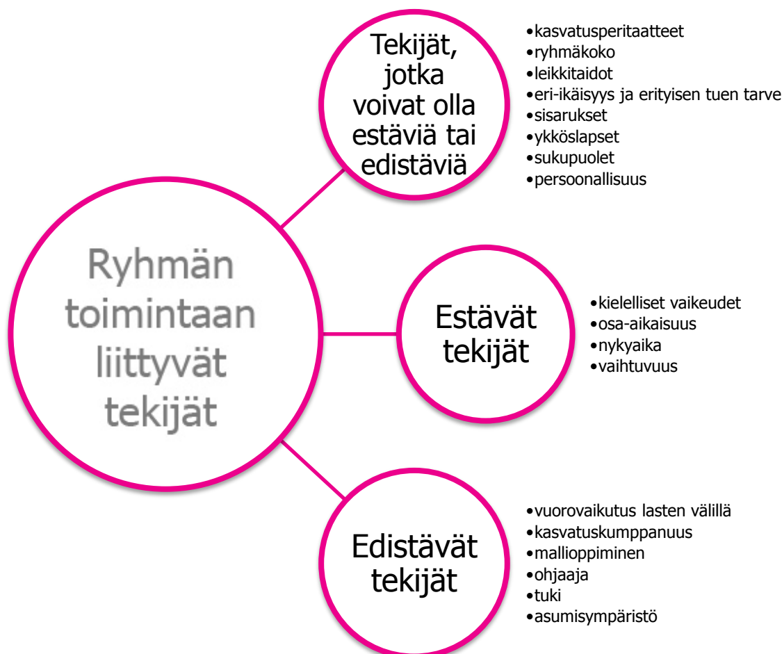
KUVIO 3. Ryhmän toimintaan liittyvät tekijät.

Päivähoidossa lapsiryhmien toimintaan ja ryhmäytymiseen vaikuttavat monet asiat. Haastateltavien kokemukset ryhmän toimintaan vaikuttavista tekijöistä olivat pääosin yhteneviä ja lähtöisin lapsien ominaisuuksista. Tutkimuksessamme selvisi, että vastaajat kuvailivat useita tekijöitä sekä ryhmän toimintaa edistäviksi että estäviksi tekijöiksi. Suurin osa tekijöistä oli kuitenkin sellaisia, jotka luokiteltiin tilanteesta riippuvaisiksi sen suhteen, ovatko ne ryhmäytymistä ja ryhmän toimintaa edistäviä vai estäviä tekijöitä. Havainnollistamme ryhmän toimintaan liittyviä tekijöitä kuviossa 3. Käsitlemme seuraavassa ensin edistävät tekijät, tämän jälkeen estävät tekijät ja lopuksi tekijät jotka voivat olla ryhmän toimintaa edistäviä tai estäviä.