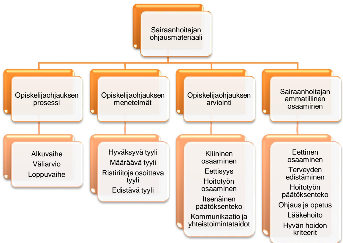
Kuvio 1. Sairaanhoitajan ohjausmateriaalin luokitukset

Sairaanhoitajan ammatillinen osaaminen sisältää kuusi alaluokkaa joita olivat eettinen osaaminen, terveyden edistäminen, hoitotyön päätöksenteko, ohjaus ja opetus, lääkehoito ja hyvän hoidon kriteerit. Eettinen osaamisen pelkistetty ilmaus oli arvot. Terveyden edistäminen muodostui kolmesta pelkistetystä ilmauksesta, joita olivat kehitys, edistäminen ja kuntoutus. Hoitotyön päätöksenteko muodostui kolmesta pelkistetystä ilmauksesta, joita olivat näyttöön perustuva hoitotyö, suunnittelu ja dokumentointi. Ohjaus ja opetus muodostui neljästä pelkistetystä ilmauksesta, joita olivat potilasohjaus, opiskelijaohjaus, ohjausmateriaali ja turvallisuus. Lääkehoito muodostui neljästä pelkistetystä ilmauksesta, joita olivat lääkehoidon prosessi, lääkkeiden käsittely, suonensisäinen lääkehoito ja lääkehoidon teoria. Hyvän hoidon kriteerin pelkistetty ilmaus oli potilaan tarkkailu.