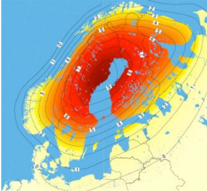
Kuvio 7. Fennoskandian maannousu Maan keskipisteen suhteen. (Geodeettinen laitos)

keskivedenpintaan nähden. Tässä tapauksessa maannousema on etäännyttänyt rakennuksia vesirajasta. Fennoskandian maannousussa Ruoveden voidaan lukea kuuluvan vyöhykkeeseen, jossa nousua tapahtuu vuodessa 6 mm. (Kuva 7.)