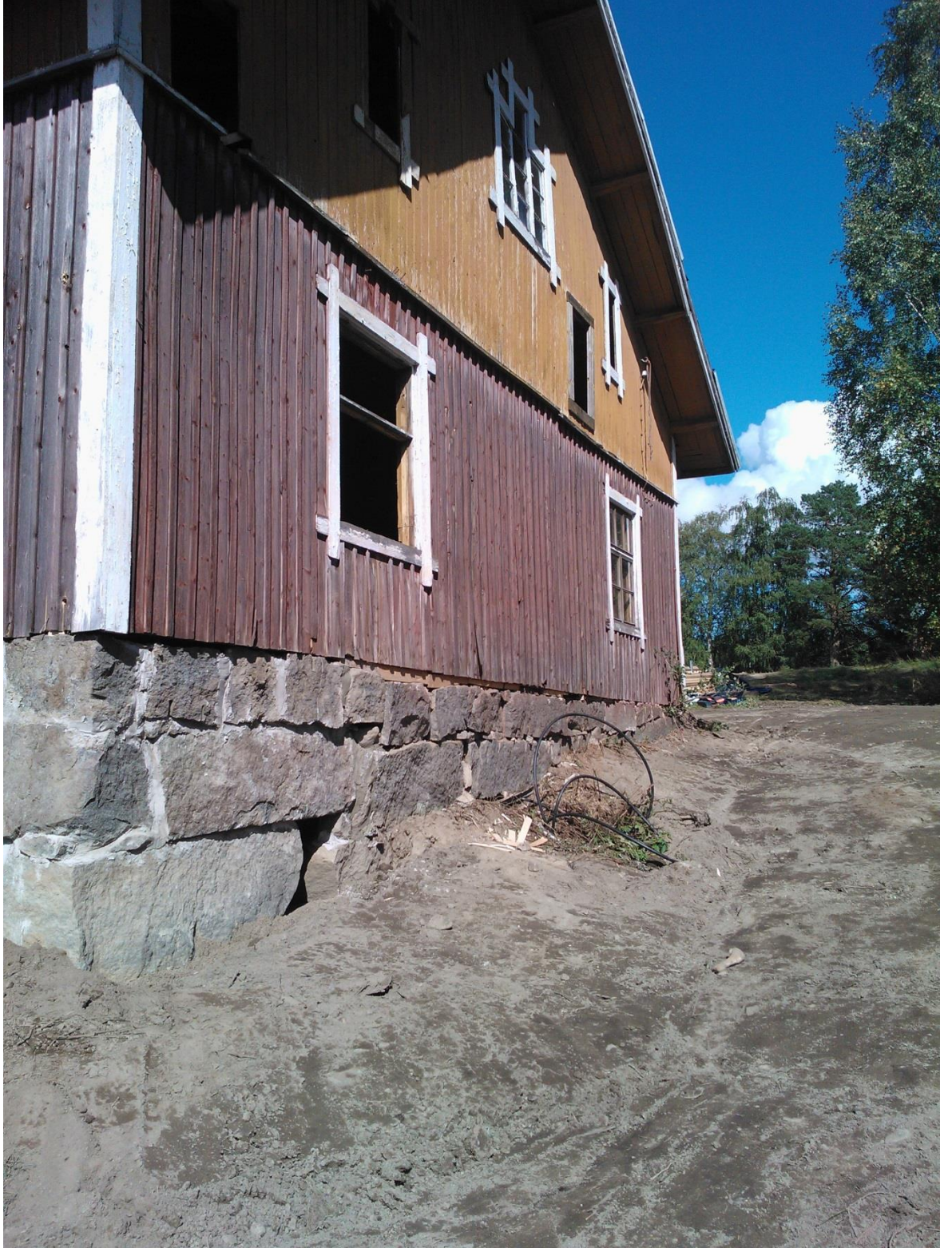
Kuvio 29. Ulkopuolelle näkyvät työt valmiina.