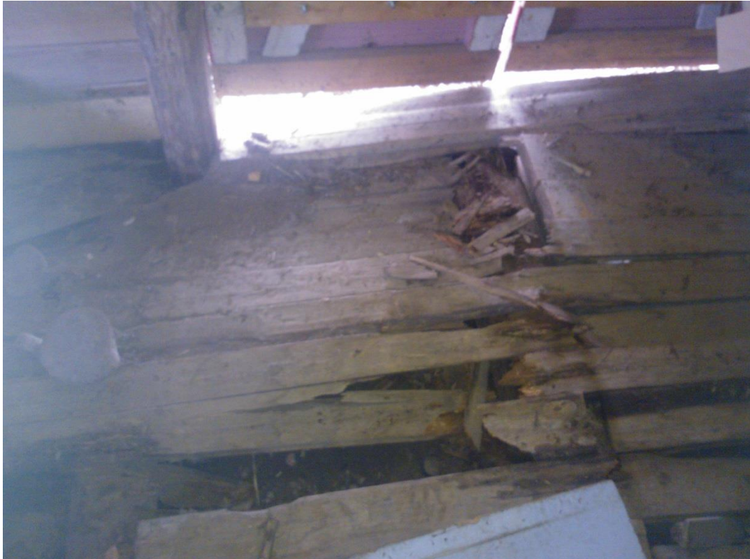
Kuvio 14. Lahonnutta rossipohjaa Laivarannan makasiinirakennuksessa.

Maaperätutkimusta voidaan suositella ratkaisuna erityisesti tapauksissa joissa ei voida varmistua pohjan kantavuudesta tai hulevesien poistumisesta tontilta asetusten mukaisesti. Maankäyttö- ja rakennuslain mukaan rakennusluvan myöntämiseen asemakaava-alueella vaaditaan pohjatutkimus sekä mahdollisesti suunnitelmat sadevesi- sekä jätevesiverkostoon liittymisestä. Tämä kannattaa varmistaa ennen töiden ja suunnittelun aloitusta kyseessä olevan paikkakunnan rakennusvalvonnasta.