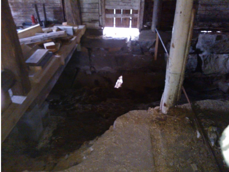
Kuvio 30, Rossipohja sekä välikattoa tukeva pilari.

Hulevesien ohjaukselle tärkeä luiskaus alamäkeen tehtiin myös tälle seinustalle salaojan lisäksi. Perustus ei ole täysin suora nyt korjaamatta jätetyllä osalla, ja myöskään kivien saumaus ei ole täydellistä. Nämä eivät kuitenkaan ole kuin ulko-näöllisiä seikkoja. (Kuva 29.)