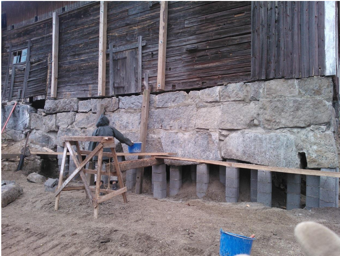
Kuvio 25. Kivien saumaustyötä. Rakennuksen paino on täysin perustuksensa varassa.