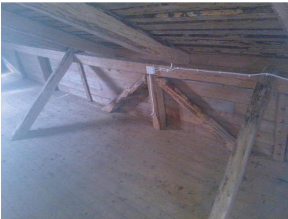
Kuvio 4. Suuremman makasiinin kattorakenteita.