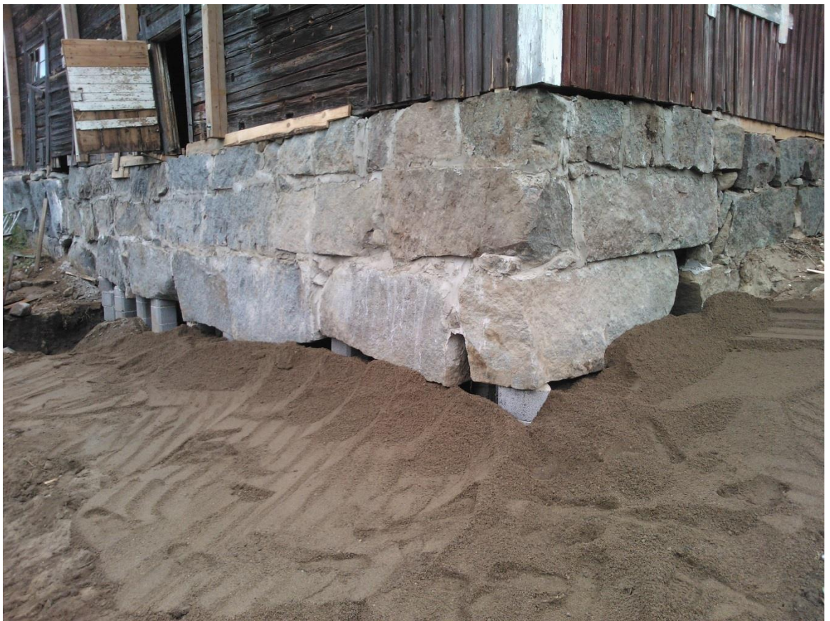
Kuvio 26. Salaojittava kerros levitettynä.

Kuvasta 24. nähdään, kuinka kivet kapenevat ja muuttuvat epämääräisemmäksi, kun siirrytään korkeampiin kerroksiin. Saumaustyötä on takapuoleltakin aloitettu, mutta tällä puolella saumaus on pelkästään kivien tartunnan vuoksi tehty. Ulkona ei ole väliä piiloon jäävällä perusmuurin puolella, ja tarpeen vaatiessa, mikäli kivet olisivat menneet oikein silpuksi seinää purkaessa oltaisiin voitu tehdä valu takapuolelle, joka ei olisi ottanut vastaan kuormia. Nytkin muutamia kiviä hajosi kahteen tai kolmeen osaan purkuvaiheessa, mutta jäivät kuitenkin vielä riittävän kokoisiksi, että ne kannatti laittaa paikoilleen. Puuttuvat kivet voidaan korvata betonilla ja näkyvä pinta peittää peite kivellä.