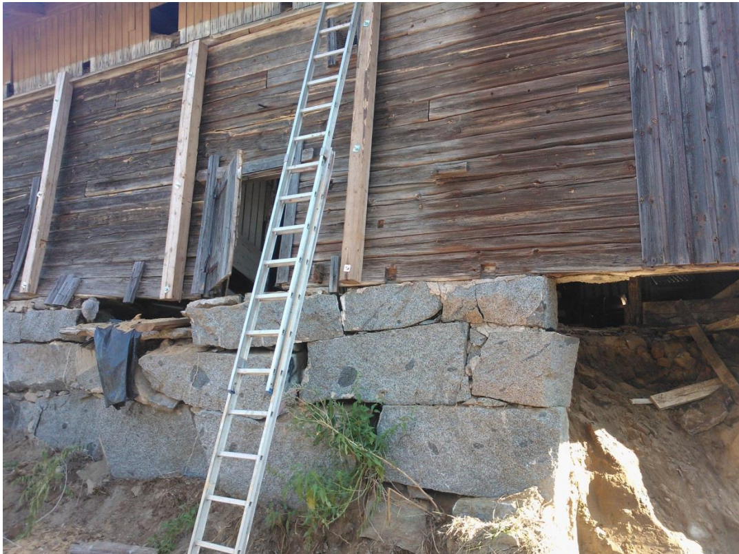
Kuvio 17. Hirsiseinän tukipuut asennettuina.

Kuvassa 16 on esitettyä kiviä purettuina seinärakenteesta. Tarvittavat merkinnät on tehty spray-maalilla aina samalle syrjälle, merkatun kiven asento sekä sijainti seinälinjassa. Tämä helpottaa huomattavasti uudelleenrakentamista kun järjestys on selvillä. Myös kiilakivien talteenotto on suotavaa, mikäli uusia ei helposti saada hankittua. Työskentelyalueella pienet kivet tahtovat kadota ainakin pehmeään maaperään.