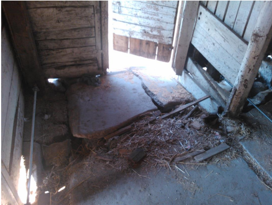
Kuvio 13. Vaurioitunut maanvarainen laatta.

Maavaraisten lattioiden yhteydessä voidaan usein huomata viimeistään rakennusten jäätyä lämmittämättömiksi, että lattiat ovat haljenneet. (Kuva 13.)