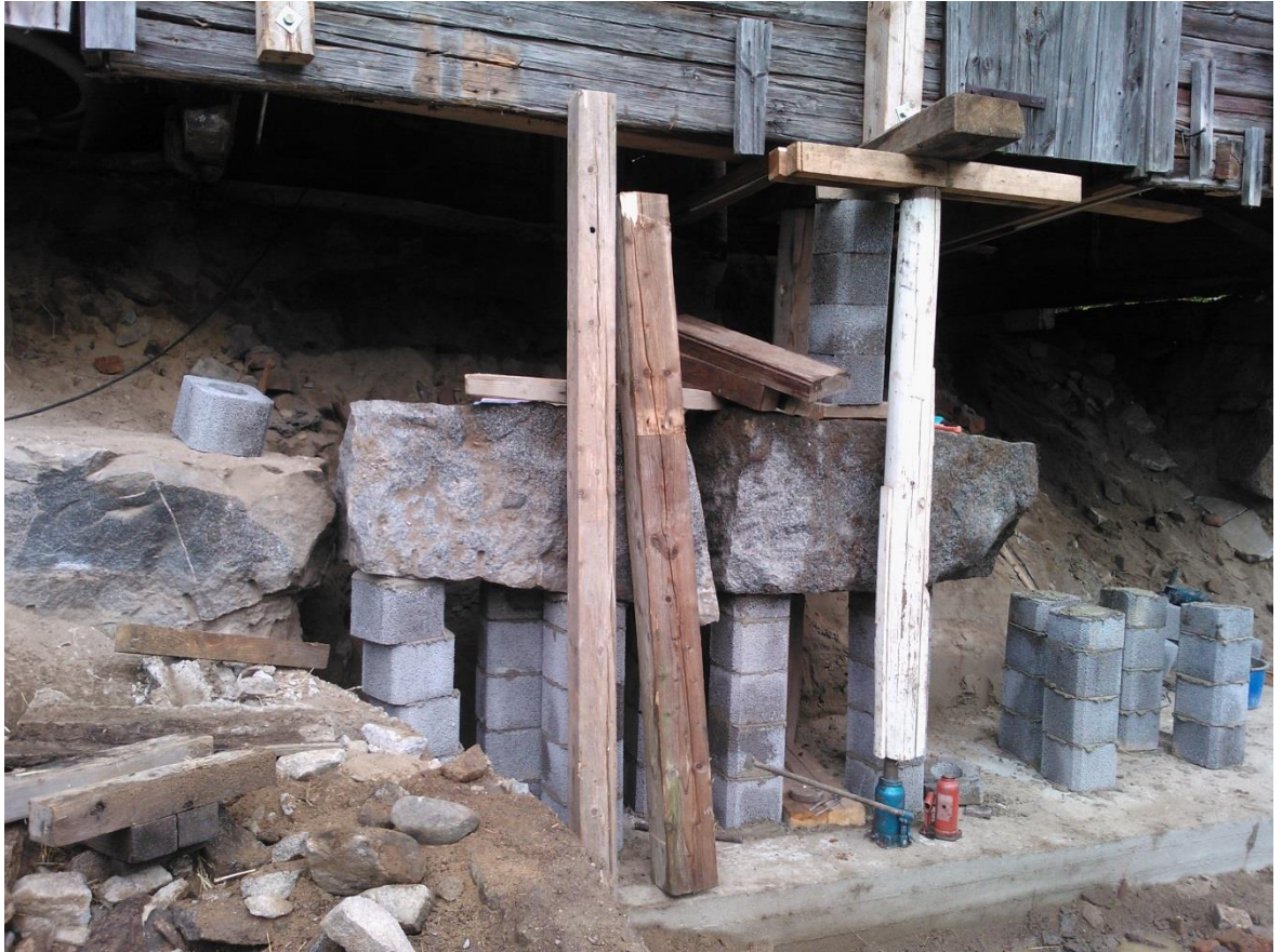
Kuvio 22. Ensimmäinen kivikerros aseteltuna paikoilleen.

Kuvassa 22. nähdään tekniikka, miten ensimmäinen kivikerros asetettiin oikeaan korkoon. Anturalinja kaivettiin pitävälle pohjalle asti eikä tehty täyttöä. Vähemmäläkin korotuksella pärjäisi, mikäli anturalinja olisi korkeammassa tasossa vanhoihin rakenteisiin nähden. Leca-pilariharkot on sahattu oikeaan muotoon sovittamalla kiveä kaivinkoneen trukkipiikeillä paikoilleen ja tekemällä tarpeelliset mittaukset. Pilariharkoissa on 2 kpl 10 mm A500HW-harjateräksiä raudoitteina ja K30-luokan betonivalu, joka sitoo pilarin. Kiven ja harkon välinen sauma on tehty 100/600-luokan muurauslaastilla. Keskimäärin yhden kiven asettaminen vei kahden miehen työryhmältä sekä kaivinkoneelta kuljettajan kanssa noin tunnin riippuen kiven alapinnan muodosta sekä pituudesta. Laastit sekä betonit sekoitettiin työmaalla valovirtatoimisella betonimyllyllä ja käytännössä yhden miehen työtunnit voitiin päivittäin laskea myllyn kanssa toimimiseen.