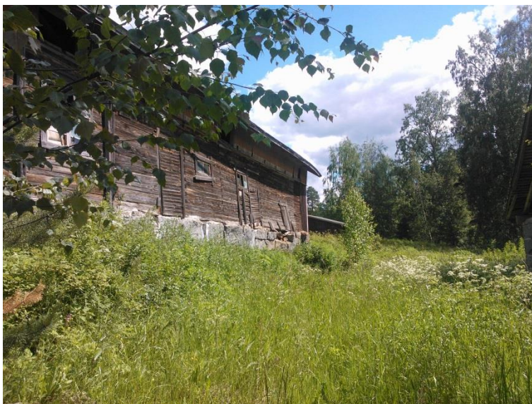
Kuvio 12. Vaurioitunut kiviperustus.

Vaurioiden tutkiminen voidaan aloittaa yleensä silmämääräisellä tarkastelulla. Esimerkiksi kuvan 12. tapauksessa nähdään jo kaukaa perusmuurin pettäneen, ja samalla hirsirungon lähteneen liikkumaan perustuksen mukana. Omien havaintojeni perusteella tohdin kirjoittaa tähän työhön että tuoreimmatkin kiviperustukset alkavat olla aikakaudelta ennen rintamamiestaloja (1940-luku). Nämäkin perustukset alkavat olla jo kylissä joissa on ollut asiansa osaavia kivimiehiä. Kivirakentamisen kultakauden voidaan sanoa osuneen 1900-luvun taitteeseen. (Rakennusperintö). Mikäli vaurioita ei ole syntynyt, olosuhteet tulisi pitää samanlaisina kuin