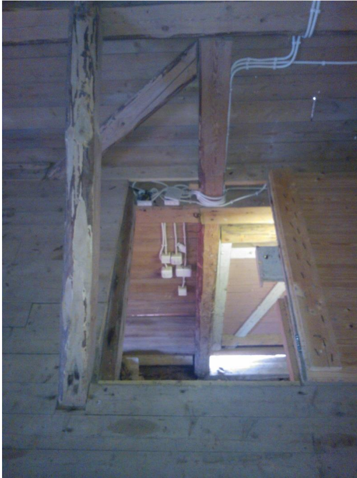
Kuvio 32. Aukko makasiinin välikatossa.