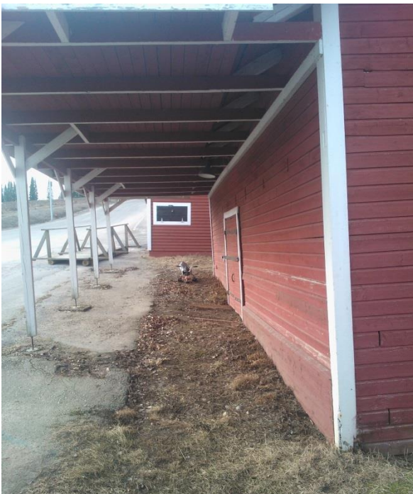
Kuvio 3. Julkisivunpuoleinen seinä tielle.

Alkuperäisiin rakenteisiin on tehty muutoksia painuman vuoksi, mistä johtuen myöhemmin uudelleenrakennettu lippa pääjulkisivun puolella on rakennettu noin 500 millimetriä alkuperäistä korkeammalle tasolle. (Kuva 3.) Lipan muu- tostyötä tehdessä 80-luvulla on kattohuopa vaihdettu uuteen. Vesikatto on toiminut moitteettomasti eikä sisäkatos- sa tai ruoteissa voida havaita katto- vuodon aiheuttamia vaurioita. (Kuva 4.) Rakennusten puurunko on hyväkuntoi- nen niiltä osin kuin puuosat eivät ole pääseet maakosteuden kanssa tekemi- siin. (Kuva 5.) Nämä kosteuden kans-