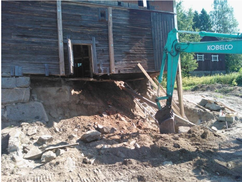
Kuvio 19. Maanpaineen poistoa.

Maanpaine luonnonkiviseinästä vasten aiheuttaa ongelmia yhdistettynä kosteuteen maa-aineksissa. Routiminen yhdistettynä kylmilleen jätettyyn rakennukseen aiheuttaa maanpainetta myös sivusuuntaankin. (Kappaleessa 4.3, Routimisilmiö)