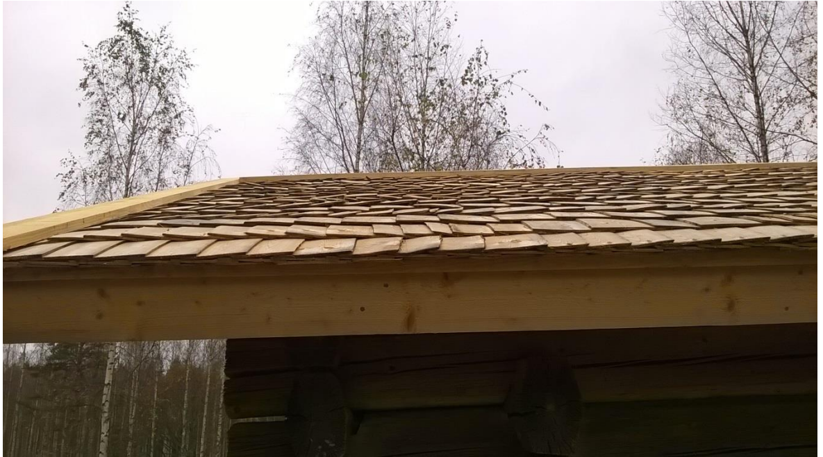
Kuvio 34. 2014 Valmistunut aitan pärekatto Vilppulassa.

Julkisivulaudoitukset ovat pääosin tällä hetkellä kunnossa ja vuorausta ei tarvitse uusia kuin lahonneilta kohdiltaan. Maalipintana on pääosin tiettävästi itsekeitetty punamultamaali, jonka päälle voidaan maalata uudelleen ns. ”museon punamultamaalilla”. Erona teollisesti valmistettuihin punamaaleihin on se, että sideaineena teollisissa punamaaleissa on muovi tai muovin johdannainen. Oikeassa punamultamaalissa ei ole kuin orgaanisia aineita ja varsinaisena sideaineena käytetään ruisjauhoa, joka lisätään maalia keitetäessä. (Kaila 1997, 600-601).