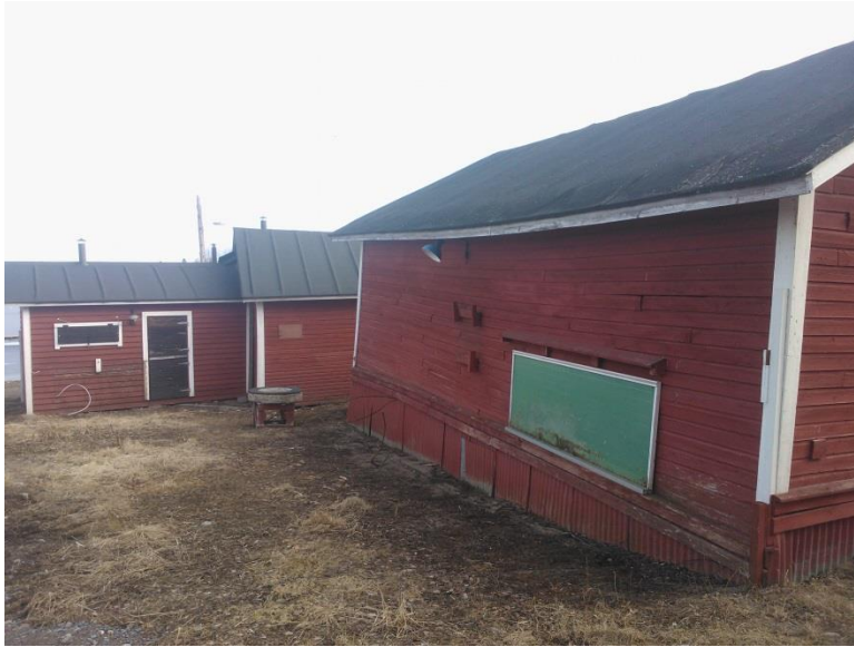
Kuvio 2. Rakennusten julkisivu takaviistosta kuvattuna.