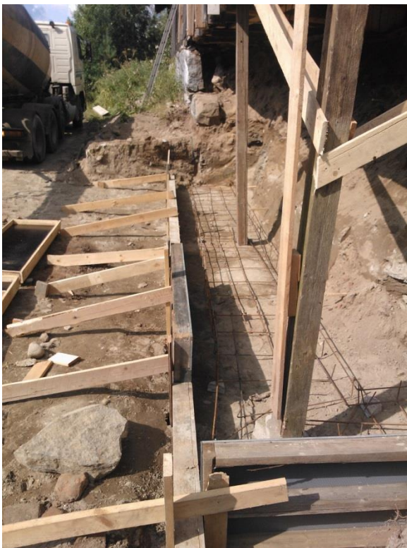
Kuvio 20. Uuden anturan raudoitukset ja muotit.

Maanpaine luonnonkiviseinästä vasten aiheuttaa ongelmia yhdistettynä kosteuteen maa-aineksissa. Routiminen yhdistettynä kylmilleen jätettyyn rakennukseen aiheuttaa maanpainetta myös sivusuuntaankin. (Kappaleessa 4.3, Routimisilmiö)