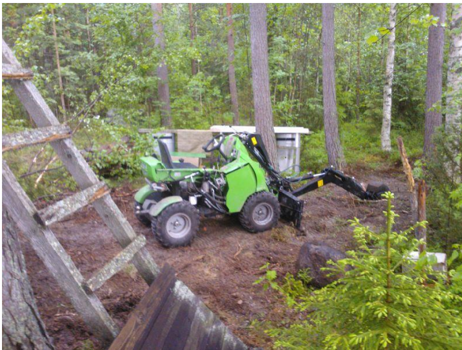
Kuvio 28. Työmaalla käytetty pienkuormaaja.

Luiskat sekä täytöt tehtiin aikaisemmissa kaivuuvaiheissa läjitetyillä maamassoilla. Tämän vuoksi työmaasuunnittelu pienelläkin työmaalla vähentää konetyötunteja.