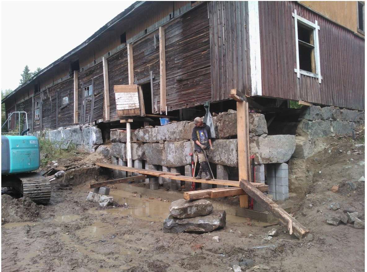
Kuvio 23. Kivien asennusta.

Seuraavat kivikerrokset asennettiin ulkopuolen linjan mukaan kaivinkoneen ja sorkkaraudan avulla. Kun kivi saatiin oikeaan asentoon kiilakivet aseteltiin tarvittaviin kulmiin asettaen muurauslaastia kiilakivien molemmin puolin tartunnan varmistamiseksi. Työ saadaan tehtyä sujuvasti kahden miehen asennusryhmällä, kolmannen huolehtiessa laastin tekemisestä ja kuljettamisesta asennuskohteeseen. Varsinainen saumaus voidaan suorittaa vasta perusmuurin ollessa loppukorkeudessa, ja työn sujuvuutta helpottaa suurimpien rakojen saumaus kahdessa eri osassa.