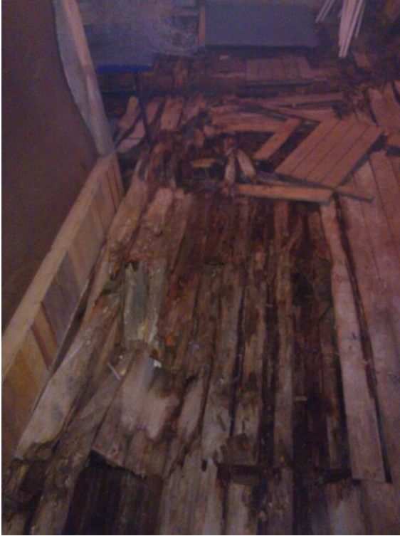
Kuvio 1. Lattiarakennetta keväällä 2014.

Maapohja makasiinirakennusten alla on kuulunut aikaisemmin Ritoniemen Kartanon omistukseen, mutta kuuluu nykyään Ruoveden kunnalle vuonna 1996 tapahtuneiden maanvaihtokauppojen myötä. (Apell 2013. )