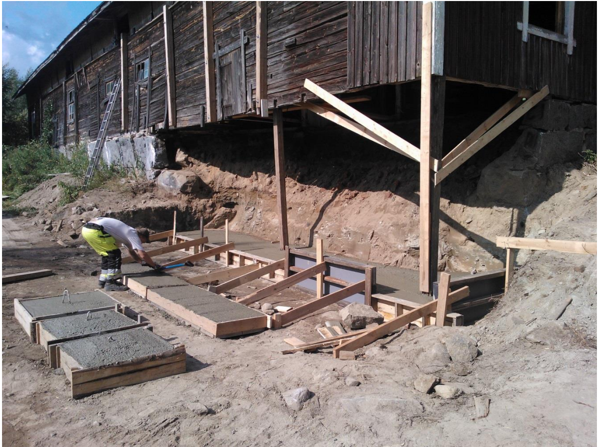
Kuvio 21. Antura valettuna.

Raudoitukset ovat 8mm A500H terästä, k200 jaolla. Raudoitteet ovat paikanpäällä mitoitettu ja taivutettu. Muotteina käytettiin valmiita muottielementtejä.