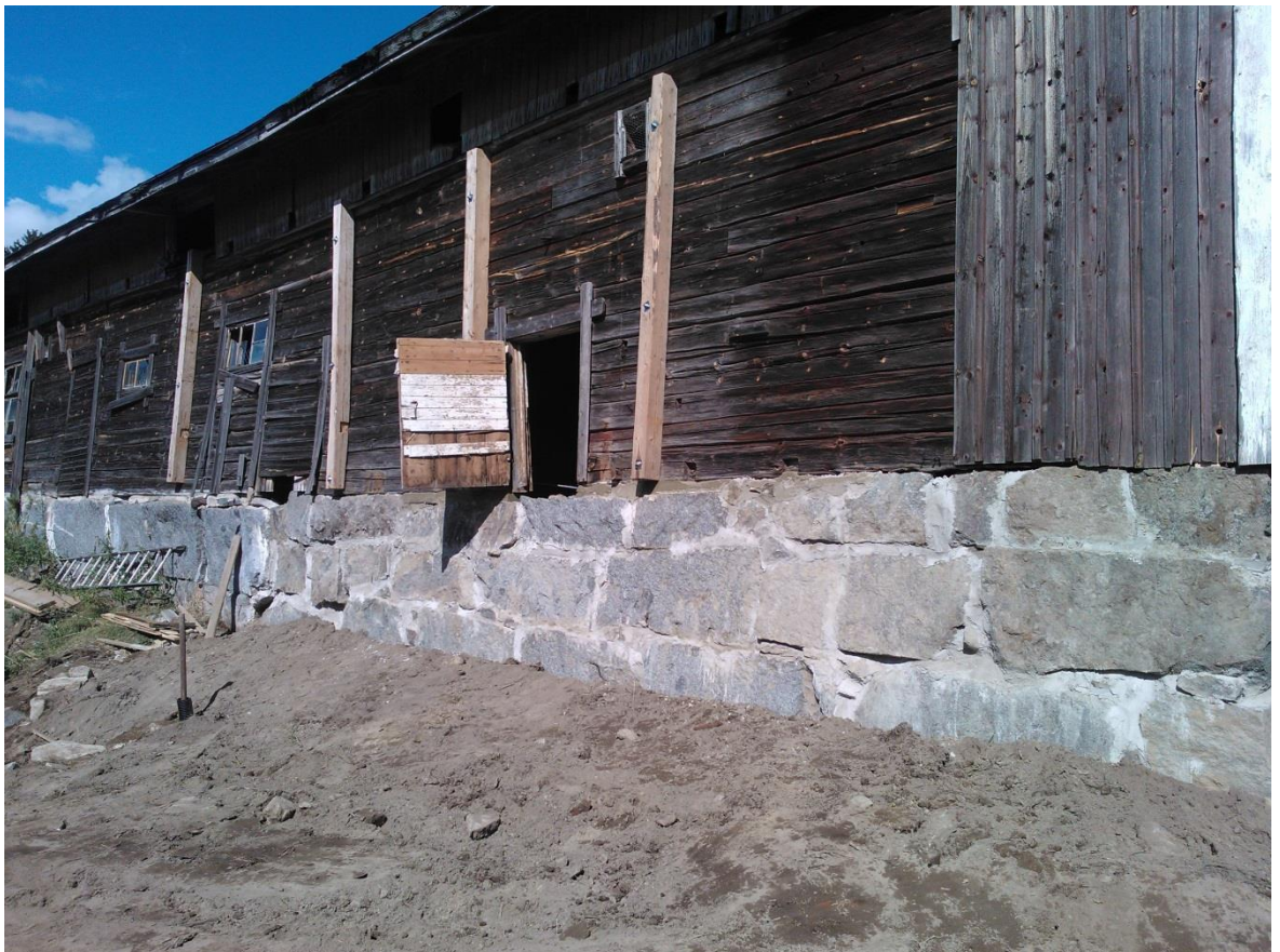
Kuvio 27. Työkohde valmiina.

Kulkuteiden kohdille rakennettiin kyllästetystä puusta kulkusillat jolloin niskaoja ei häiritse rakennuksen nykyistä käyttötarkoitusta varastona.