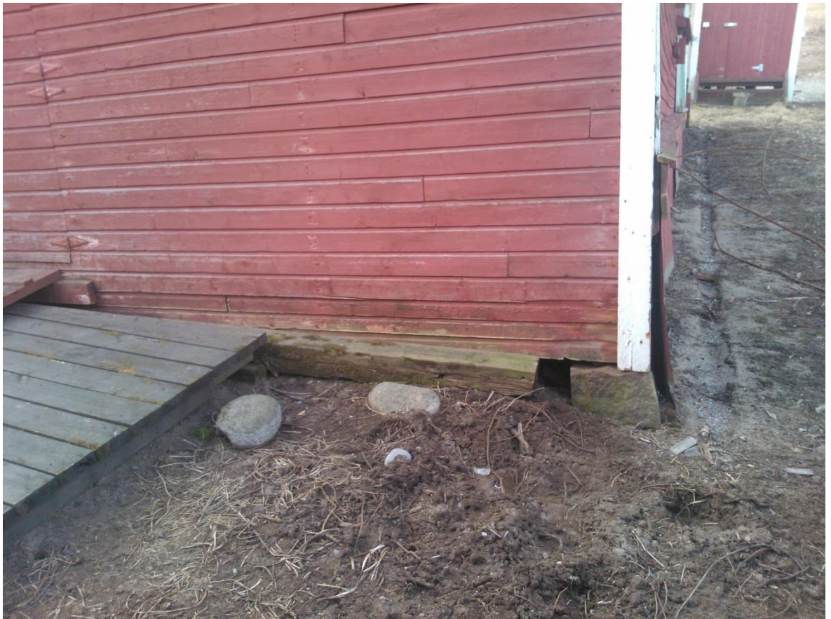
Kuvio 11. Routimisen siirtämä nurkkakivi.

Routimisongelmasta päästään eroon vaihtamalla maa-aines sellaiseen, jossa hienoainesta ei ole sekä eristämällä niin ettei routa pääse maahan sisälle. Tapauskohtaisesti korjattaessa tehdään yleensä molempia vaihtoehtoja. Kuvassa nähdään routimisen siirtämä rakennuksen nurkkakivi. (Kuva 11.)