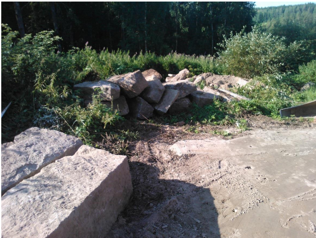
Kuvio 16. Kivien järjestelyä.

Pääosin työmaa toteutettiin kolmen rakennusmiehen ja 13 tonnin telakaivinkoneen avulla. Lisäksi pienempiä siirtoja toteutettiin etukuormaajan kauhalla sekä trukkipiikeillä varustetulla maataloustraktorilla. Maa-ainekset sekä anturavalussa käytettävä betoni hankittiin alihankintana paikallisilta yrityksiltä. Työnvaiheet ovat selitettynä pääpiirteittäin, tarvittavine materiaaleineen sekä työkaluineen.