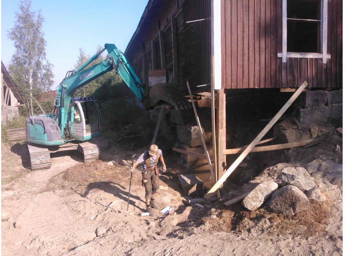
Kuvio 18. Seinän nosto pullotunkilla.