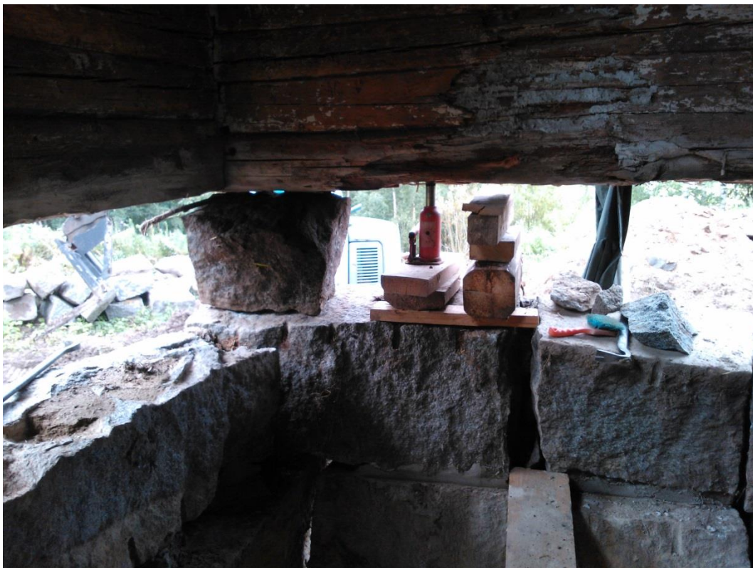
Kuvio 24. Varsinainen tunkkauspilari poistettu, kulman tunkkaus kiven päältä.