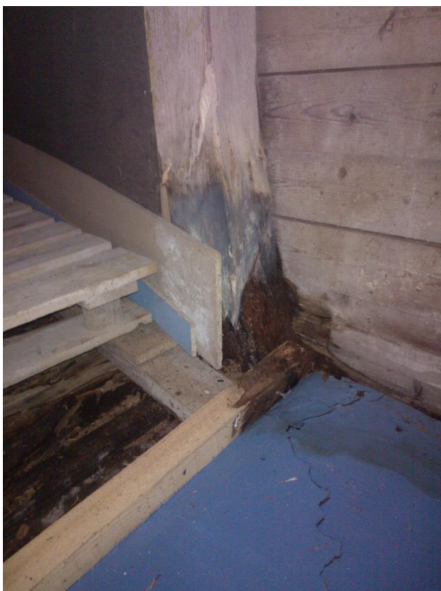
Kuvio 5. Alapäästään lahonnut runkotolppa.