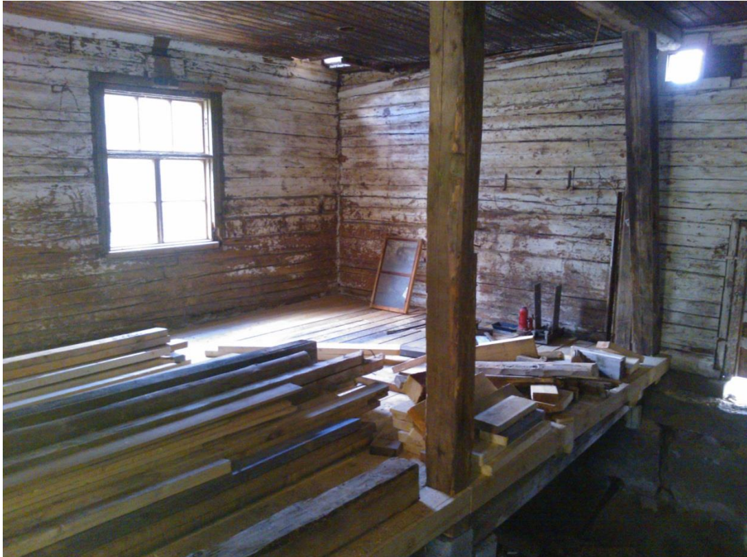
Kuvio 31. Rossipohja ja rossipohjalankkuja.

Kylmän rossipohjan runko on tehty purkutavarasta jonka poikkileikkaus on 100*100, ja itse kansi on paikallisen sahan jämäeristä hajamittoja 50*100, 50*125 sekä 50*150 lankkutavaraa. Runkopuut ovat k900 jaolla, ja kansi naulattu kahdella 31*90 konenaulalla jokaisesta runkopuusta. Huoltoluukkuja jätettiin kaksi kappaletta, mikäli tulee tarvetta mennä tarkastelemaan lattian alapuolisia rakenteita.