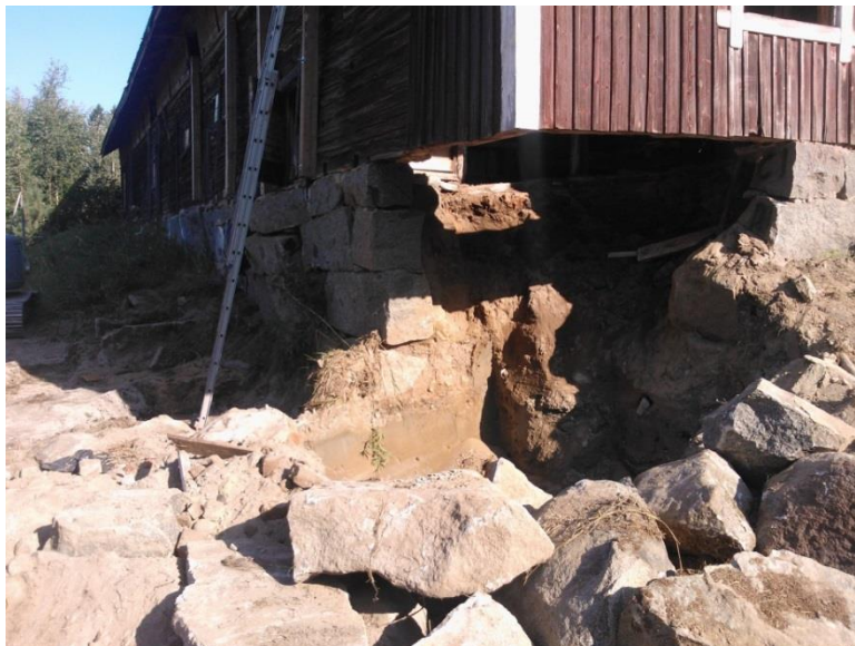
Kuvio 15. Romahtamassa olevat osat purettuna.

Rinteessä olevan rakennuspaikan yläpuoleinen salaojitus on ollut toimimatta vuosia. Näin pintavedet ovat päässeet maanvaraisen laatan alle ja aiheuttaneet luonnonkivistä tehdylle perusmuurille kohtuuttoman maanpaineen routimisilmiön