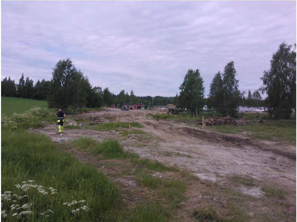
Kuvio 10. Laivaranta-alueen perusparannuksesta kuva kesältä 2013. Etualalla näkyvä tummempi kohta on erittäin kostea lähde joka kuivui vasta kesäkuussa.

Orsivesi tarkoittaa vesiesiintymää joka jää maaperään huonosti vettä läpäisevän kerroksen päälle kun pintavesi imeytyy maaperään. Jäättyessään nämä vesiesiintymät muodostavat jäälinssiä maaperään. (Jääskeläinen 2011, 42-43).