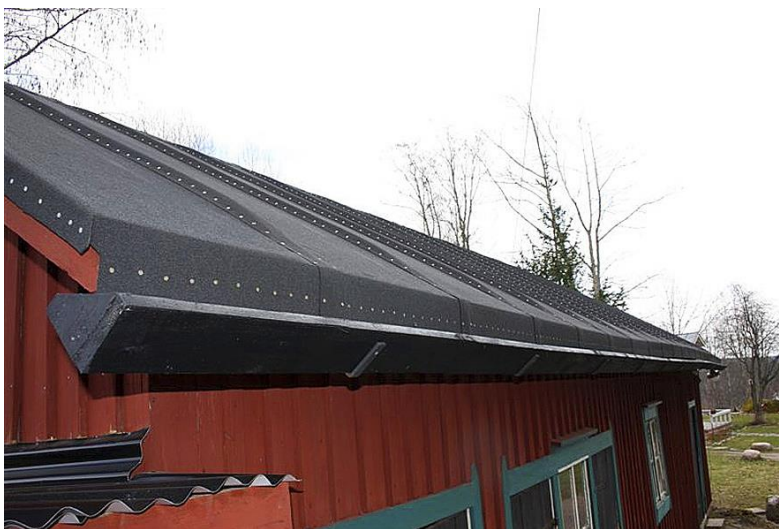
Kuvio 35. Puuränni Suomela lehden artikkelissa.

Hyvännäköinen puurännin kuva löytyi Suomela-lehden verkkoartikkelista, mutta harmittavasti itse rännistä ei kerrottu mitään. Kiinnikkeet kourulle voidaan tehdä lattaraudasta taivuttamalla ja käsittelemällä metallimaalilla. Huomioitavaa kuvassa on että katemateriaali on kolmiorimahuopa eikä päre kuten makasiinirakennuksissa. (Suomela).