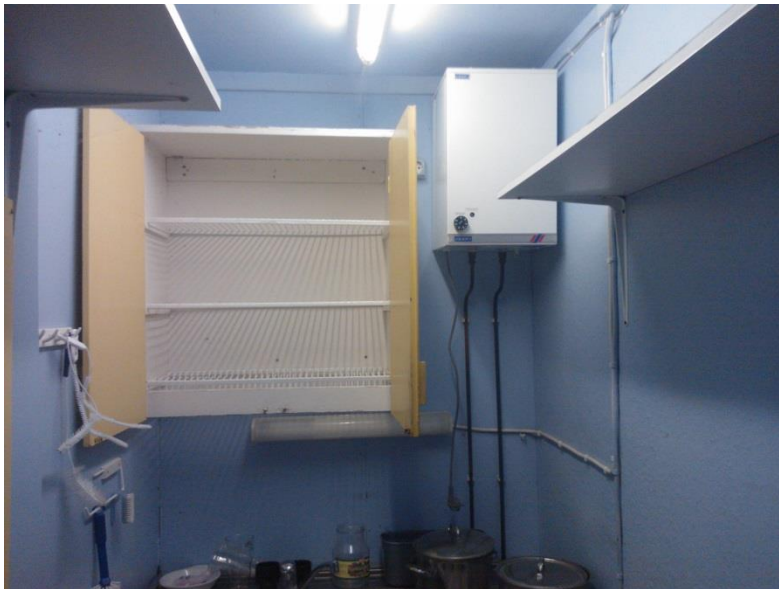
Kuvio 33. Kahvilatoimintaa varten rakennettuja tiloja.

Rungon sisältä tullaan purkamaan ylimääräiset rakenteet, joita näkyy kuvasta 33. Nämä ovat kevyitä, väliseiniä jotka eivät kuulu kantaviin rakenteisiin eivätkä vaiku-