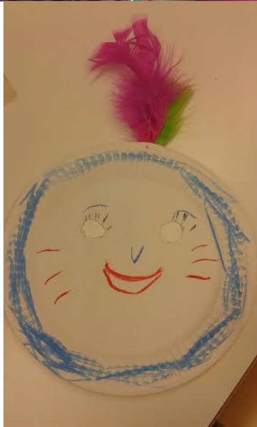
Kuvat: Minna Kettunen 2014