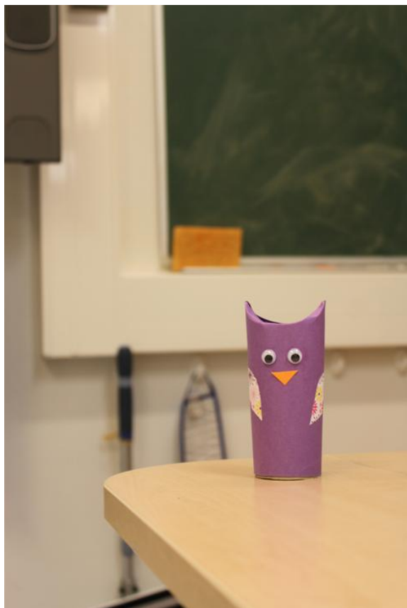
KUVA 1. Pöllöaskartelu.

Kokkikerhoomme osallistuminen oli vapaaehtoista, kuten myös johonkin ohjaustuokion toiminnoista. Emme pitäneet kirjaa paikalla olleista. Sillä tarkoituksena oli, että kerhossa viihtyy ja mikään ei ole pakonomaista. Kerholaiset tiesivät osallistuvansa opinnäytetyön toiminnalliseen osuuteen ja kerroimme siitä heille avoimesti, sillä koemme, että se on yksi tärkeä osatekijä luotettavuuden syntymiseen. Tavoitteenamme oli luoda kokkikerhoon sellainen ilmapiiri, jossa lapset tuntevat, että heillä oli mahdollista sanoa mielipiteensä ja vaikuttaa. Otimme lasten mielipiteitä huomioon niin paljon kuin mahdollista niin toiminnan suunnittelussa, kuin toteutuksessakin valittaessa askarteluja ja ruokia mitä valmistetaan. Sen lisäksi, että lapsi kokee mielipiteensä arvostetuksi, myös mielekkyys tekemistä kohtaan lisääntyy, kun saa toteuttaa jotain, minkä suunnittelemiseen on itse voinut vaikuttaa.