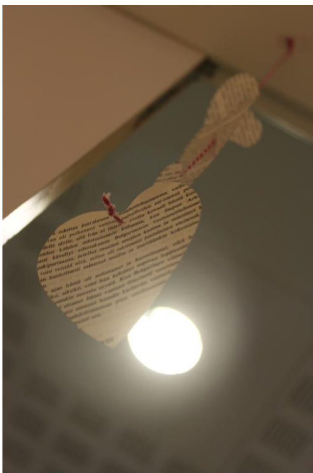
KUVA 2. Sydänmobile.

kaa, kokkikerhollemme vaikutti kuitenkin siihen, että emme voineet toteuttaa toiveita täyttävien ruokien valmistamisesta. Päätimme, että tehdyt ruoat olivat enemmänkin iltatai aamupalan kaltaisia tai muutoin kevyitä, kuten salaattia, mysliä, sämpylöitä tai smoothieta. Rohkaisimme siihen, että vanhemmat ja lapset toisivat omia mielipiteitään esille myös kerhon aikana. Kiinnitimme huomiota siihen, että kohtelimme jokaista kerhon jäsentä tasa-arvoisesti ja annoimme apua jokaiselle, joka sitä tarvitsi. Pyrimme resepteissä siihen, että ne olisivat mahdollisimman monipuolisia ja erilaisia. Kaikkein suotuisin ympäristö oppimiselle mielestämme on avoin, innostava, kannustava ja haastava. Kerhossamme loimme olemusta ja ympäristöä, joka toimisi rohkaisevasti sekä kannustavasti sekä tätä kautta loisi mahdollisuuksia onnistumisen kokemuksille.