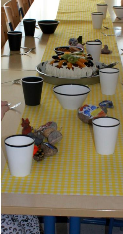
KUVA 3. Ruokailun aloittelua. Valokuva Heidi Pirinen 2014

Viimeistä kerhokertaa päätimme juhlistaa leipomalla täytekakun (kuva 3), johon väliin tuli itse tehty omenahilloke sekä kermavaahtoa. Päälle puolestaan tuli erilaisia hedelmiä, banaania, kiiviä viinirypäleitä ja appelsiinia. jokainen lapsi sai vuorotellen kokeilla ker- man pursottamista kakun reunoille. Teimme myös suolaisen kinkku-kasvis piiraan. Aloiti- timme kerhomme tuttuun tapaan lukemalla ohjeet, jotka käytiin yhdessä läpi, sekä ja- kamalla jokaiselle tehtävät, jotta päästäisiin alkuun. Kysyimme joka kerralla mitä kukin haluaisi tehdä, kun olimme ensin antaneet vaihtoehtoja. Kakku koristeltiin lopuksi yhdes- sä, jonka jälkeen rauhoituimme syömään tehtyjä ruokia. Ruokailun lomassa juttelimme kuluneesta kuukausista kerhon parissa ja kyselimme mielipiteitä ja kommentteja.