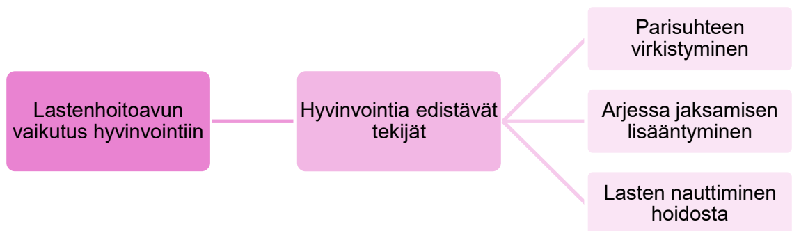
Kuvio 3. Lastenhoitoavun vaikutus hyvinvointiin

– – Resurssipankin kautta meillä kävi yhtenä iltana hoitaja joka oli aivan ihana ja lapset olivat oikein innoissaan. Yritettiin saman hoitajan kanssa järjestää muitakin iltoja ja yhden yön reissua mutta aikataulut eivät sopineet yhteen. Etenkin lasten kannalta tämä oli ihana asia, he tykäsivät hoitajaan ja kyselivät koska tulisi uudestaan.