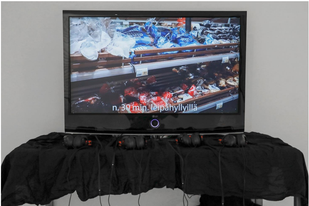
Ripustuskuva, Taidekeskus Mältinranta