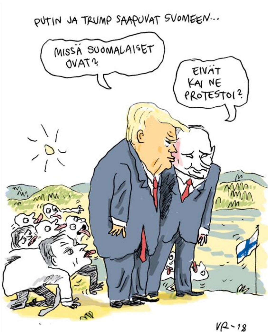
KUVA 8. Trump ja Putin tulevat – näin suomalaiset osoittavat vieraanvaraisuutta. Ville Rannan pilapiirros. Demokraatti 2.7.2018.

Kuvan 8 denotaatio on, että kaksi miestä seisovat puvut päällä. Heidän takanaan maassa on useita henkilöitä kielet ulkona. Aurinko paistaa ja maisema on maalaismainen. Kuvassa oikealla on lippu, ja kuvan kaksi miestä seisovat sitä kohti. Maassa makaa kaksi henkilöä niin ikään kielet ulkona.