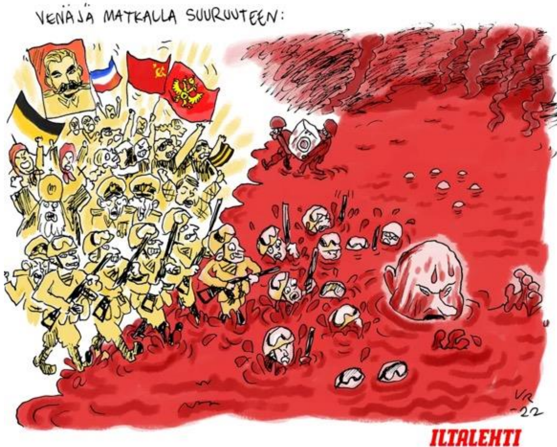
KUVA 11. Make Venäjä great again. Ville Rannan pilapiirros. Iltalehti 8.4.2022.

Tämän pilapiirroksen (kuva 11) denotaatio on punaisessa nesteessä uiwa isopäinen mies. Häntä seuraavat ovat sotilailta vaikuttavia henkilöitä. Osa heistä on vielä kuivalla maalla, ja heidän perässään on muuta väkeä. Takimmaisiet henkilöt kantavat lippuja ja viiksekkään miehen kuvaa. Kauempana kaksi sotamiestä kantaa pyykkikonetta. Piirroksessa on voimakkaan punainen väritys.