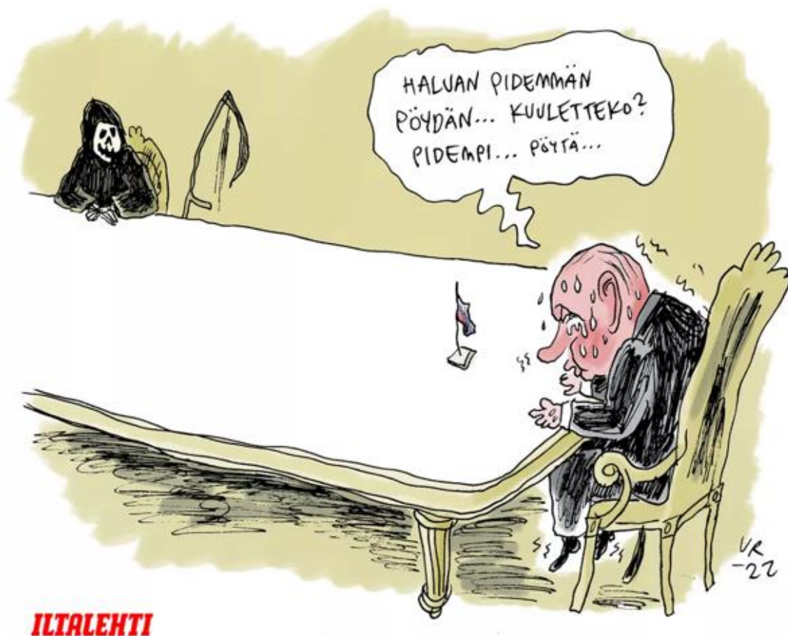
KUVA 10. Pöytää ei voi pidentää loputtomasti, Putin. Ville Rannan pilapiirros. Iltalehti 1.3.2022.