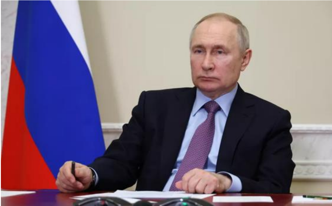
KUVA 5. Venäjän presidentti Vladimir Putin. Iltalehti 31.1.2023.