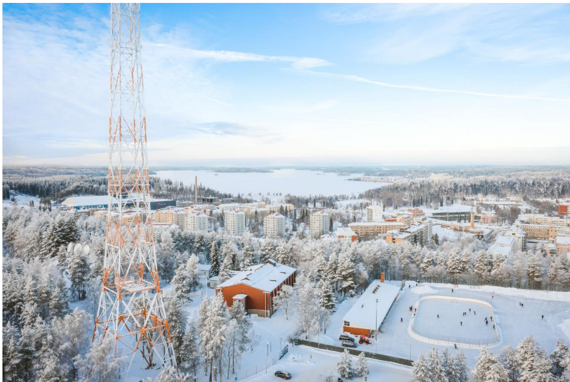
Kuva 1 Lahden maisema talvella

Lahti tarjoaa monipuolisen ja inspiroivan ympäristön konferenssien järjestämiseen. Kaupunki sijaitsee käveltävän kompaktissa ympäristössä, jota ympäröi puhdas Järvi-Suomen luonto. Tämä luo ihanteelliset puitteet tieteellisten tapahtumien järjestämiselle, tarjoten samalla osallistujille mahdollisuuden nauttia kaupungin ainutlaatuisesta tunnelmasta. (Visit Lahti c.)