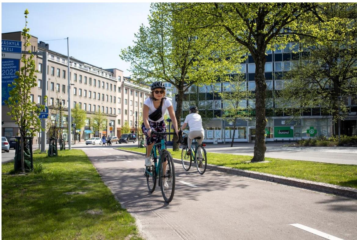
Kuva 2 Pyöräilijöiden suosima keskusta

Kongressien ja tapahtumien järjestämisen osalta Lahti tarjoaa useita ympäristöystävällisiä vaihtoehtoja. Esimerkiksi Lahden Sibeliustalo on saanut kansainvälistä tunnustusta kestävästä kokouspalveluistaan. Sibeliustalo pyrkii minimoimaan ympäristövaikutuksensa tarjoamalla ekologisia ruokavaihtoehtoja, kierrättämällä jätteitä ja käyttämällä uusiutuvaa energiaa. (Koko Lahti.)