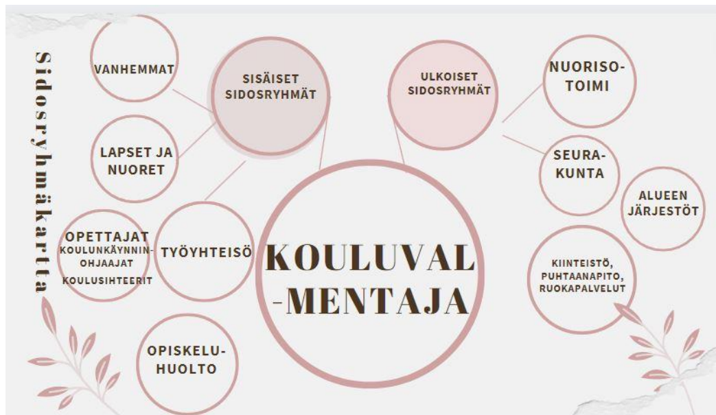
Kuva 1: Sidosryhmäkartta

Kouluvalmentaja tekee yhteistyötä monien eri toimijoiden kanssa, joita kuvaan sidosryhmäkartan (kuva 1) avulla. Sisäisiä sidosryhmiä ovat lapset, nuoret ja vanhemmat, työyhteisö, johon kuuluu kaikki, joiden kanssa säännöllisesti työskennellään, kuten luokanohjaajat, aineopettajat, laaja-alaiset erityisopettajat, rehtorit, opiskeluhoito ja koulunkäynninohjaajat sekä koulusihteerit. Lisäksi päivittäin kohtaan koulun muuta henkilöstöä, kuten kiinteistö-, siivous, ja ruokapalveluista, joiden kanssa keskustelemme ilmiöistä, jotka koskettavat heidän työtään ja toimin linkkinä esimerkiksi rehtorin suuntaan. Ulkoisia sidosryhmiä ovat esimerkiksi nuorisotoimi, seurakunta, alueen järjestöt ja lähipoliisi.