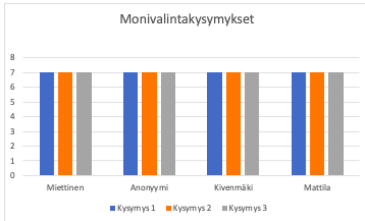
Kaavio 1 Haastateltavien taustatiedot

Kaikki haastateltavamme ovat meritoituneita oman alansa huipputaiteilijoita. Kaikilta löytyy useamman vuoden kokemus valmentamisesta ja näin ollen jokaisella läpikäytyä useampi Porin Ässien sekä Suomen jääkiekkoliiton järjestämä koulutus. Kaaviossa 1. esille tuleekin selkeä linja, että jokainen haastateltavamme vastasi samalla tavalla jokaiseen monivalintakysymykseen.