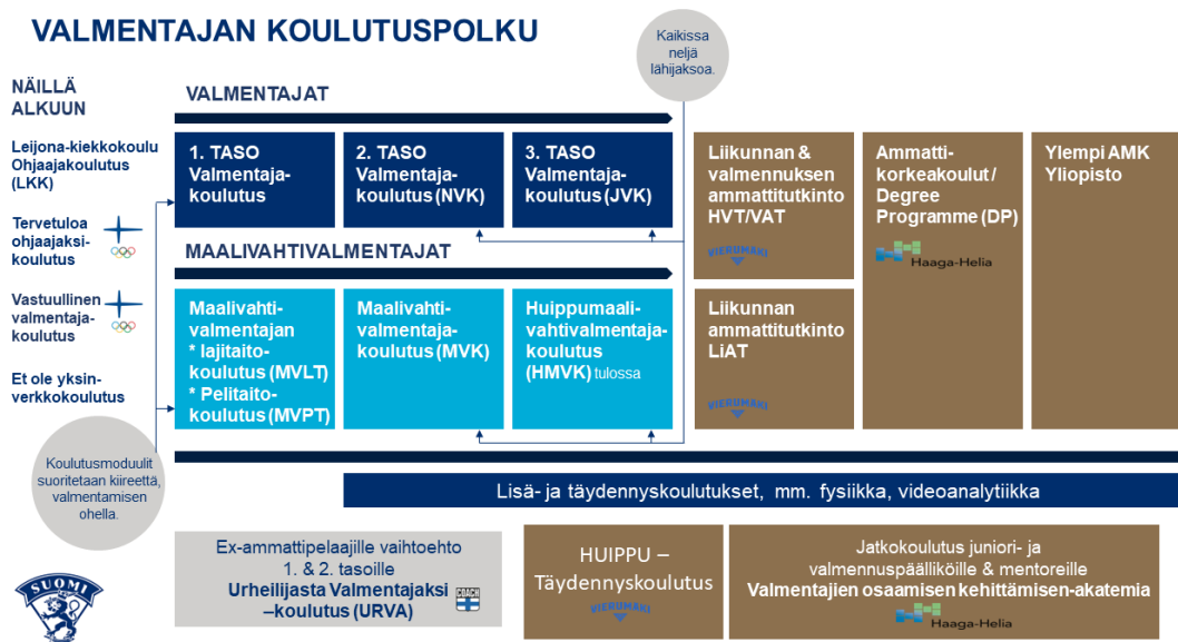
Kuva 4. (Suomikiekkokatemia, n.d.)

ns. perusopintoja, joissa käydään monipuolisesti läpi kaikkea valmennukseen liittyvää ja ennakoidaan tulevaa) Kuvassa 4. kouluttautumiskaavio, jossa mukana mm. ex-pelaajien koulutuspolku.