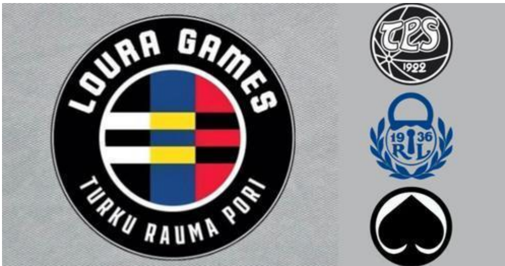
Kuva 2.

hankkimaan parhaita pelaajia pienemmistä seuroista, ja täten vahvistaa omia joukkueitaan ja juniorituotantoaan. Sateenvarjoseurojen olemassaolo antaa tälle hyvät edellytykset. Pelaajia siirtyy monesti myös ympäri Suomea pelaamaan isompiin seuroihin pienemmiltä paikkakunnilta, useimmiten U16 ja U18 ikäluokkien aikana. Porin Ässiin on liittynyt vähän yllättäenkin hyvin paljon junioripelaajia Pohjois-Suomesta, kuten Oulun alueelta. Pori onkin suosittu kohde sellaisille pelaajille, jotka ovat jääneet pieneen rooliin suuremmissa seuroissa, kuten juuri esimerkiksi Kärpissä.