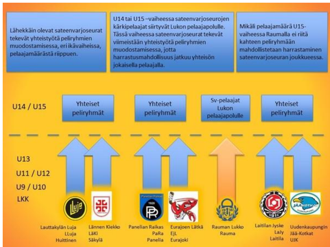
Kuva 1. (Rauman Lukko RY, n.d.)

28.02.2023) Alla olevassa kuvassa (Kuva 1.) Porin Ässien suurin kilpailija Rauman Lukko on avannut omaa sateenvarjoseuratoimintaansa ja kertoo nettisivuillaan, miten toiminta käytännössä toimii. (Rauman Lukko RY, n.d.) Porin Ässien nettisivulta ei vastaavaa kaaviota tai kertomusta löydy. Ässät ilmoittaa ainoastaan seurojen olemassaolon nettisivuillaan listauksena, josta pääsee linkkiä napauttamalla kyseisen seuran kotisivuille.