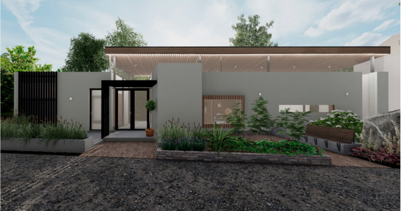
KUVA 2. Visualisointikuva rakennuksen pohjoispuolelta. Iso ulokkeellinen puuverhoiltu ikkuna tehtiin leikkitalaan lapsen tasolle. Pitkät ikkunanauhat keventävät rakennuksen korkeaa massaa. Rimoitukset julkisivussa sekä sisäänkäynnin käytävämäinen katos luovat kontrastia valkoiselle rappaukselle. (Kuva ja mallinnus: Jenni Myllynen, 2023.)