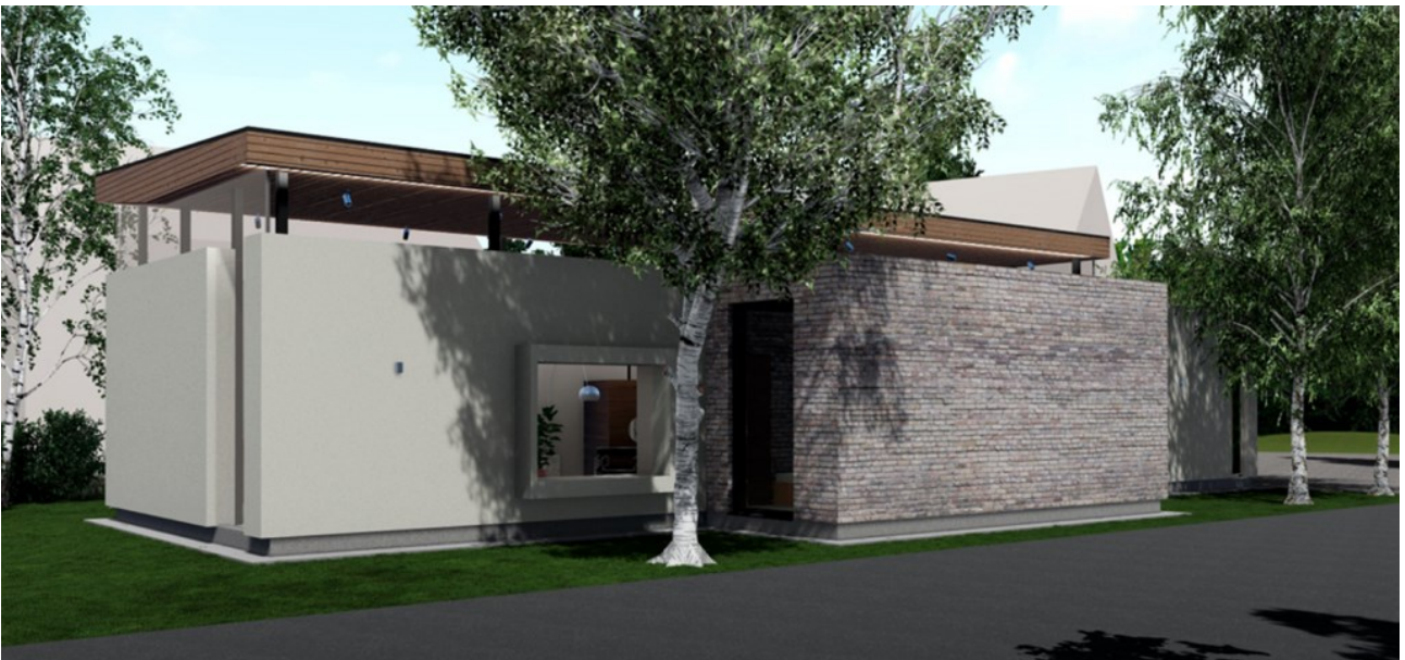
KUVA 3. Rakennuksen eteläpuolella työhuoneiden kohdalla on tiiliverhous, joka elävöittää ja rikkoo rakennuksen muuten pelkistettyä tyyliä. (Kuva ja mallinnus: Jenni Myllynen, 2023.)