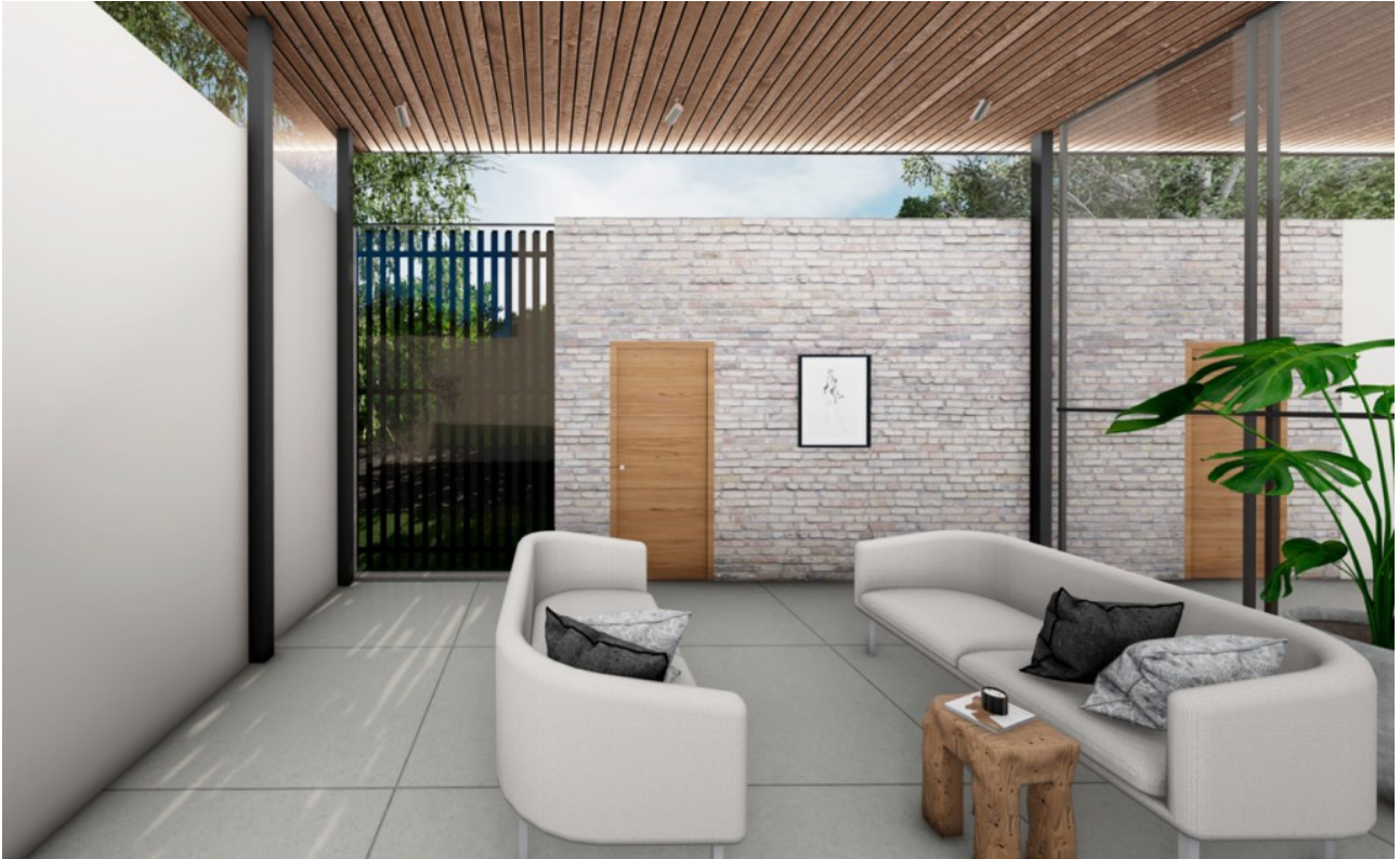
KUVA 4. Rakennuksen eteisaula sisäänkäynniltä päin visualisoituna (kuva ja mallinnus: Jenni Myllynen, 2023).

Rakennuksesta on pyritty suunnittelemaan monikäyttöinen, muuntojoustava ja arkkitehtonisesti laadukas kokonaisuus (kuva 4). Työ esiteltiin opinnäyteseminaarissa, ja esiin nousivat seuraavat kysymykset: Jos yhteiskäyttörakennus ei olekaan toimiva konsepti, miten siitä irtaannutaan? Miten rakennukselle löydetään uusi käyttötarkoitus?