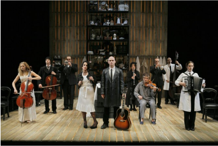
Kuva 1, Sweeney Todd, 2005 (Paul Kolnik)