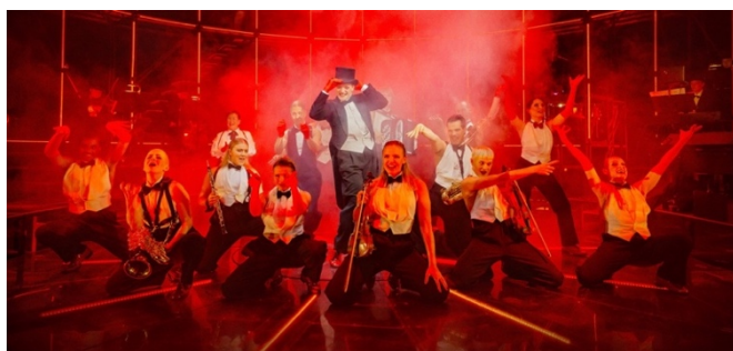
Kuva 6, Cabaret, 2022